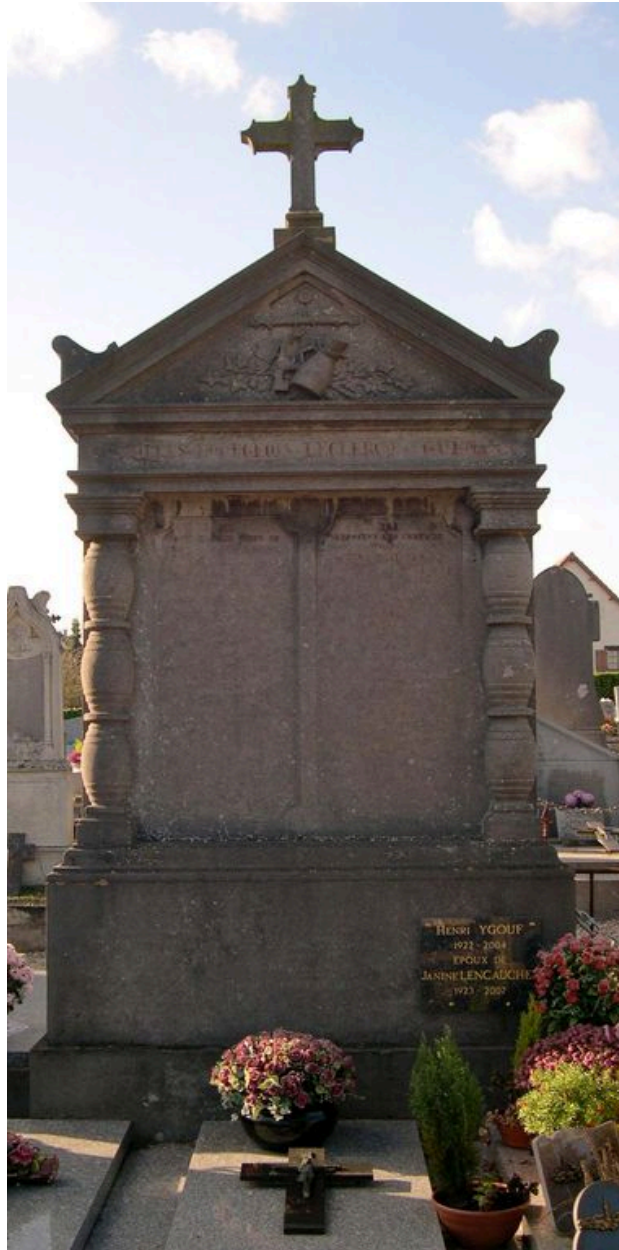
Vue de la stèle.