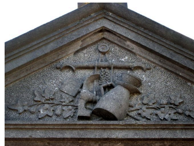
Vue sur le décor sculpté du fronton (emblème de profession).