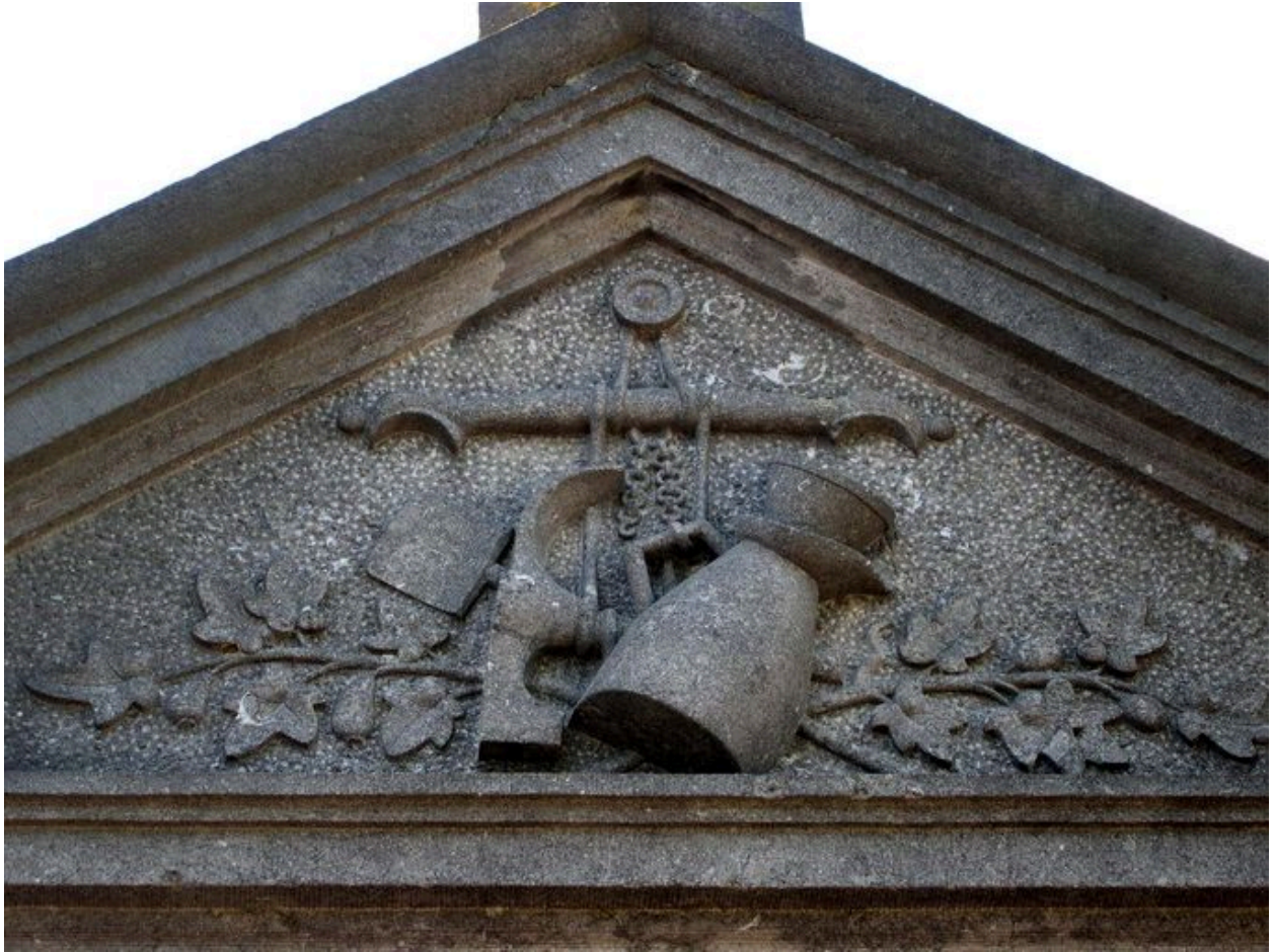
Vue sur le décor sculpté du fronton (emblème de profession).