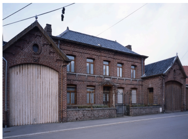
Maison de maître, 33 rue Alexandre-Dubois. IVR31_20095901359VA

IVR31_20045905501NUCA