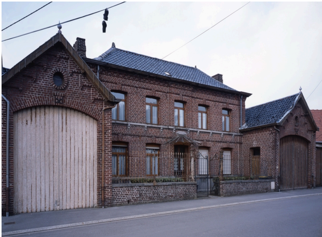
Maison de maître, 33 rue Alexandre-Dubois.