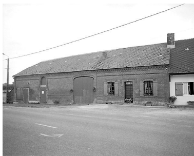
Vue générale. IVR22_19980202890X