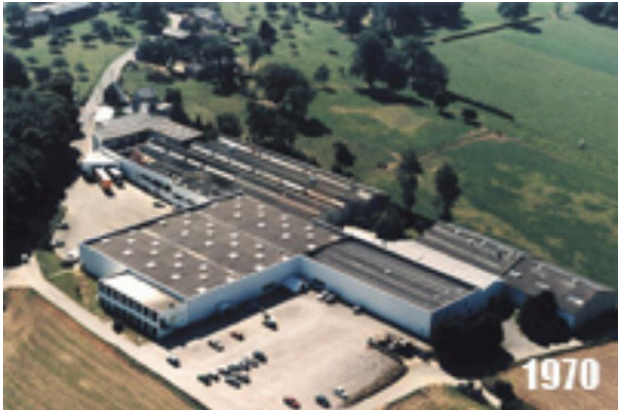
Vue des bâtiments de production, vers 1970.