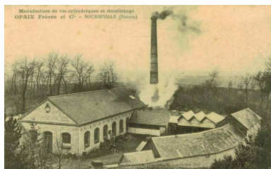
Bourseville. Vue générale de l'ancienne usine Opaix Frères et Cie. Carte Postale, vers 1905 (coll. part.). IVR22_20158005092NUCA