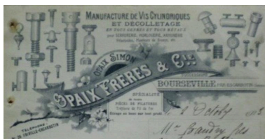
En-tête d'une facture de l'entreprise, vers 1920 (coll. part.).