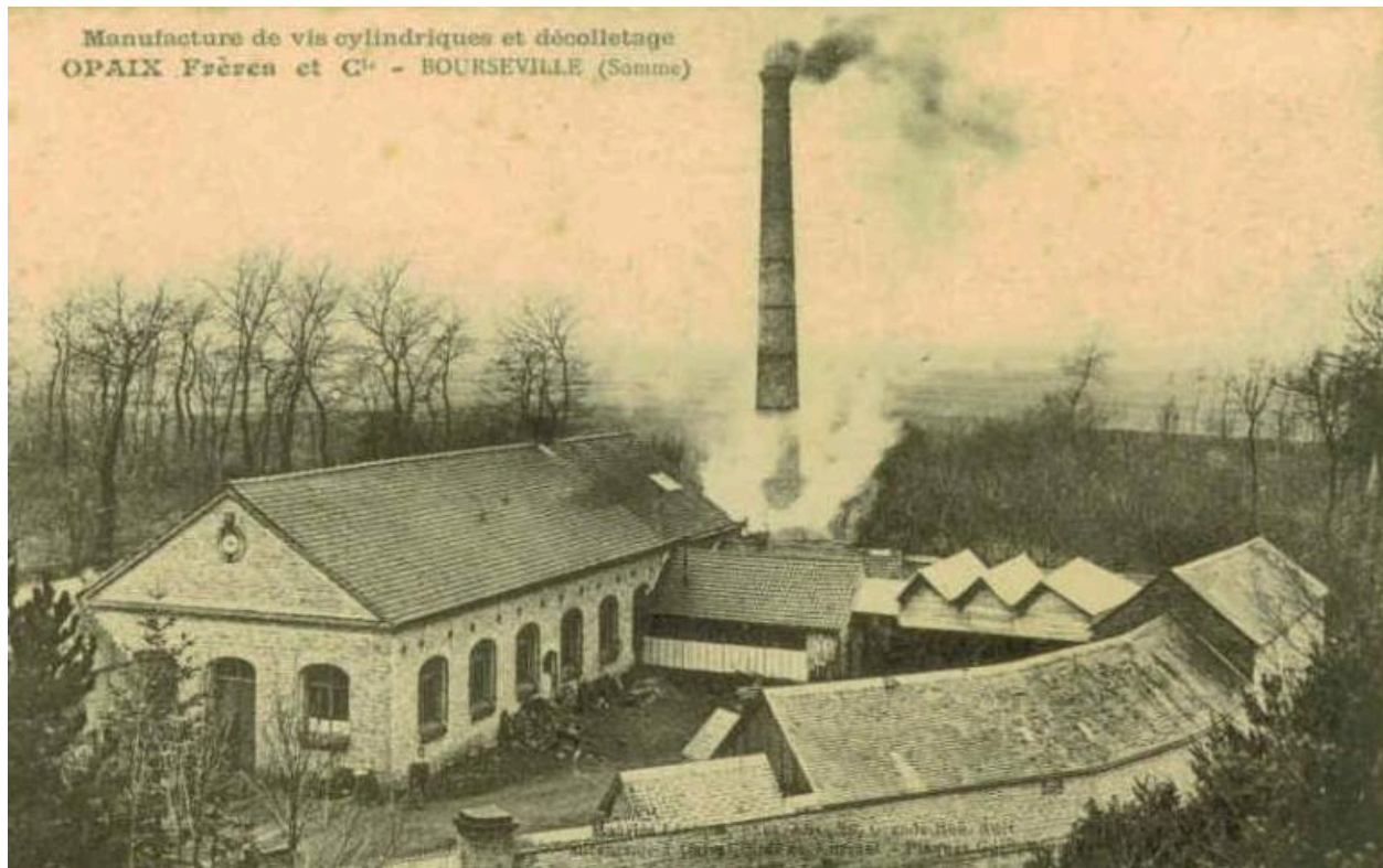
Bourseville. Vue générale de l'ancienne usine Opaix Frères et Cie. Carte Postale, vers 1905.