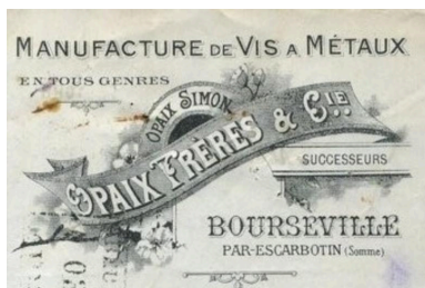
En-tête d'une facture de l'entreprise datant de 1936 (coll. part.). IVR22_20158005094NUCA