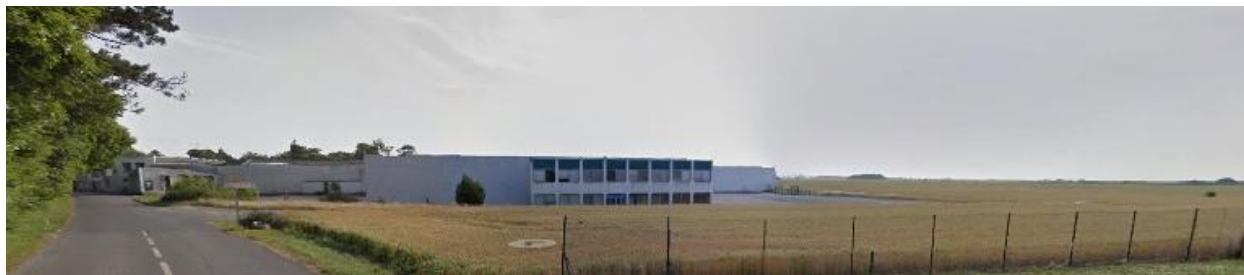
Vue des bâtiments de production, vers 2012.