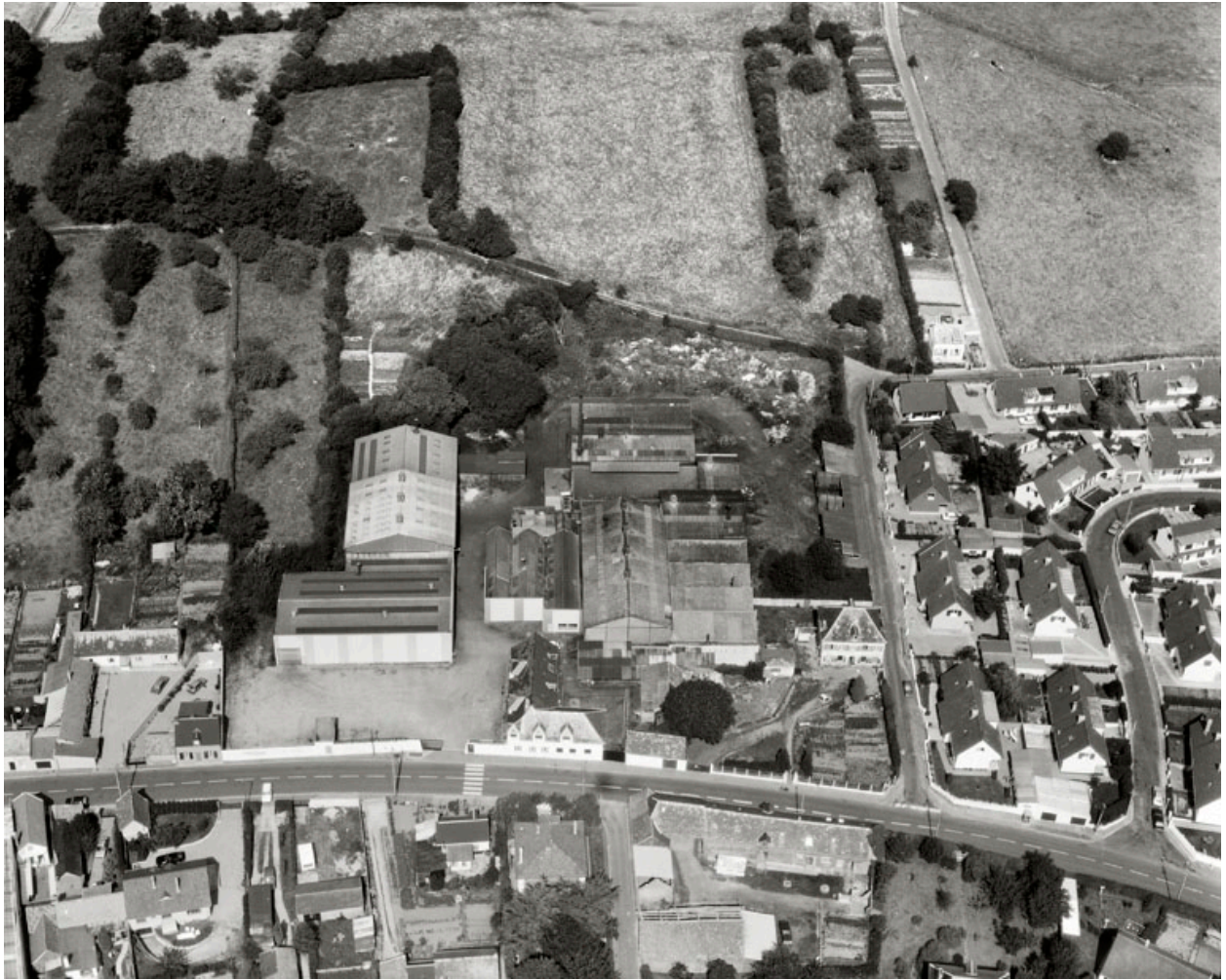
Vue aérienne, flanc ouest, en 1990.