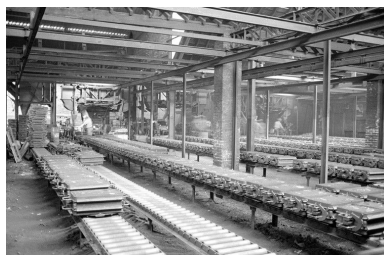
Atelier de fabrication, vue intérieure en 1990.