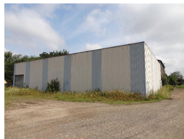
Ancien atelier de stockage.