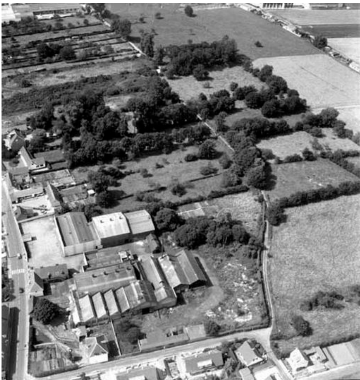
Vue aérienne, flanc sud, en 1990.