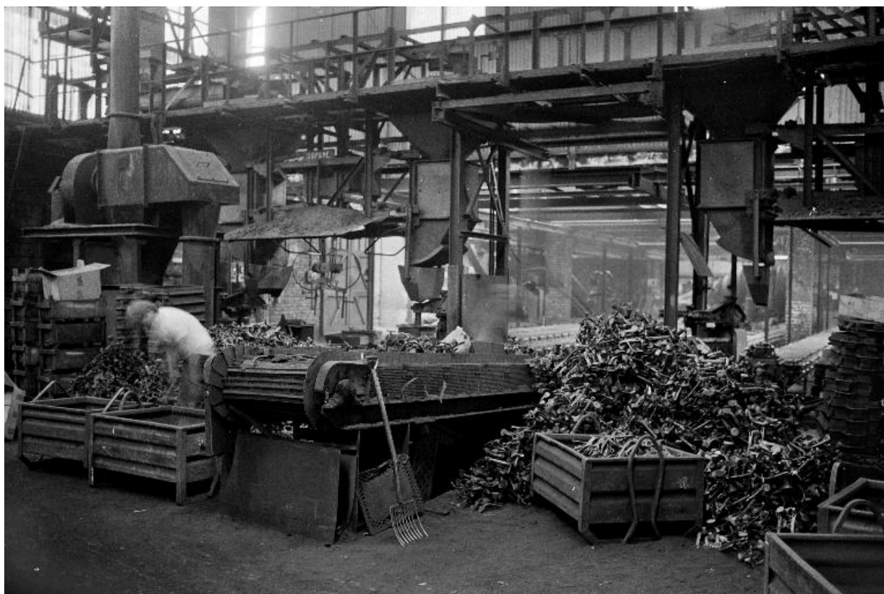
Atelier de fabrication, vue intérieure, en 1990.