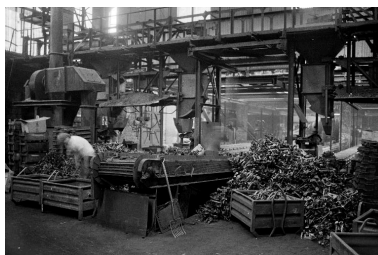
Atelier de fabrication, vue intérieure, en 1990.