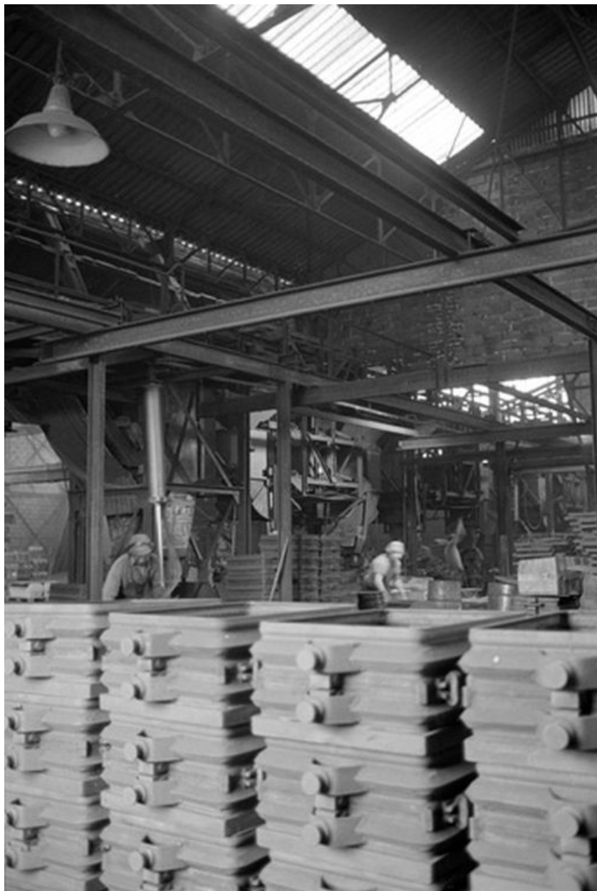
Atelier de fabrication, vue intérieure en 1990.