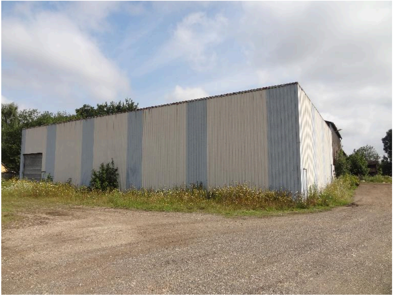
Ancien atelier de stockage.