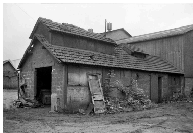
Atelier de fabrication, en 1990.