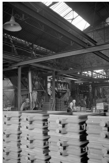
Atelier de fabrication, vue intérieure en 1990.