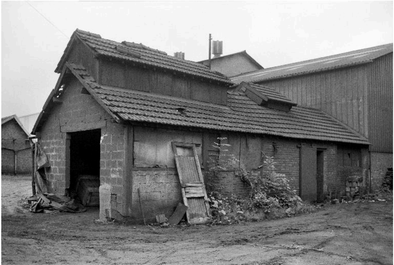
Atelier de fabrication, en 1990.