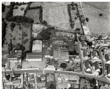
Vue aérienne, flanc ouest, en 1990.