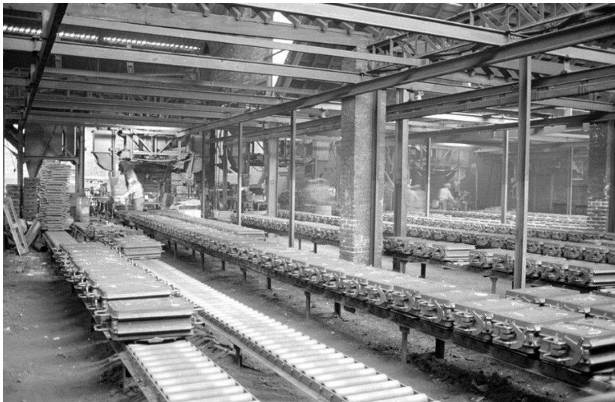
Atelier de fabrication, vue intérieure en 1990.