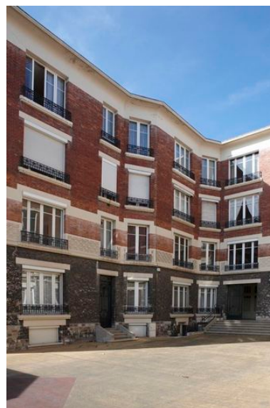
Partie latérale gauche de l'immeuble, à pans coupés. IVR31_20096200178NUCA