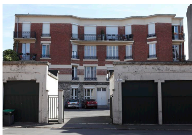
Vue sur cour de l'immeuble. IVR31_20096200280NUCA