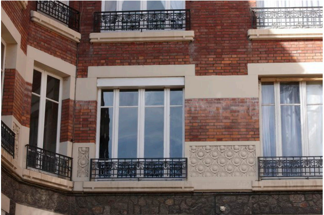
Bas-reliefs aux motifs floraux encadrant des baies aux garde-corps ornés d'épis de maïs renversés.