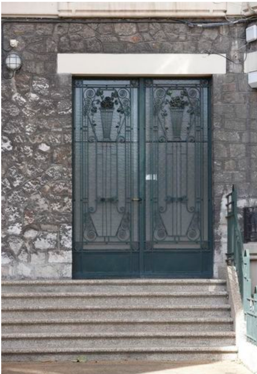
Porte en fer forgé ornée de spirales et de fleurs stylisées.