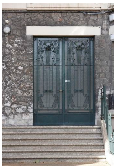
Porte en fer forgé ornée de spirales et de fleurs stylisées.