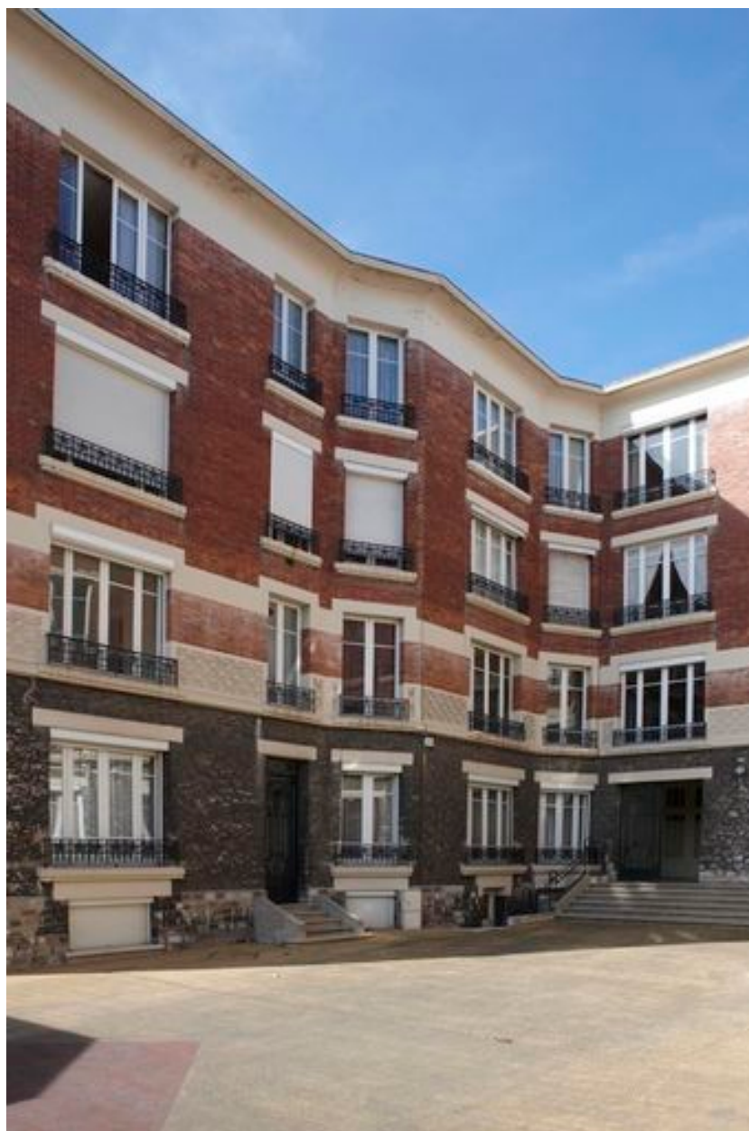
Partie latérale gauche de l'immeuble, à pans coupés.