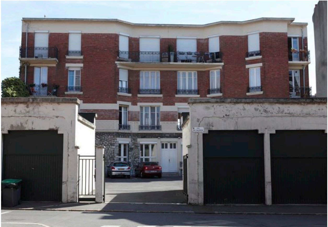
Vue sur cour de l'immeuble.