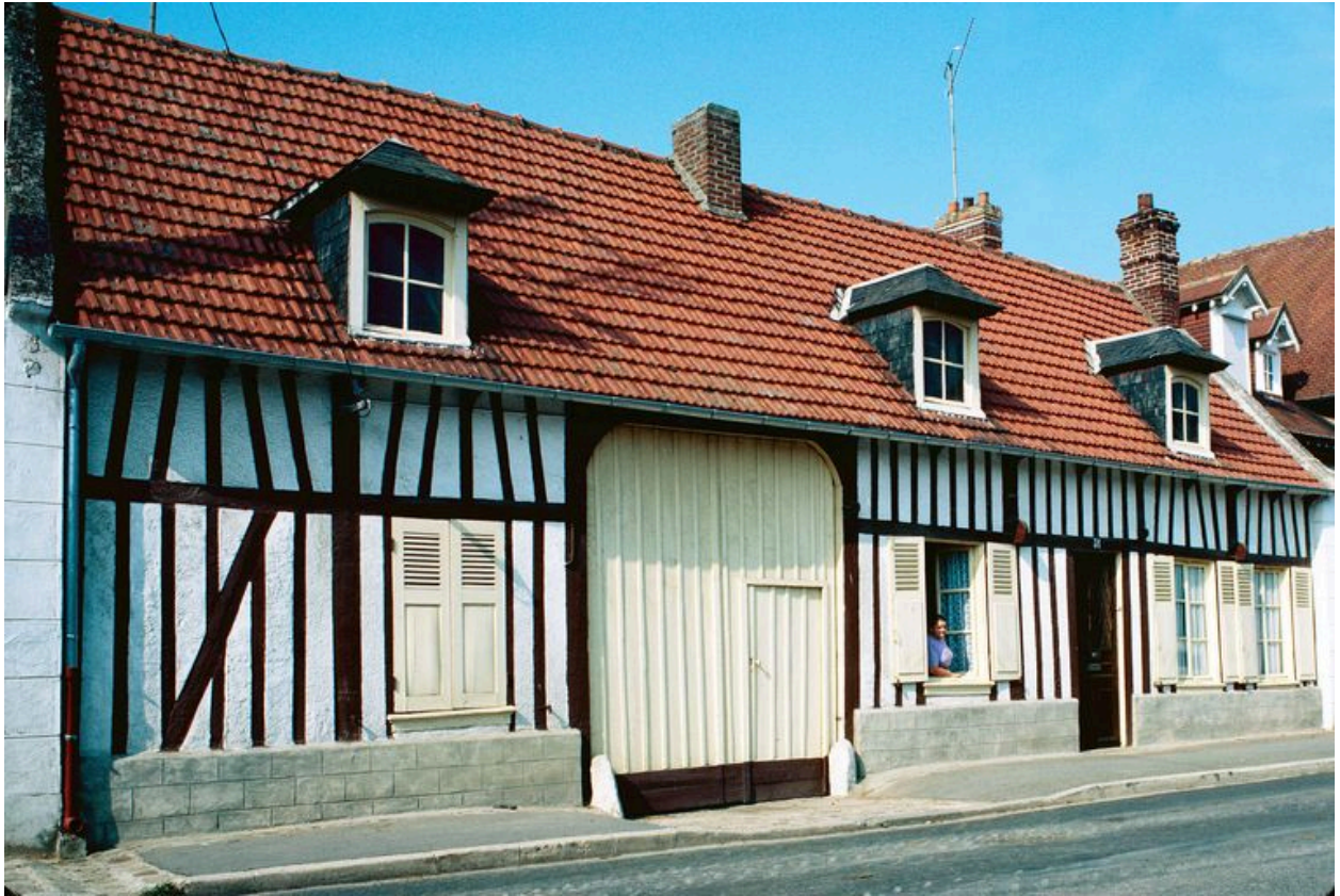
Elévation antérieure, de trois-quarts.