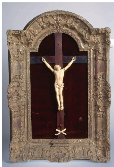
Vue d'ensemble. IVR22_19956000386XA