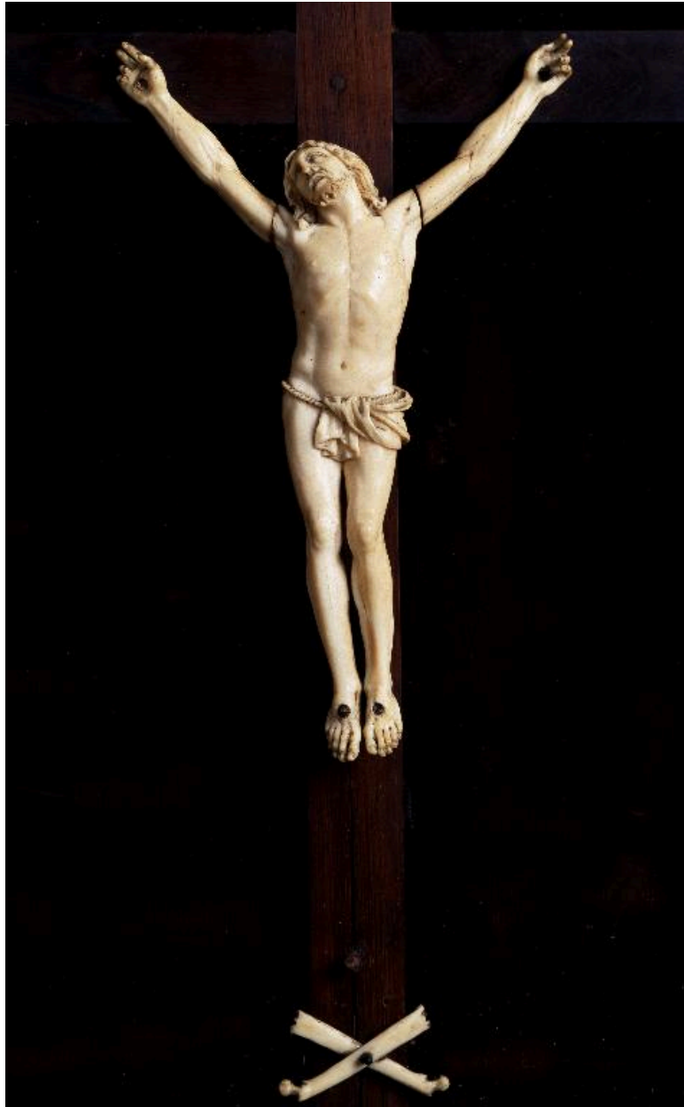
Vue de détail : le Christ.