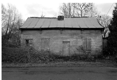
Vue générale. IVR22_19970202370Z