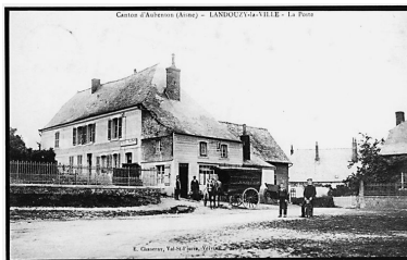
Vue de la maison, alors transformée en relais de poste.