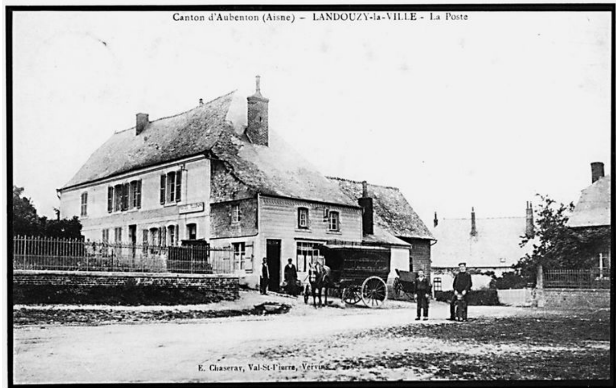
Vue de la maison, alors transformée en relais de poste.