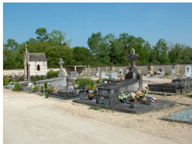
Vue générale. IVR22_20030202079NUCA