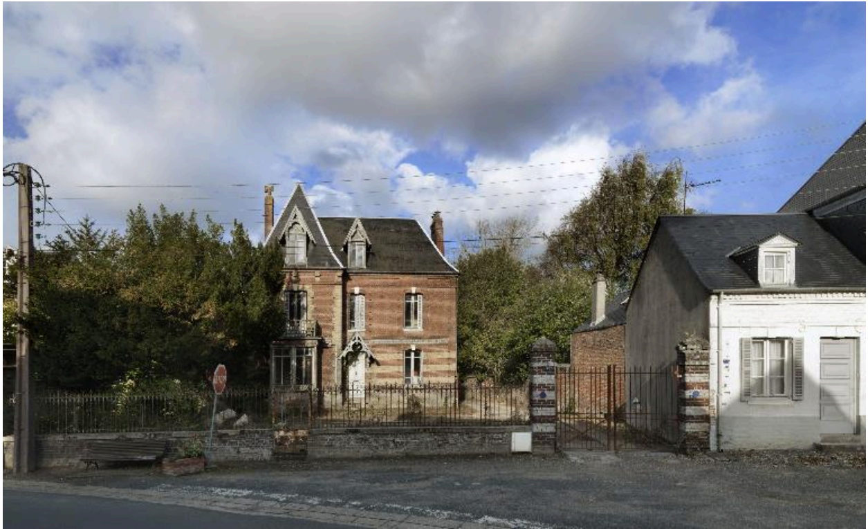
Vue générale depuis la Grande Rue.