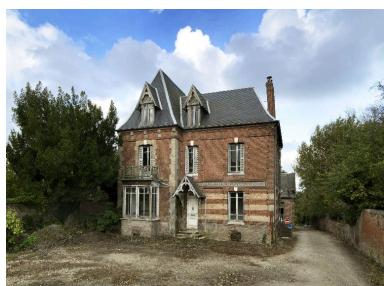
Ancienne maison du directeur de la fonderie, vue depuis la cour. IVR22_20148000644NUC2A