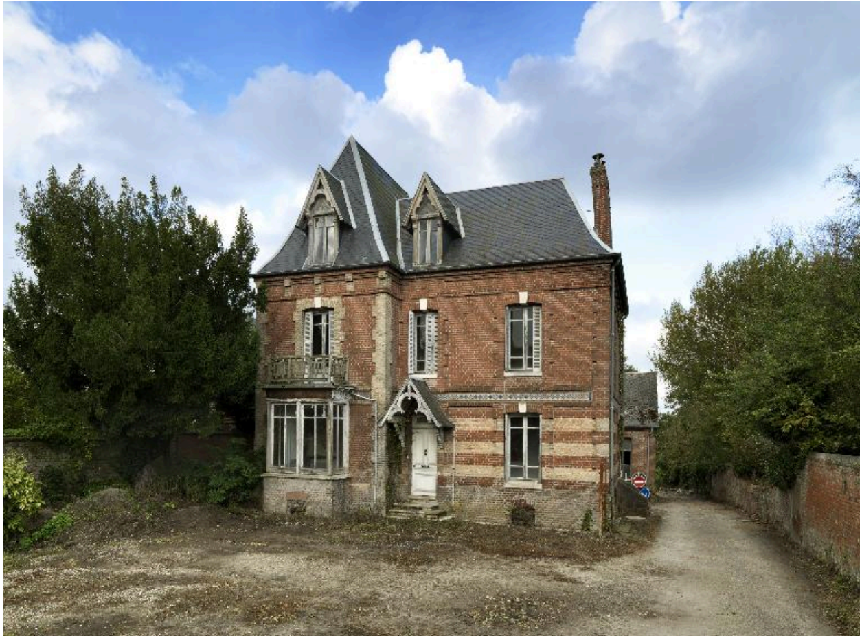
Ancienne maison du directeur de la fonderie, vue depuis la cour.