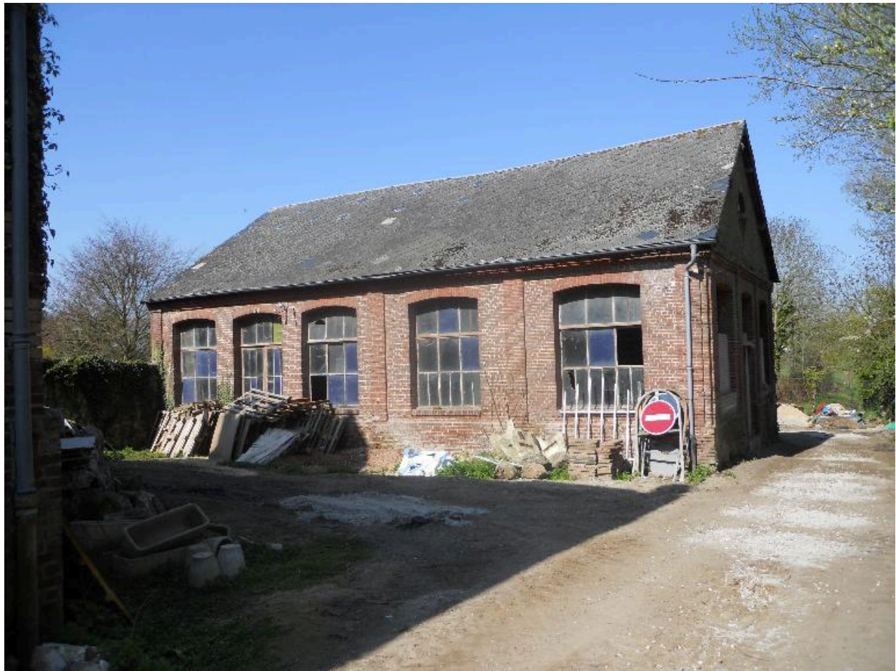
Vue de la fonderie.