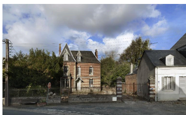
Vue générale depuis la Grande Rue. IVR22_20148000643NUC2A