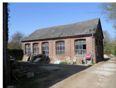
Vue de la fonderie. IVR22_20148005159NUC2A