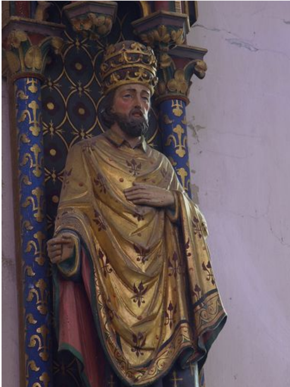
Sud : saint Corneille à mi-corps