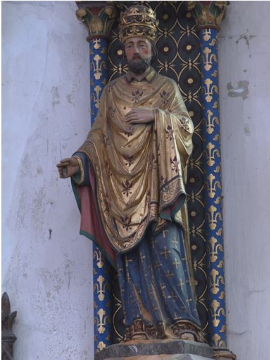
Sud : saint Corneille de face