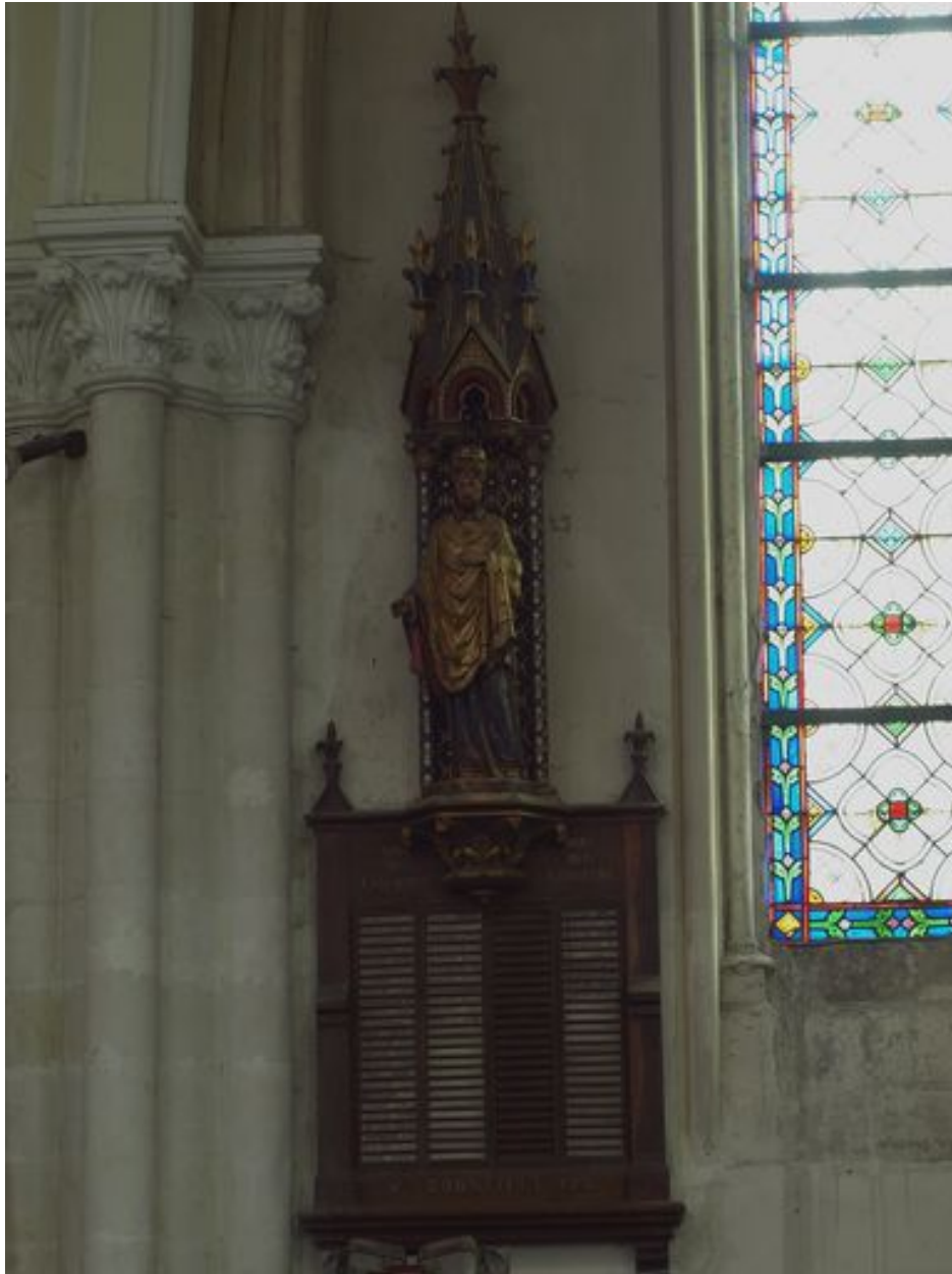
Sud : vue d'ensemble