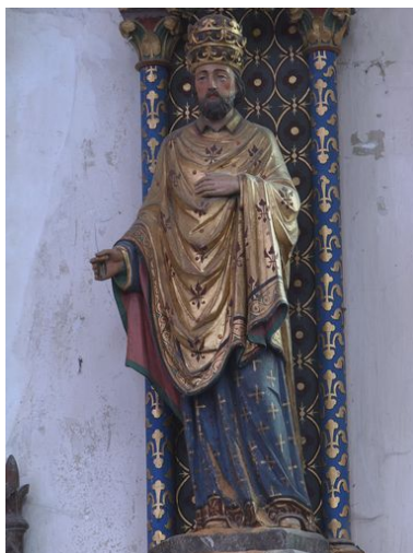
Sud : saint Corneille de face IVR31_20106202717NUCA