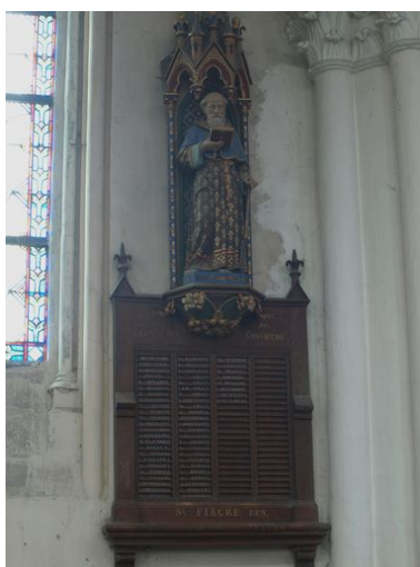
Nord : vue d'ensemble IVR31_20106202711NUCA