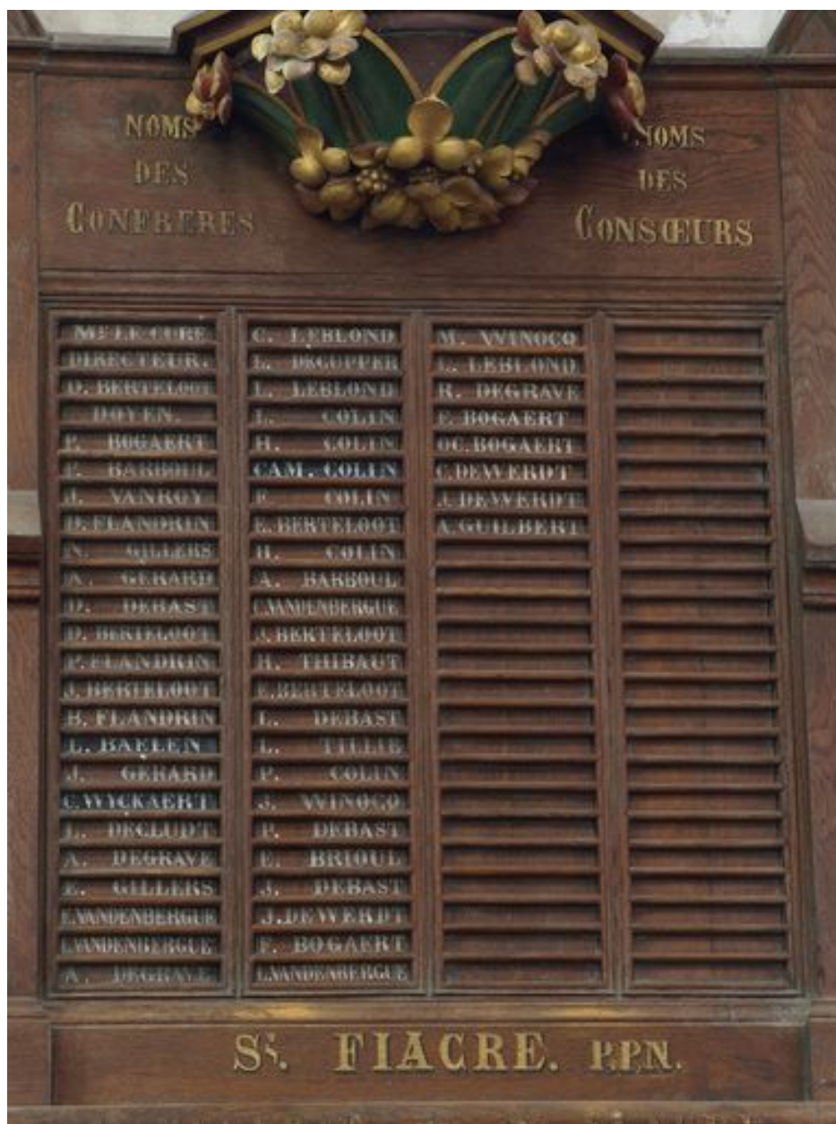
Nord : détail du tableau