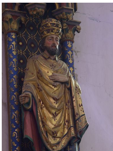
Sud : saint Corneille à mi-corps IVR31_20106202718NUCA