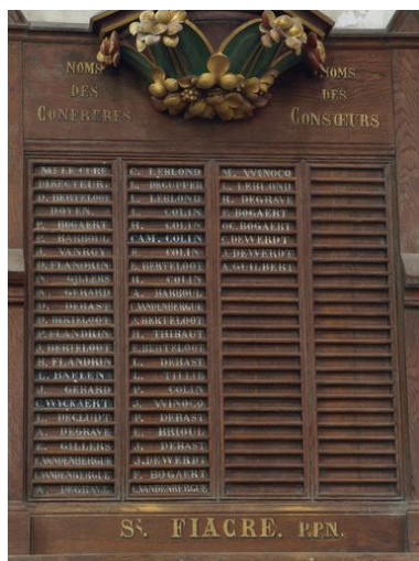
Nord : détail du tableau IVR31_20106202714NUCA