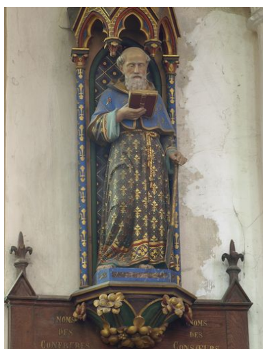
Nord : saint Corneille vu de face IVR31_20106202712NUCA