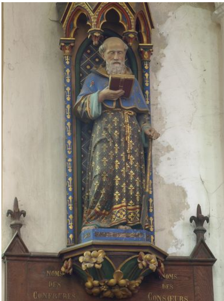
Nord : saint Corneille vu de face