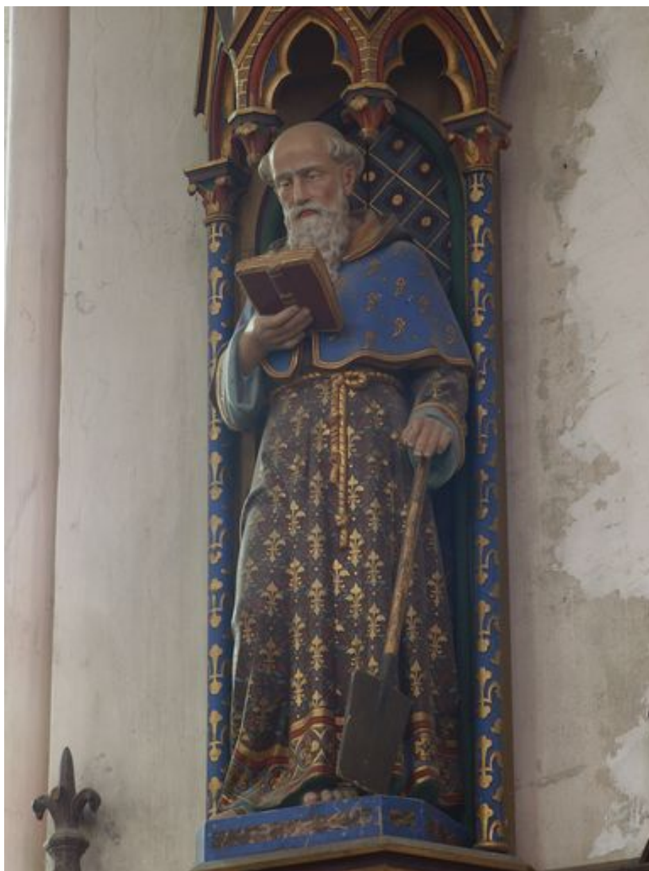
Nord : saint Corneille vu de trois-quarts