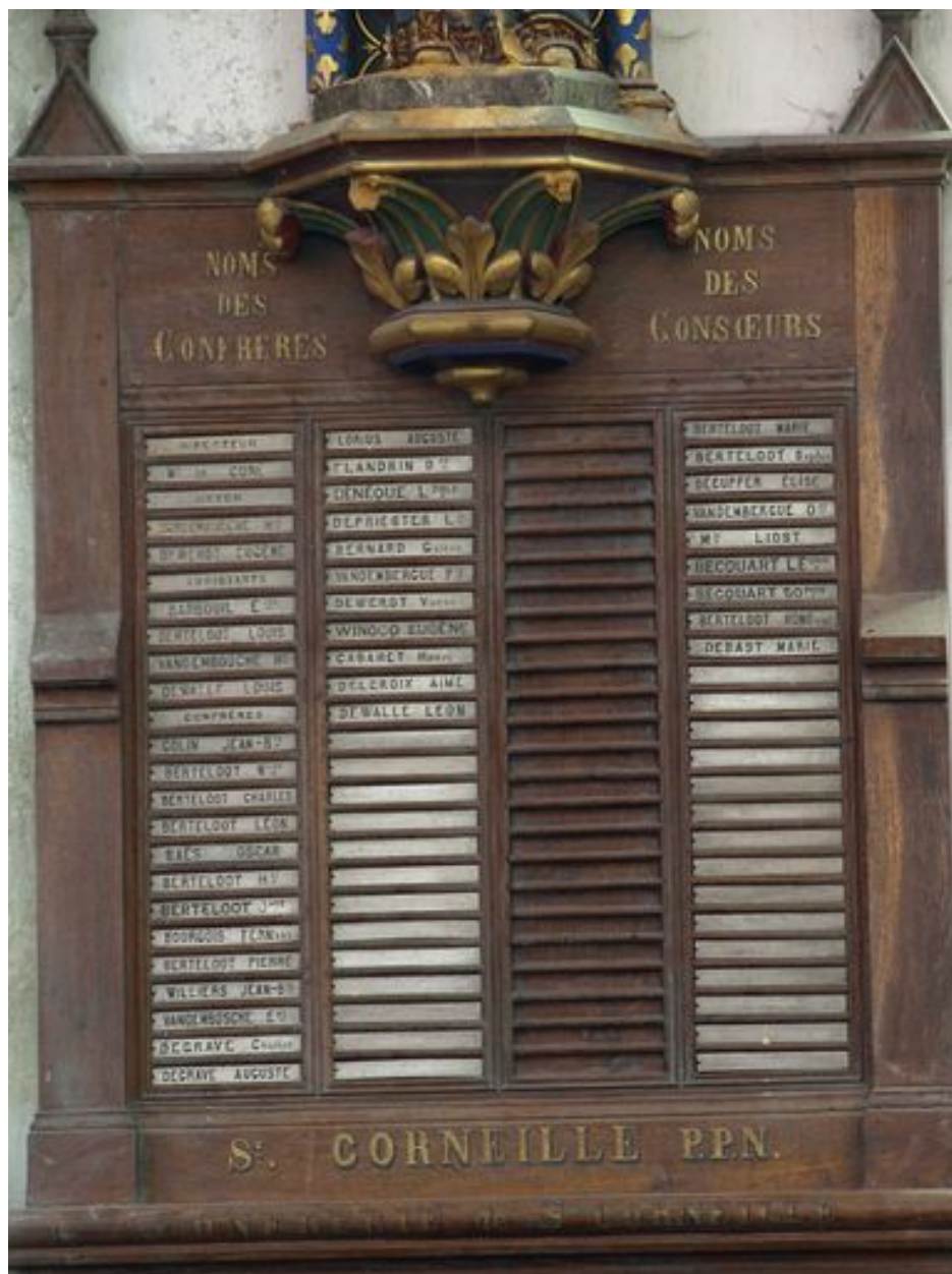
Sud : détail du tableau