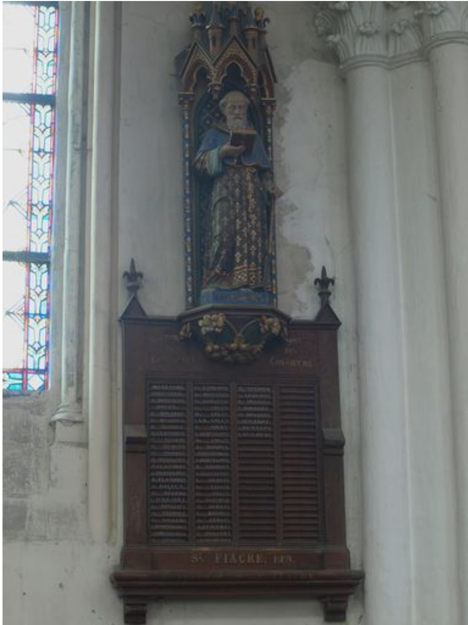
Nord : vue d'ensemble