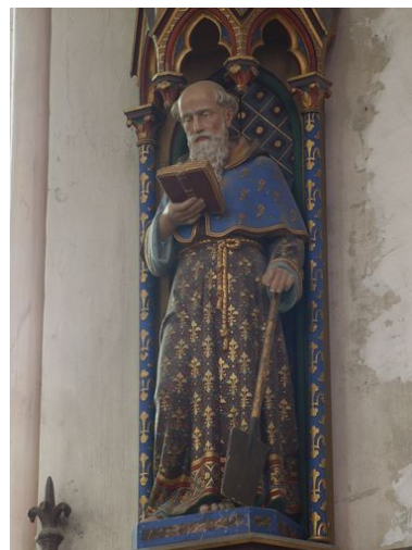
Nord : saint Corneille vu de trois-quarts IVR31_20106202713NUCA