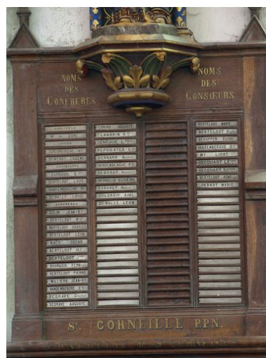
Sud : détail du tableau