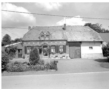
Vue générale. IVR22_19980202881X