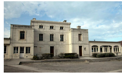
Vue d'ensemble avec une extension latérale. IVR22_20048001577NUCA