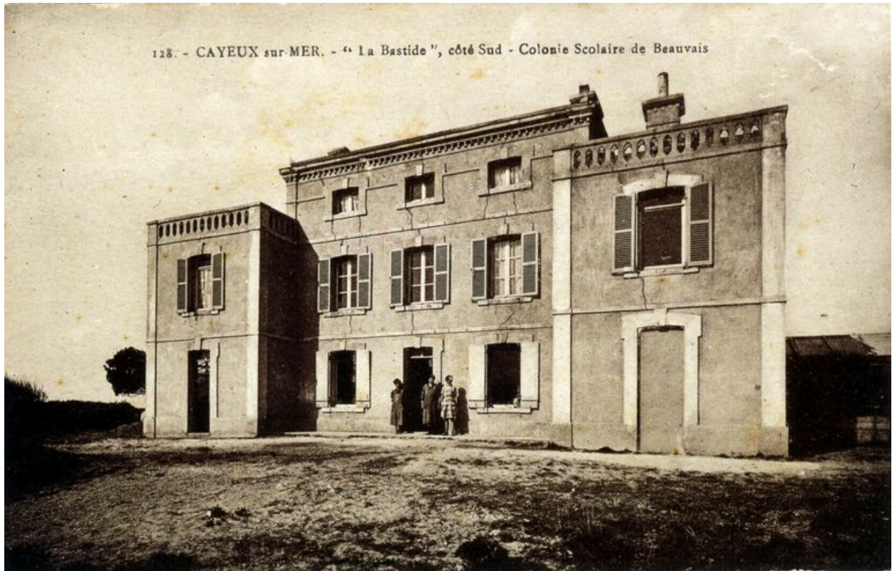
Façade d'entrée, carte postale, 1er quart 20e siècle (coll. part.).