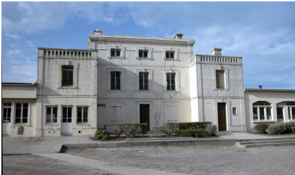
Vue d'ensemble depuis la rue.