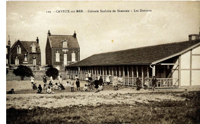
Les dortoirs de la colonie de vacances, carte postale, 1er quart 20e siècle (coll. part.).

Phot. Monnehay-Vulliet Marie-Laure IVR22_20058000479XAB