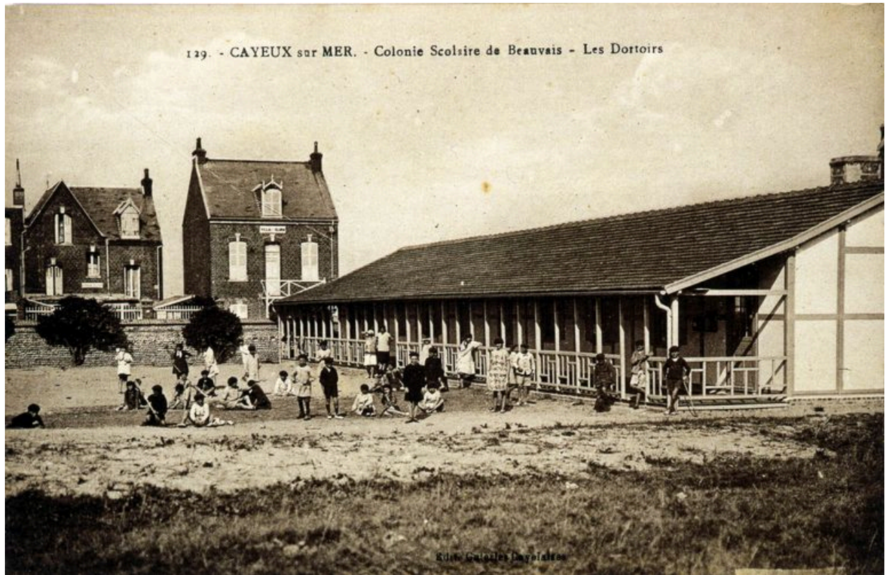
Les dortoirs de la colonie de vacances, carte postale, 1er quart 20e siècle.