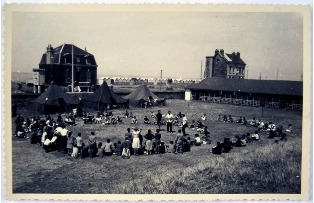
Scène de jeux, colonie de vacances, photographie, 1953 (coll. part.).