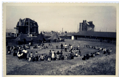
Scène de jeux, colonie de vacances, photographie, 1953 (coll. part.).

Phot. Monnehay-Vulliet Marie-Laure IVR22_20058000481XAB