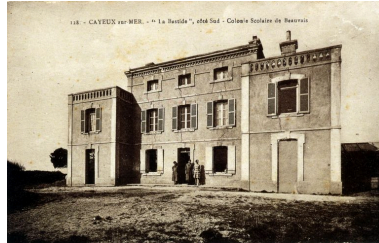
Façade d'entrée, carte postale, 1er quart 20e siècle (coll. part.).

Phot. Monnehay-Vulliet Marie-Laure IVR22_20058000480XAB