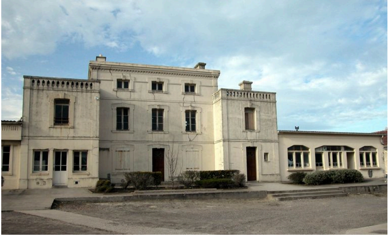
Vue d'ensemble avec une extension latérale.