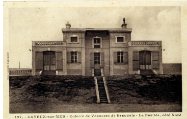
Vue d'ensemble, carte postale, 1er quart 20e siècle (coll. part.).

Phot. Monnehay-Vulliet Marie-Laure IVR22_20058000480XAB