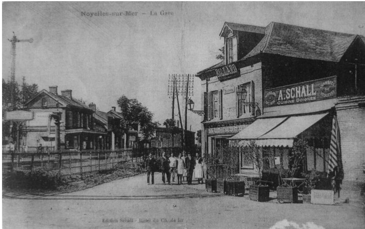
Vue ancienne de l'établissement.