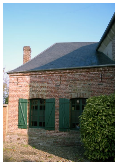
Vue de l'annexe flanquant le mur pignon nord. IVR22_20058005181NUCA