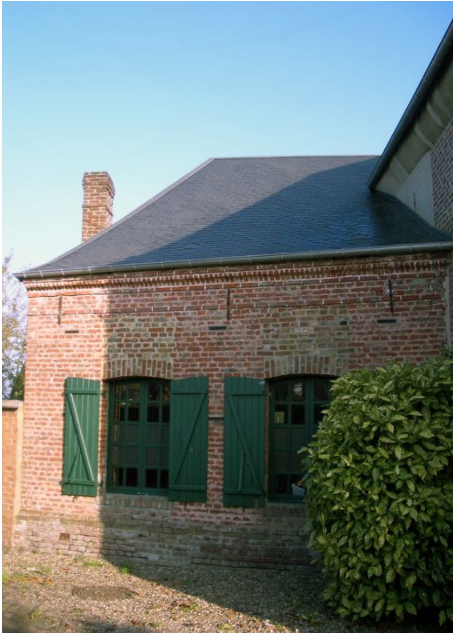
Vue de l'annexe flanquant le mur pignon nord.