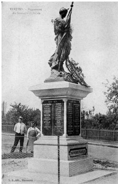
Le monument du Souvenir Français, carte postale début 20e siècle.