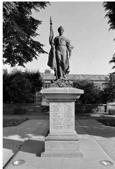
Vue générale de face. IVR22_19990202129Z