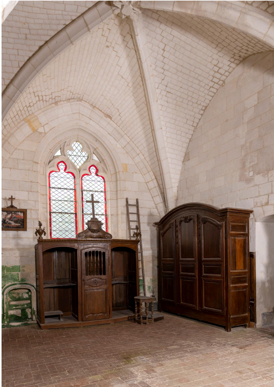
Vue générale de la première travée de la chapelle sud.