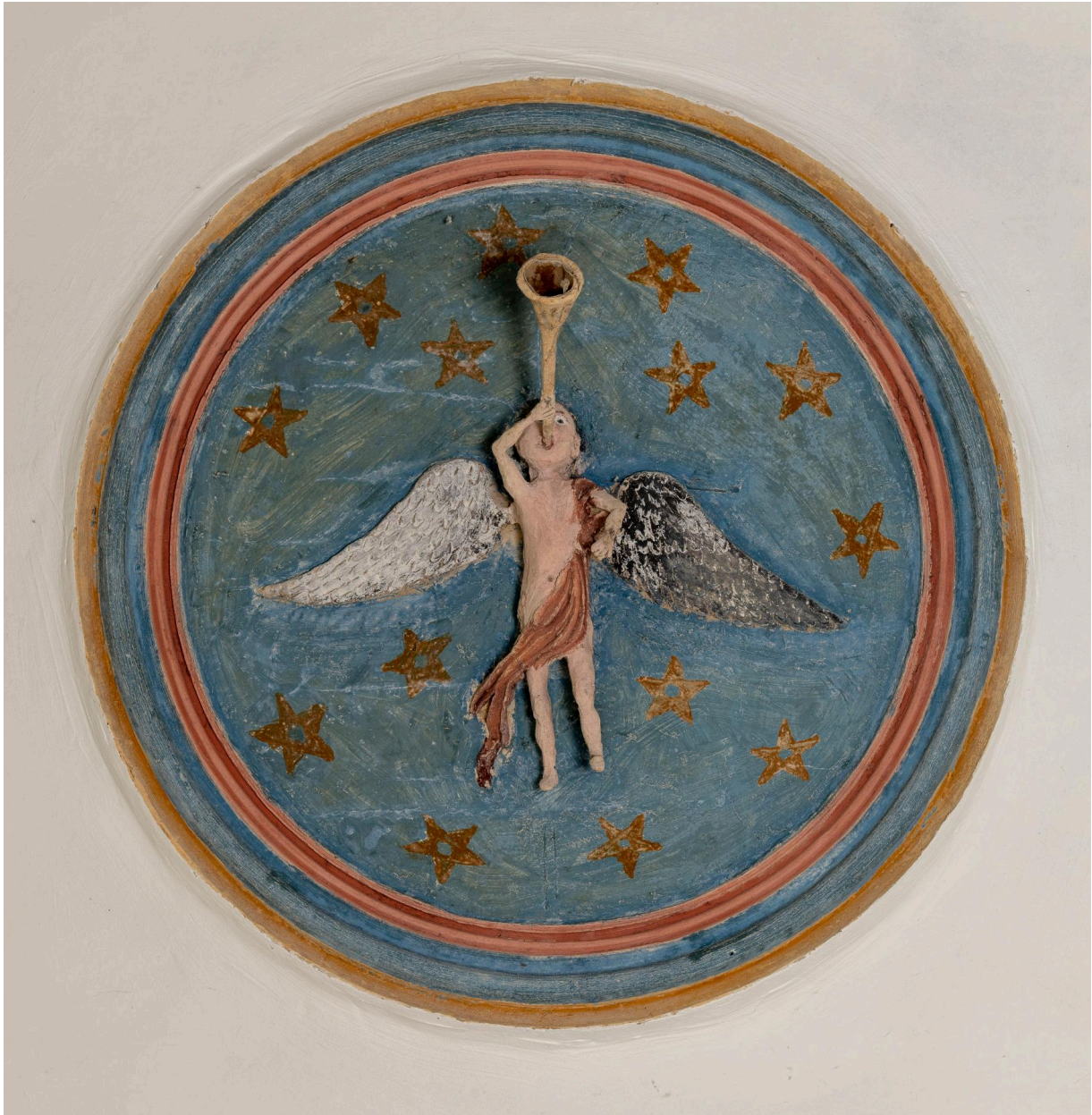
Médaille du plafond de la nef : ange sonnant de la trompette.