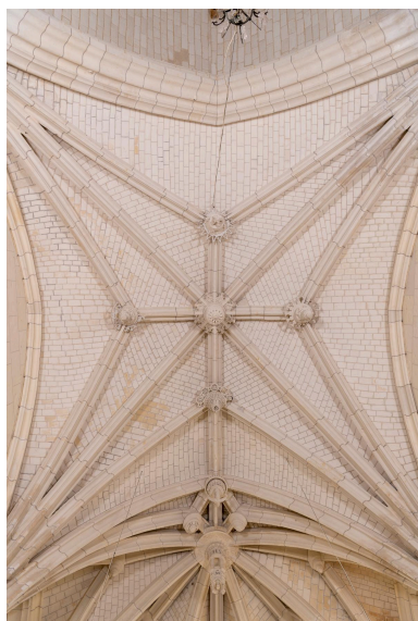
Voûte à la croisée des chapelles et du chœur. IVR32_20236000759NUCA