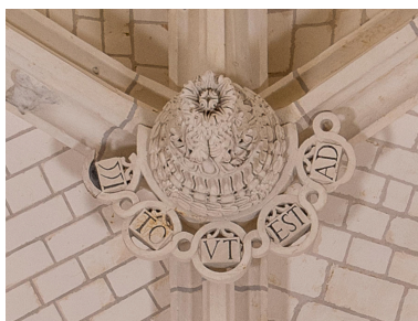
Clé pendante de la seconde travée du chœur : "(1)551 TO VT EST AD". IVR32_20236000790NUCA