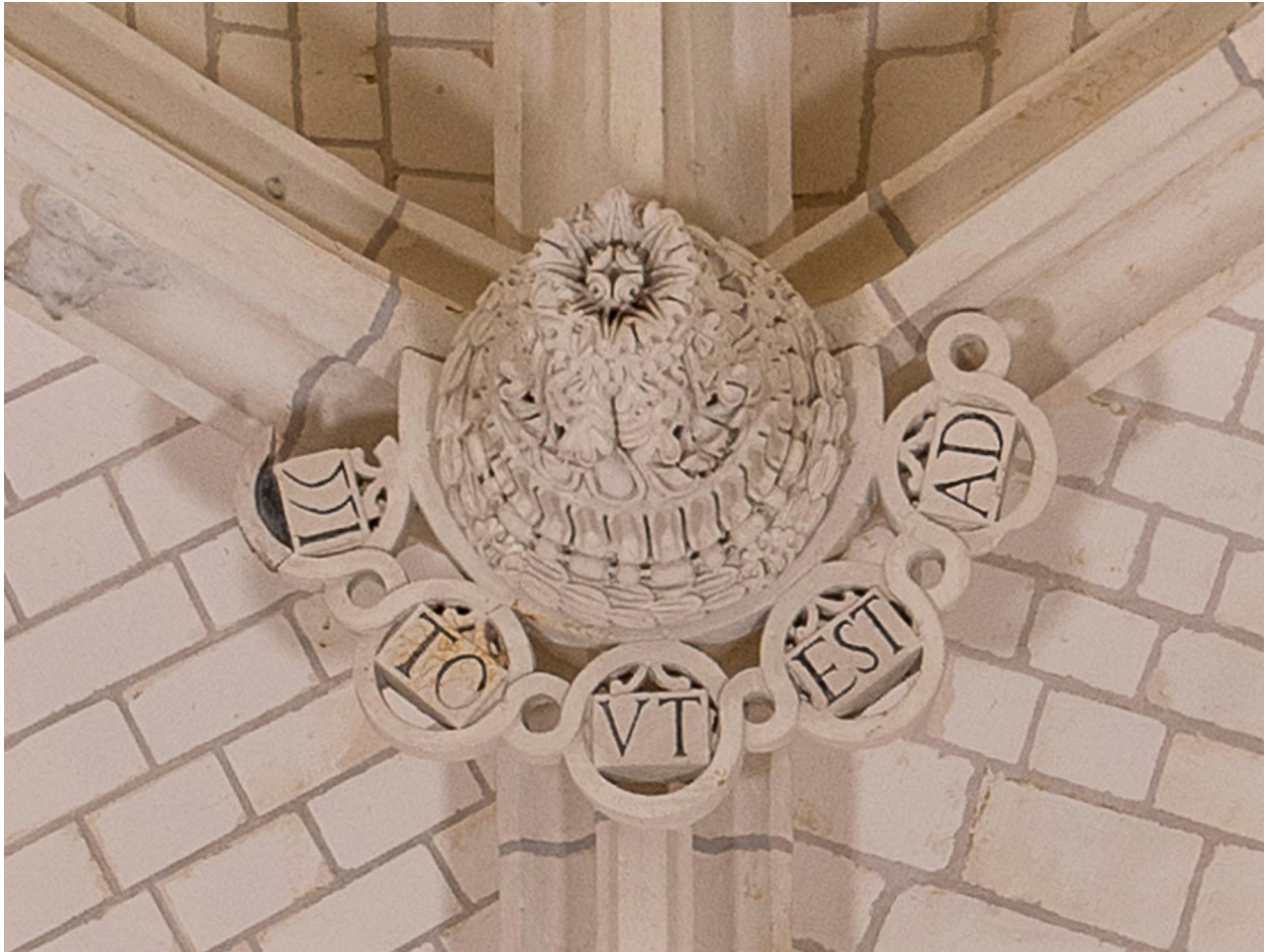
Clé pendante de la seconde travée du chœur : "(1)551 TO VT EST AD".