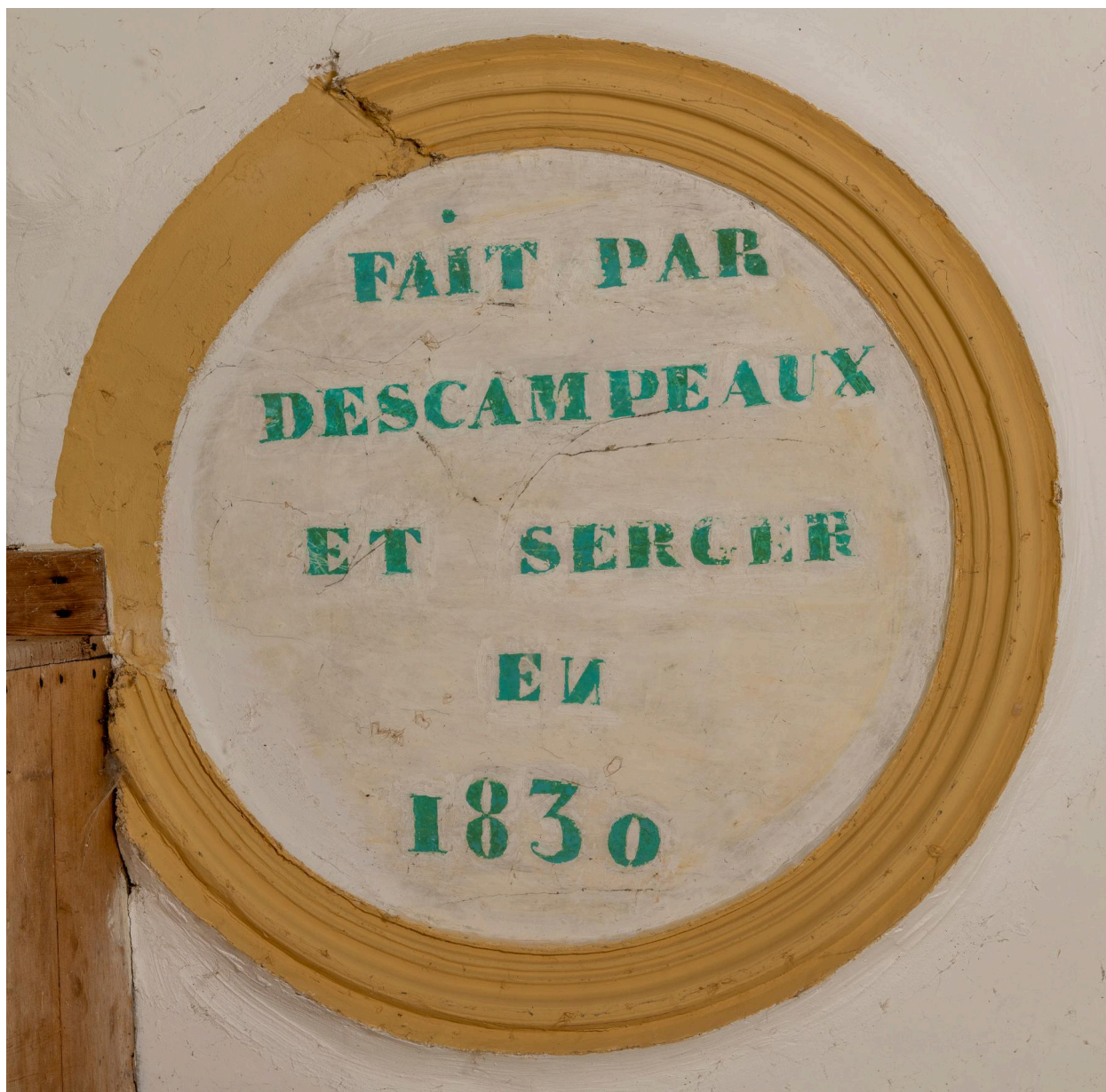
Médaille du plafond de la nef : "FAIT PAR DESCAMPEAUX ET SERGER EN 1830".