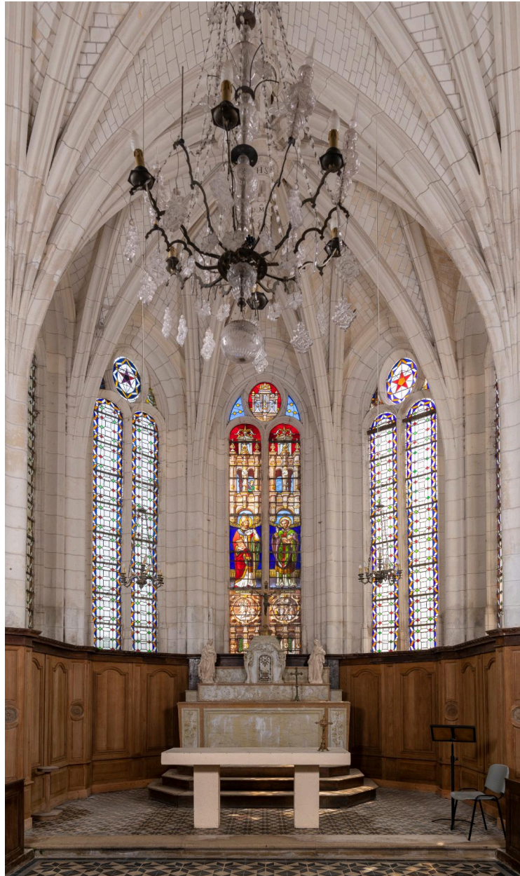
Vue du sanctuaire.