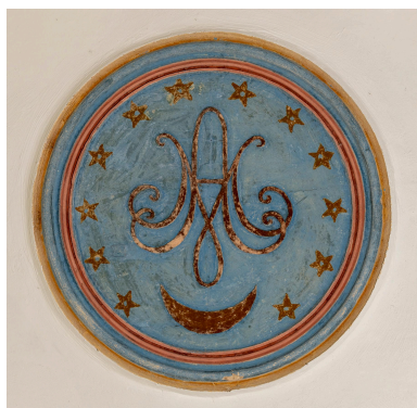
Médaille du plafond de la nef : initiales "AM".