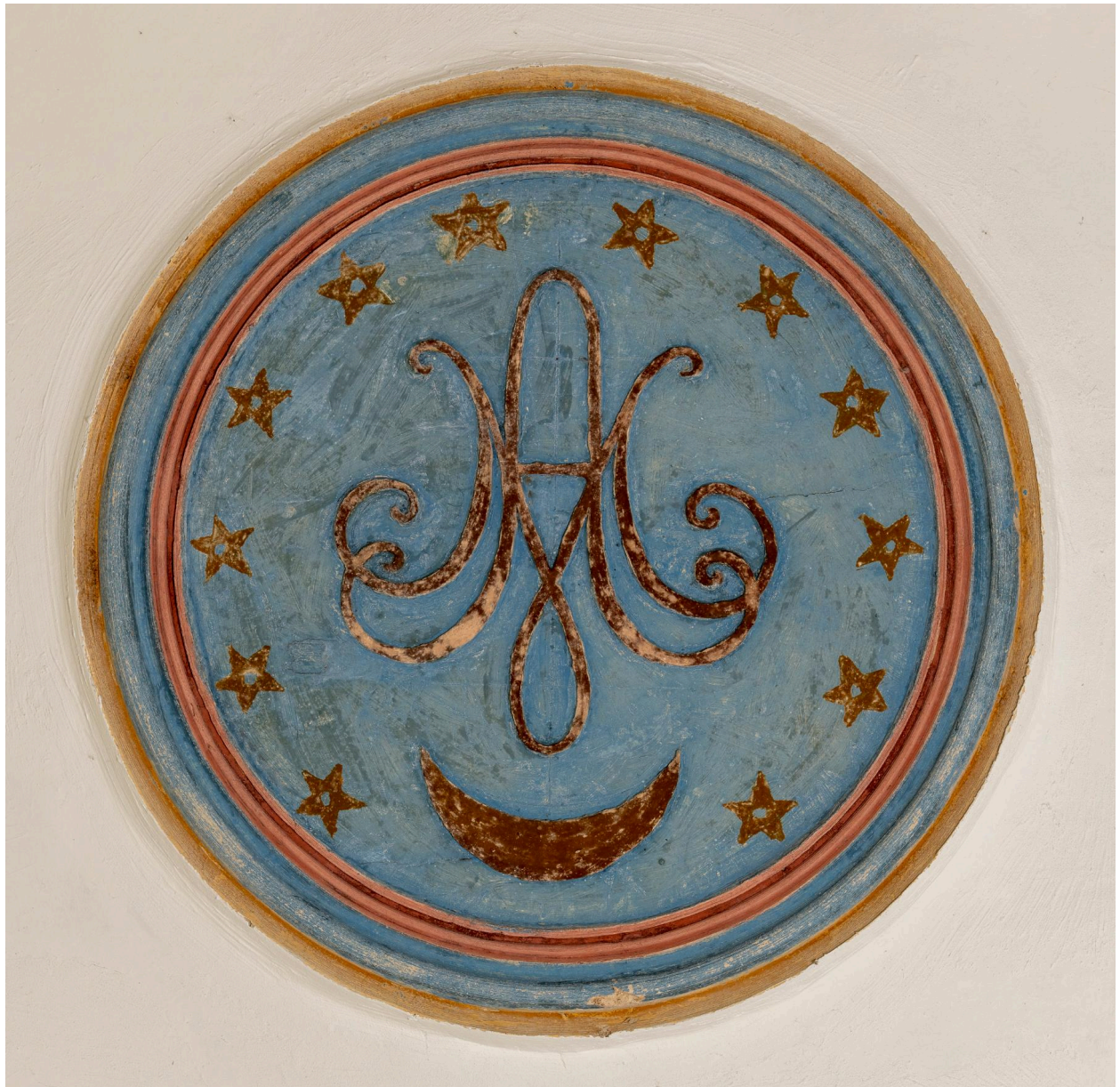
Médaille du plafond de la nef : initiales "AM".