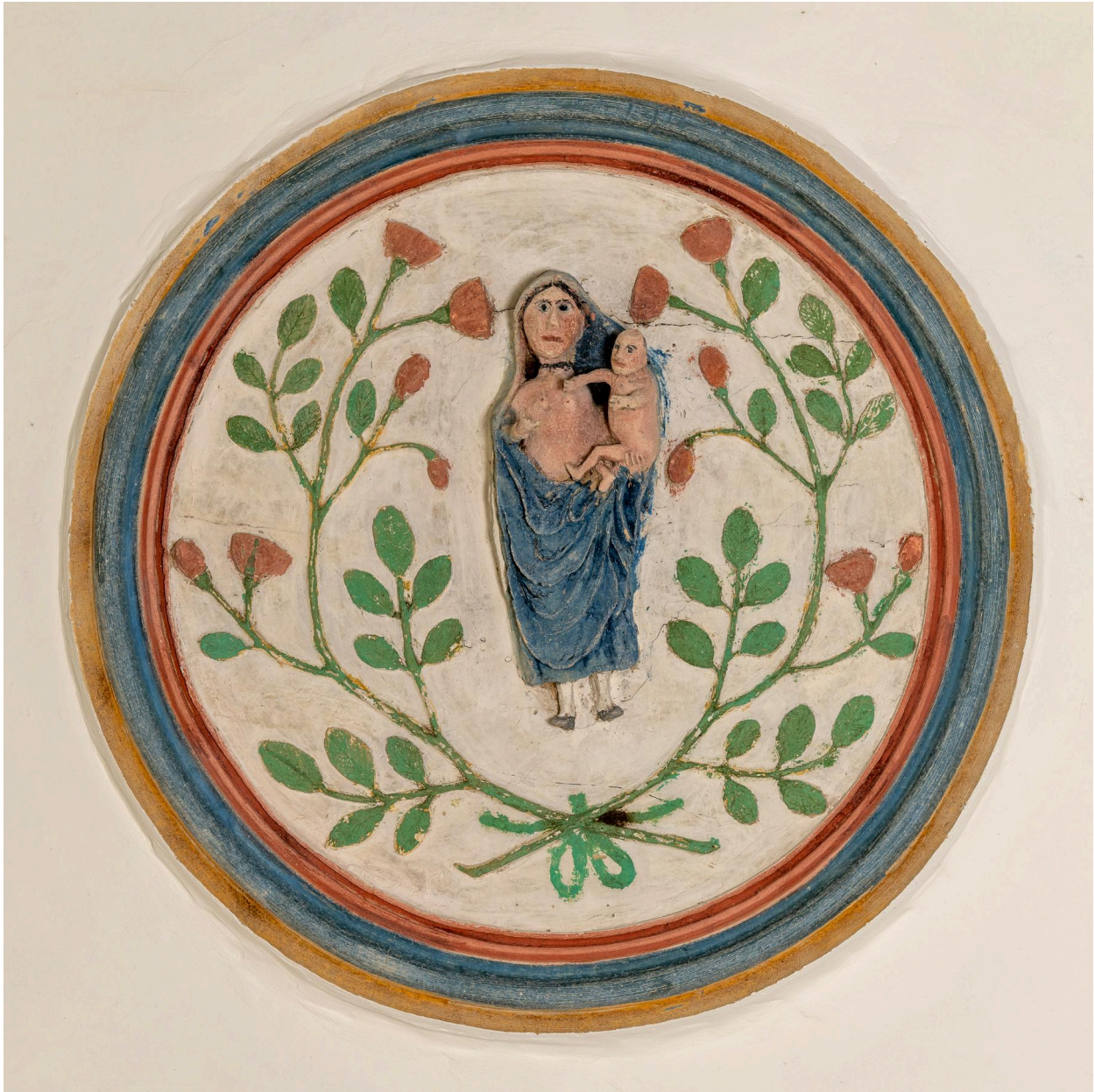
Médaillon du plafond de la nef : Vierge à l'Enfant.