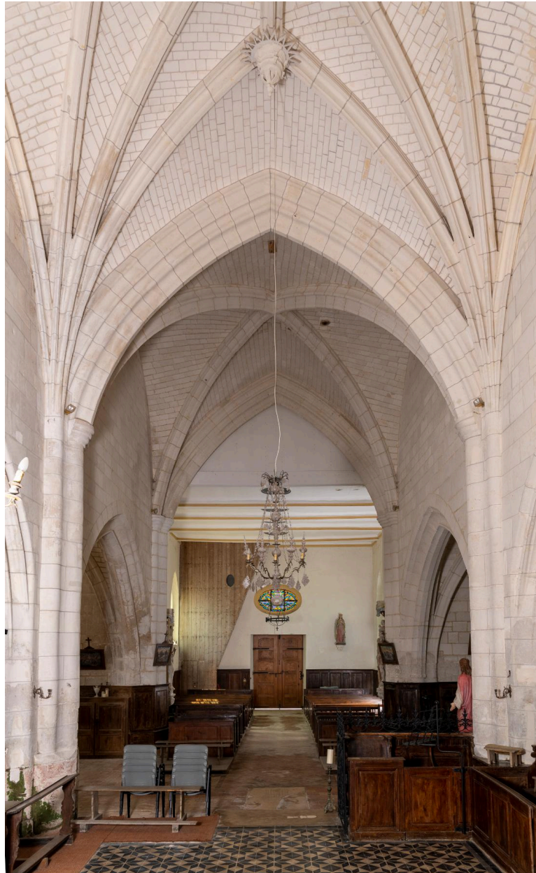
Vue générale vers la nef.