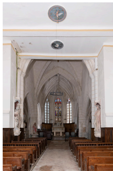
Vue générale vers le chœur. IVR32_20236000783NUCA