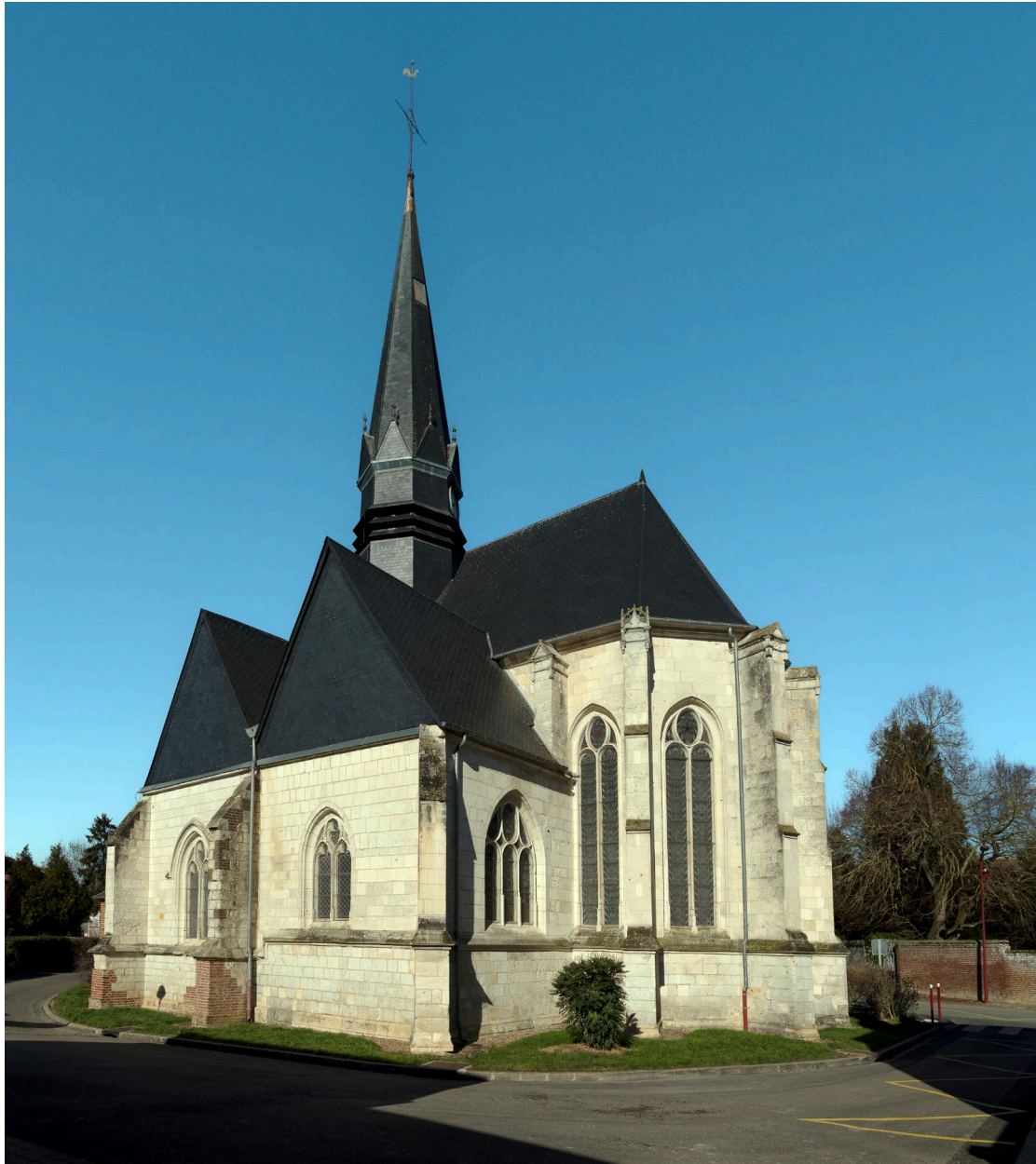
Vue prise depuis le sud-est.