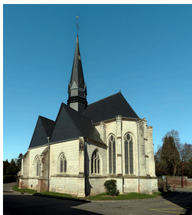
Vue prise depuis le sud-est.