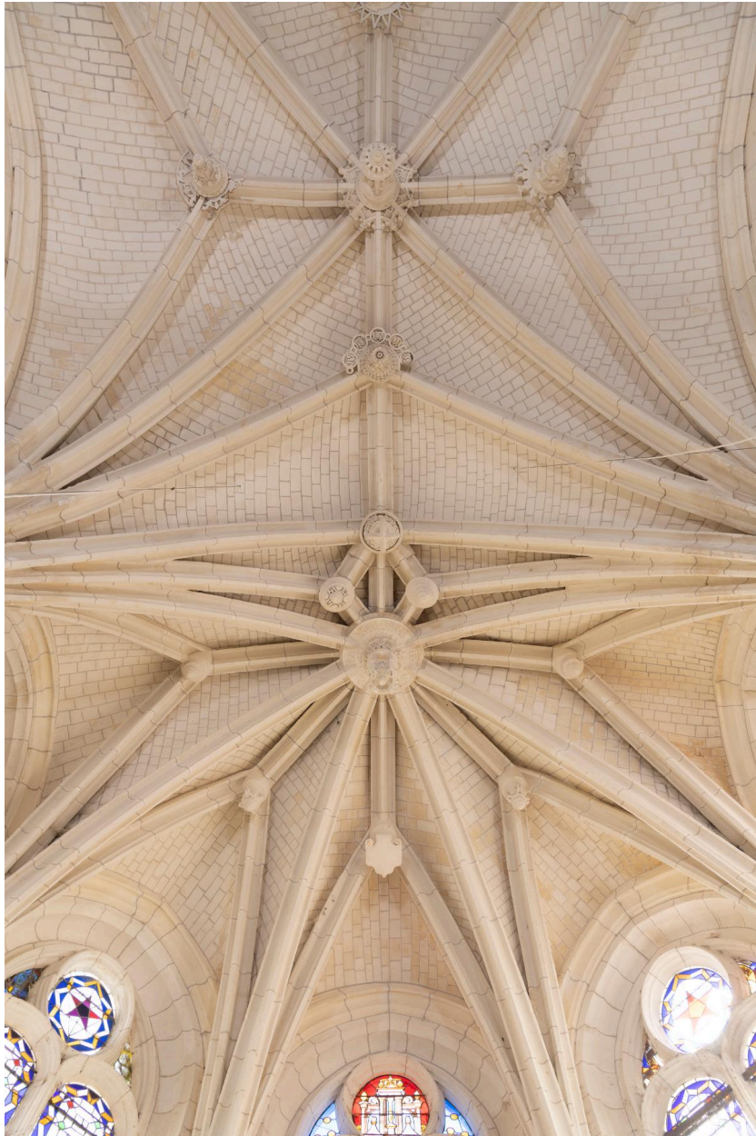
Voûtes du chœur à liernes et tiercerons.