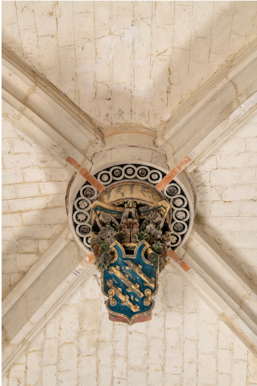
Clé pendante de la chapelle seigneuriale côté nord.