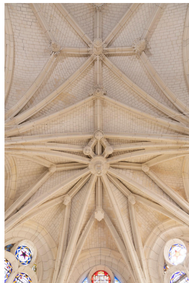
Voûtes du chœur à liernes et tiercerons.