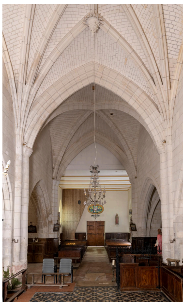
Vue générale vers la nef. IVR32_20236000784NUCA