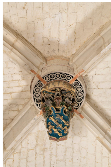
Clé pendante de la chapelle seigneuriale côté nord. IVR32_20236000768NUCA