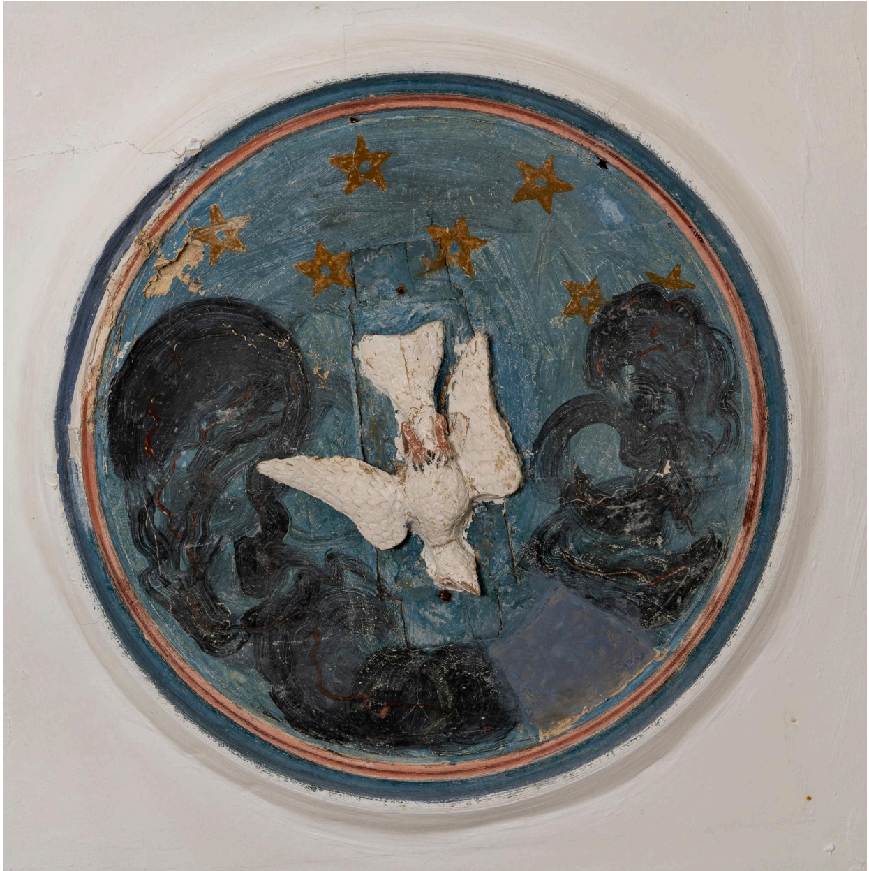
Médaille du plafond de la nef : colombe du Saint-Esprit.