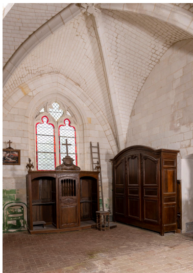
Vue générale de la première travée de la chapelle sud. IVR32_20236000771NUCA