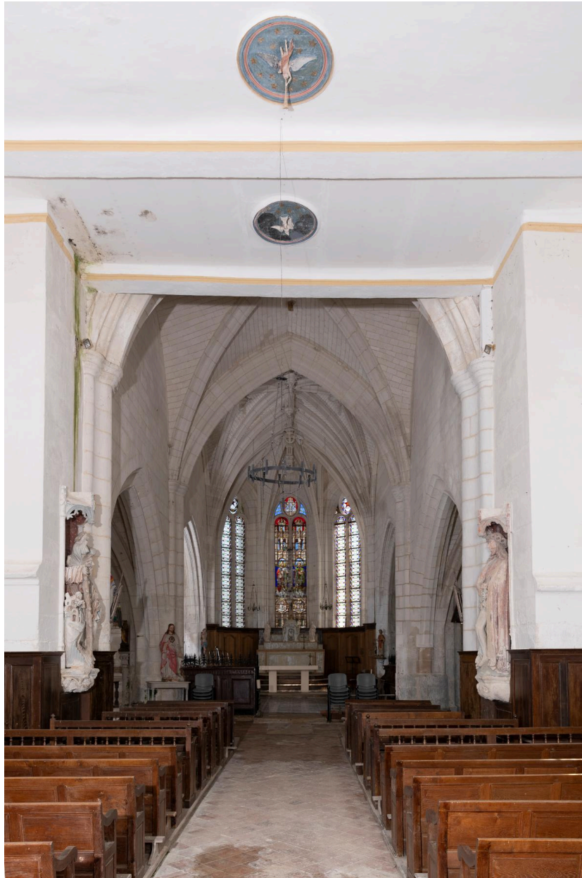
Vue générale vers le chœur.