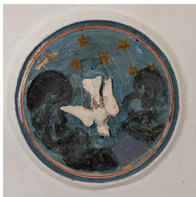
Médaille du plafond de la nef : colombe du Saint-Esprit.