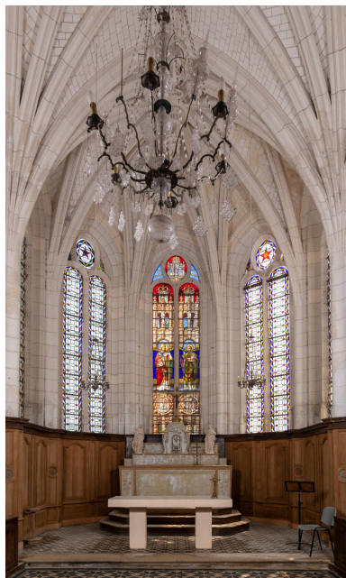
Vue du sanctuaire.