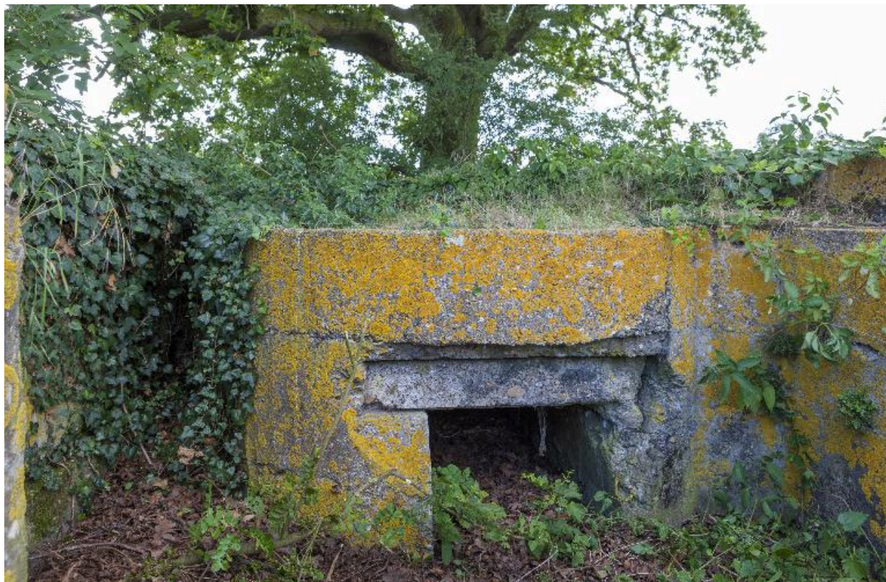
Resserre à mitrailleuse sous la plateforme sud-ouest