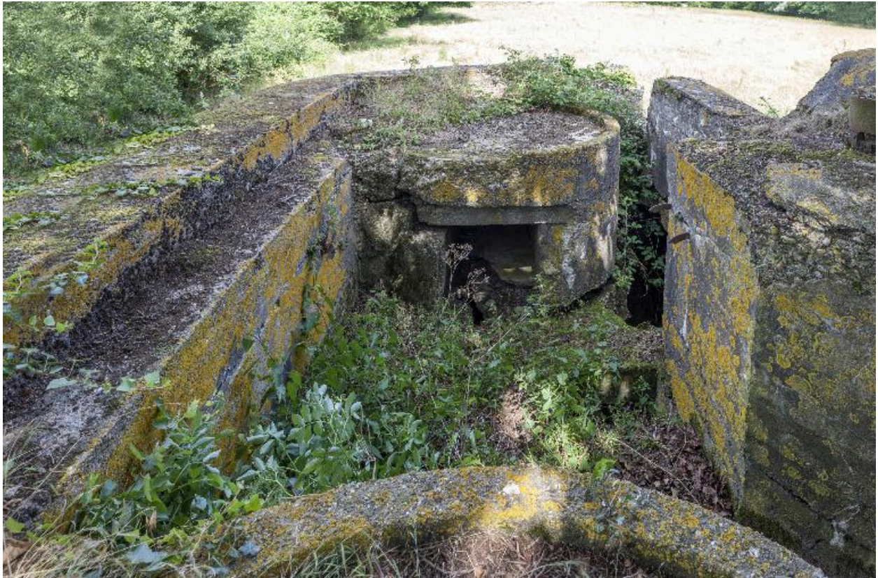
Plateforme à mitrailleuse, en face et conduit d'accès à l'intérieur de l'abris, à droite