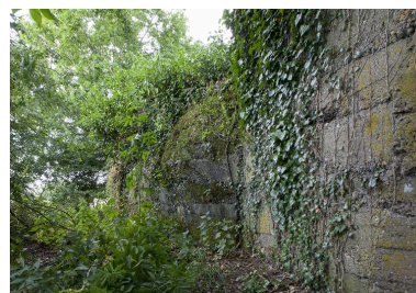
Elévation sud-ouest IVR31_20145904799NUCA