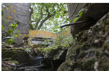
Conduit d'accès aux positions de mitrailleuse IVR31_20145904798NUCA