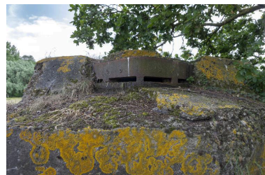
L'observatoire casematé