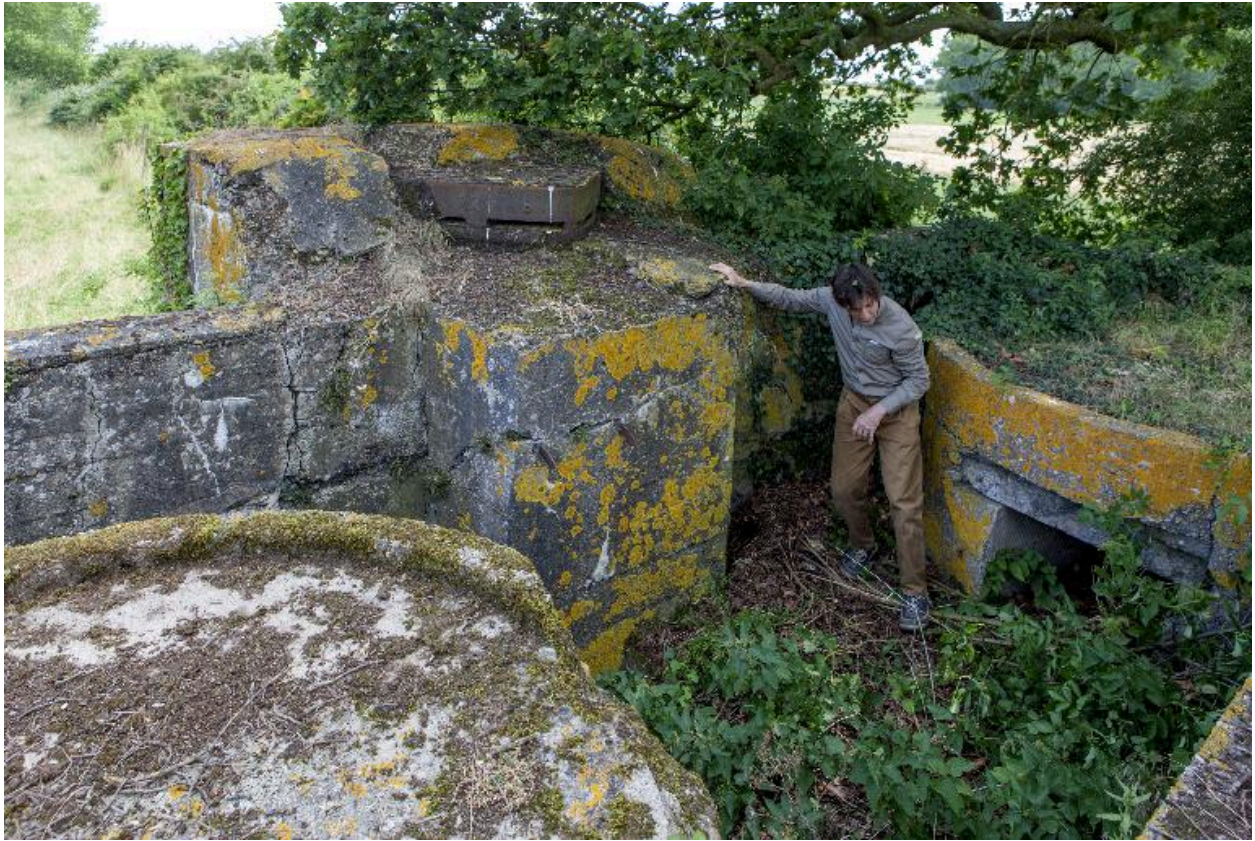
Vue d'ensemble vers le sud