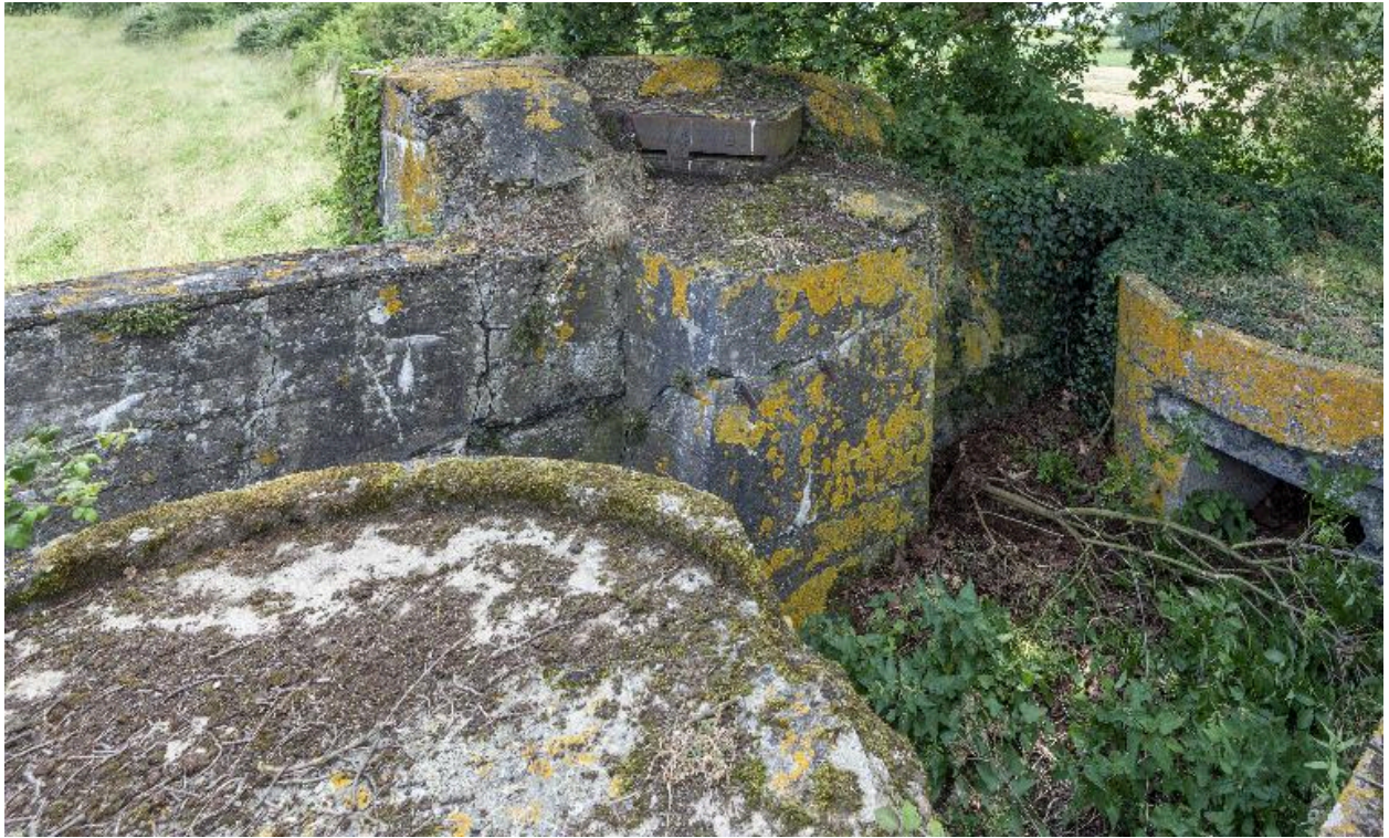
Vue d'ensemble vers le sud