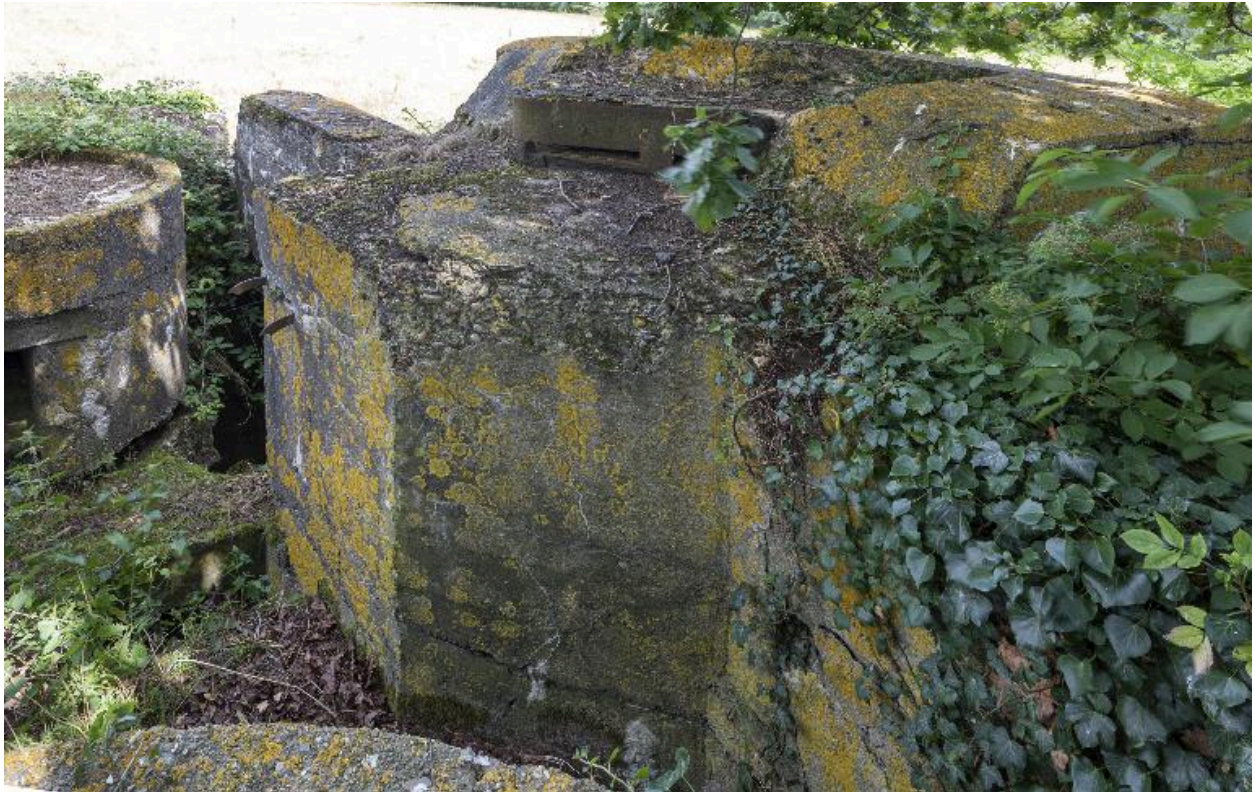
observatoire à droite