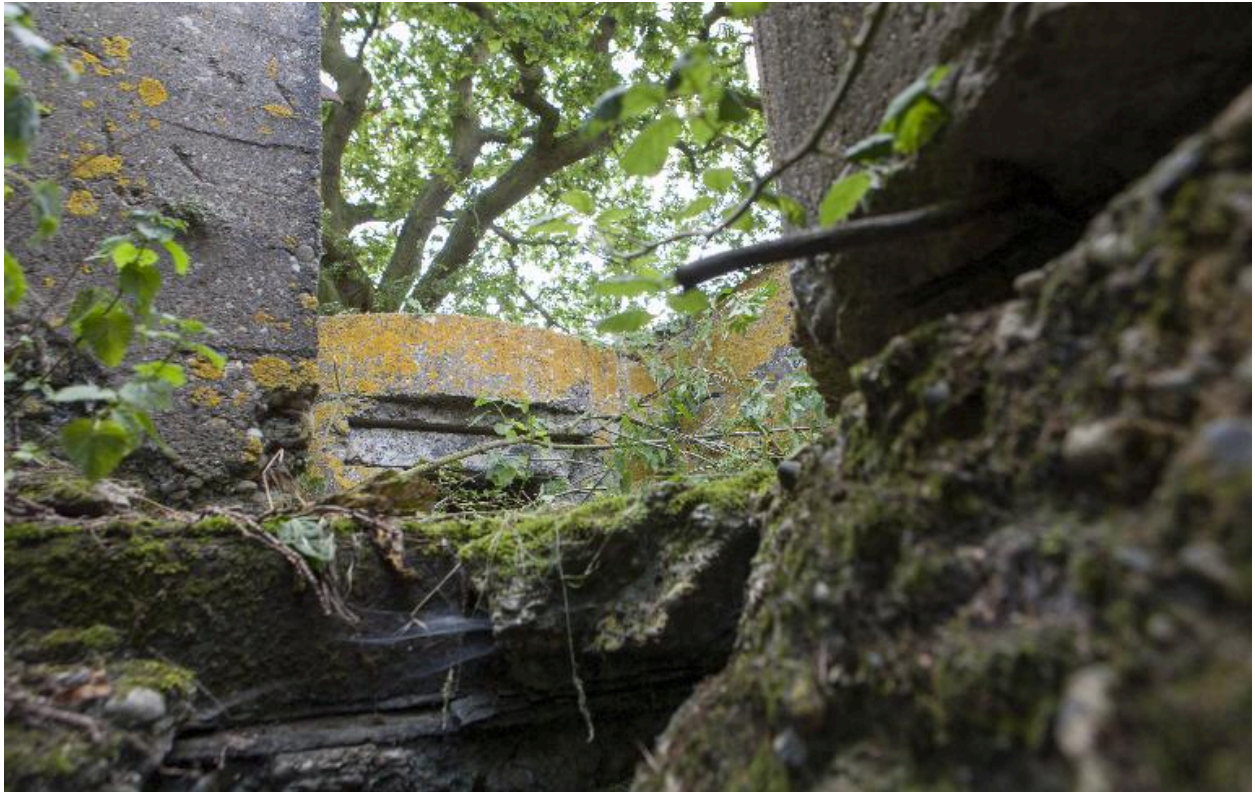
Conduit d'accès aux positions de mitrailleuse