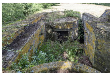
Plateforme à mitrailleuse, en face et conduit d'accès à l'intérieur de l'abris, à droite