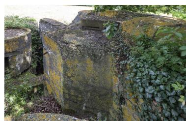
observatoire à droite IVR31_20145906021NUCA