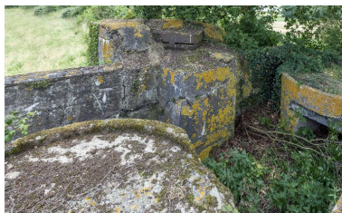
Vue d'ensemble vers le sud IVR31_20145904792NUCA