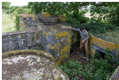
Vue d'ensemble vers le sud