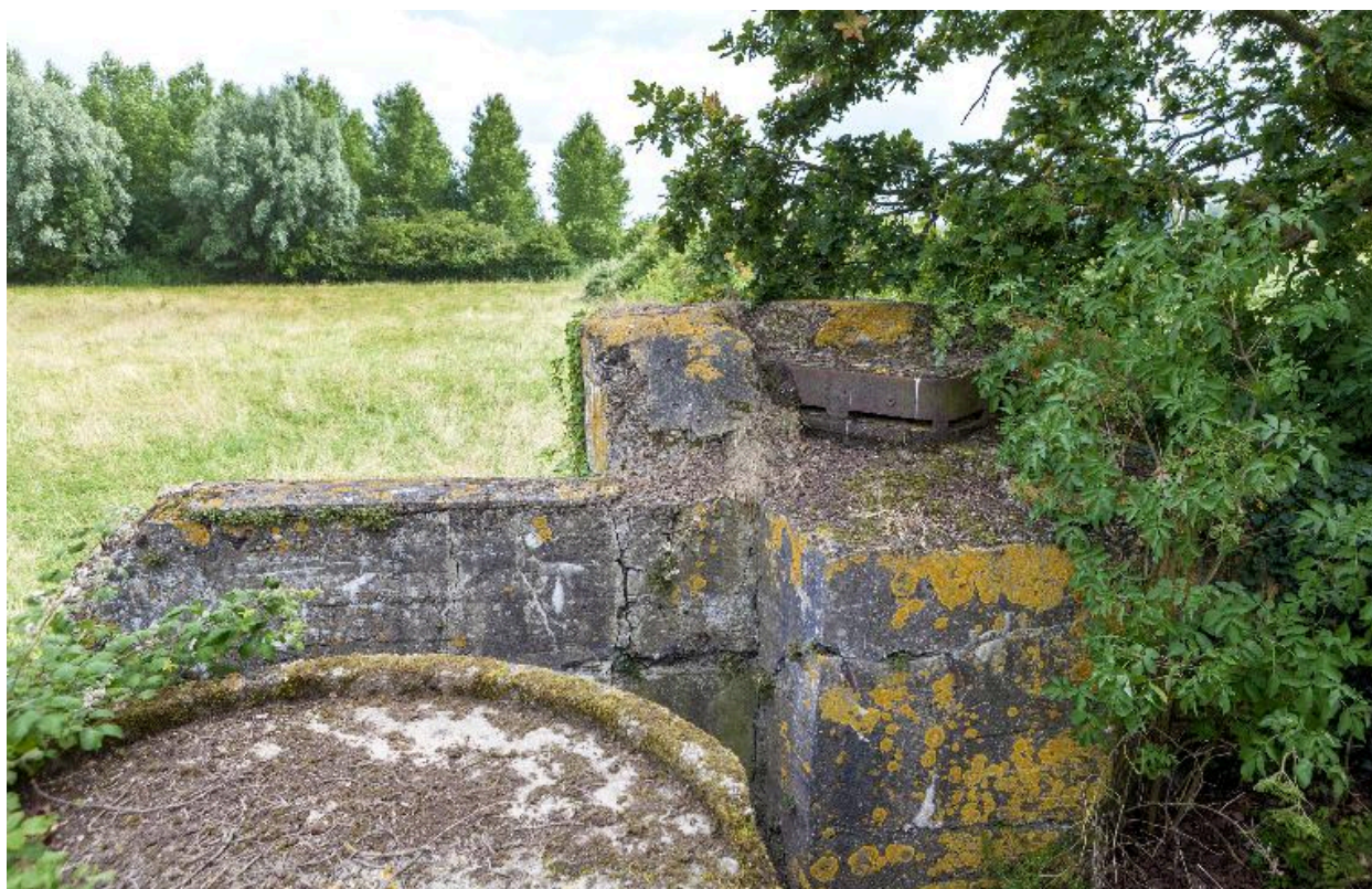
Depuis la plateforme nord-est vers le sud-est. L'observatoire casematé, à droite