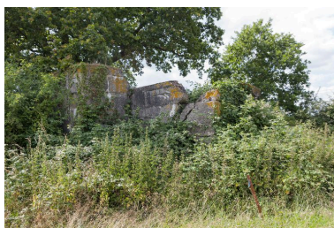
Vue générale vers l'ouest IVR31_20145904789NUCA

Sur cette photographie d'époque, une mitrailleuse MG-08 est montée sur affût spécial pour le tir anti-aérien. On peut envisager un tel dispositif sur chacune des plateformes de l'édifice. (Avec l'aimable autorisation de Vestiges Militaria ( http://humanbonb.free.fr/ ). IVR32_20175900959NUCA