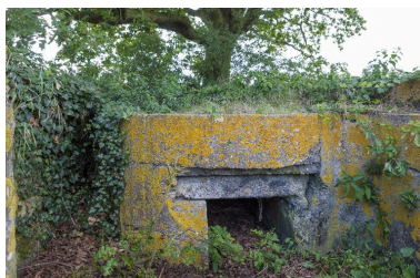
Resserre à mitrailleuse sous la plateforme sud-ouest