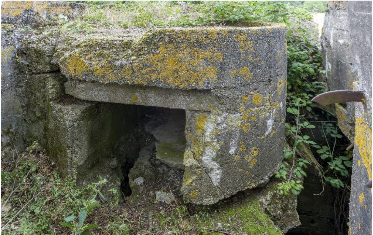
Resserre à mitrailleuse sous la plateforme nord-est