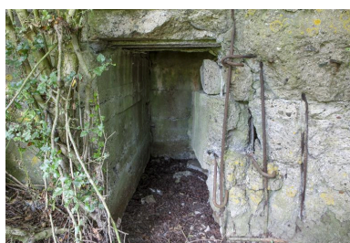
Entrée IVR31_20145904797NUCA