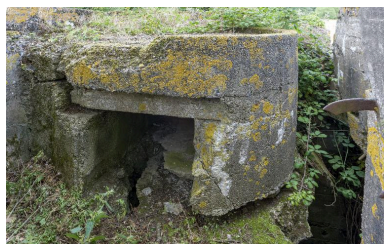
Resserre à mitrailleuse sous la plateforme nord-est IVR31_20145904795NUCA