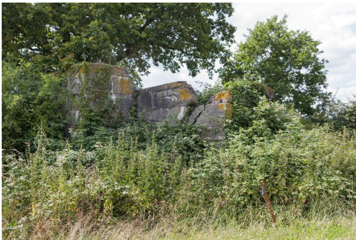
Vue générale vers l'ouest