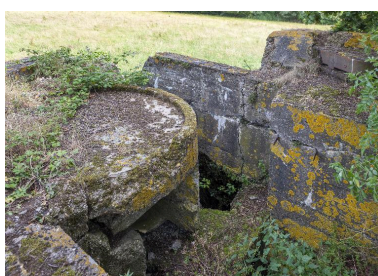
Plateforme nord-est et observatoire casematé IVR31_20145906020NUCA