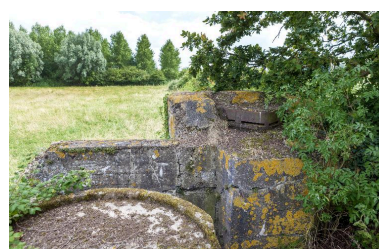
Depuis la plateforme nord-est vers le sud-est. L'observatoire casematé, à droite