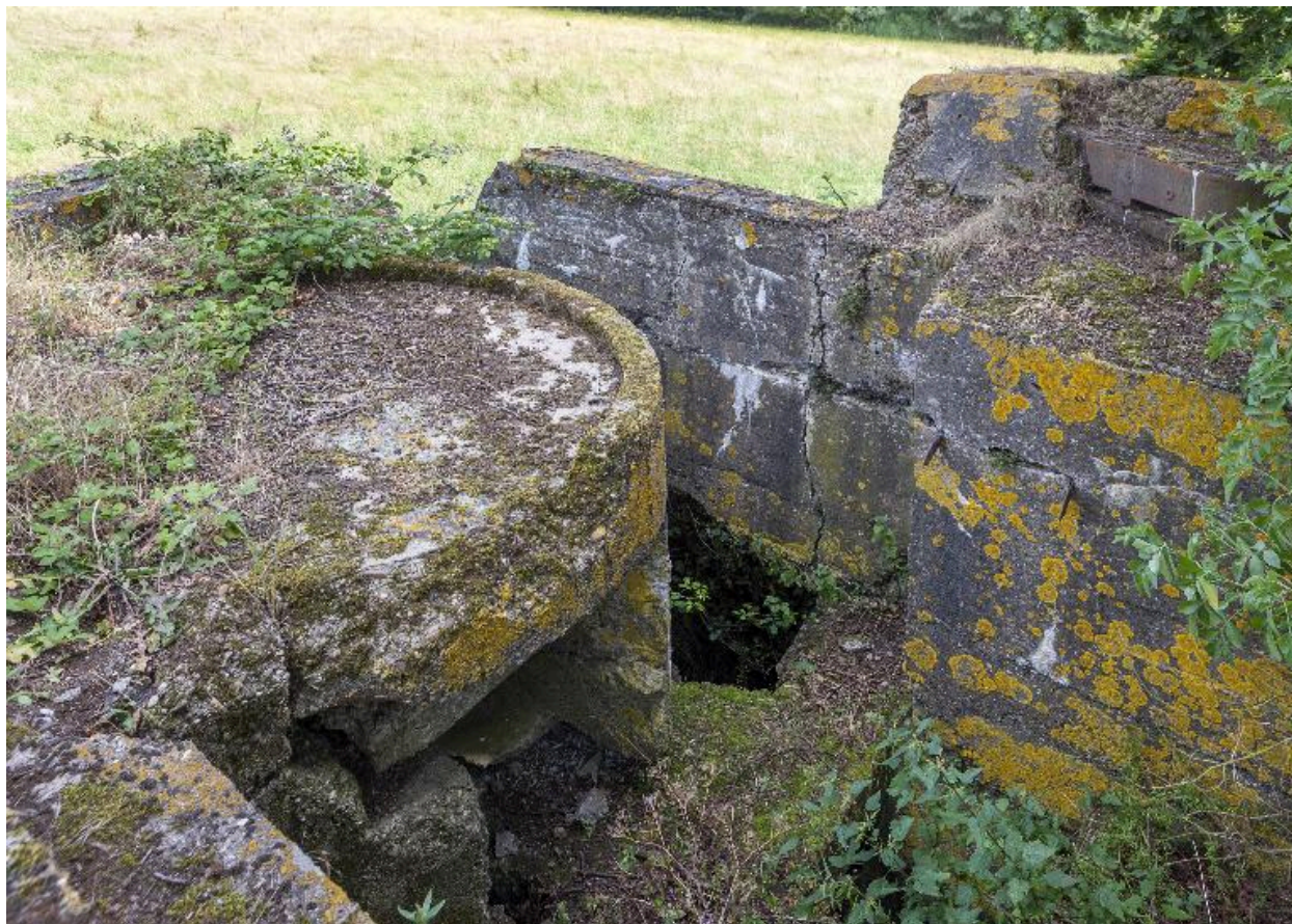
Plateforme nord-est et observatoire casematé