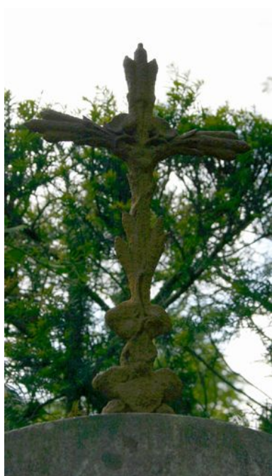
Détail de la stèle cintrée (1832) : croix en fer forgé surmontant le tombeau et présentant un décor de roseaux. IVR22_20078000956NUCA