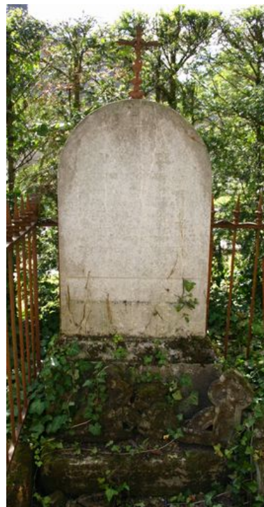
Stèle funéraire cintrée, vers 1832.