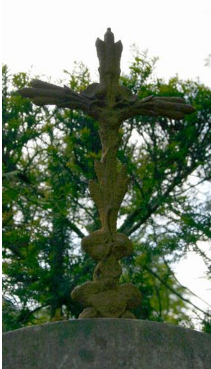
Détail de la stèle cintrée (1832) : croix en fer forgé surmontant le tombeau et présentant un décor de roseaux.