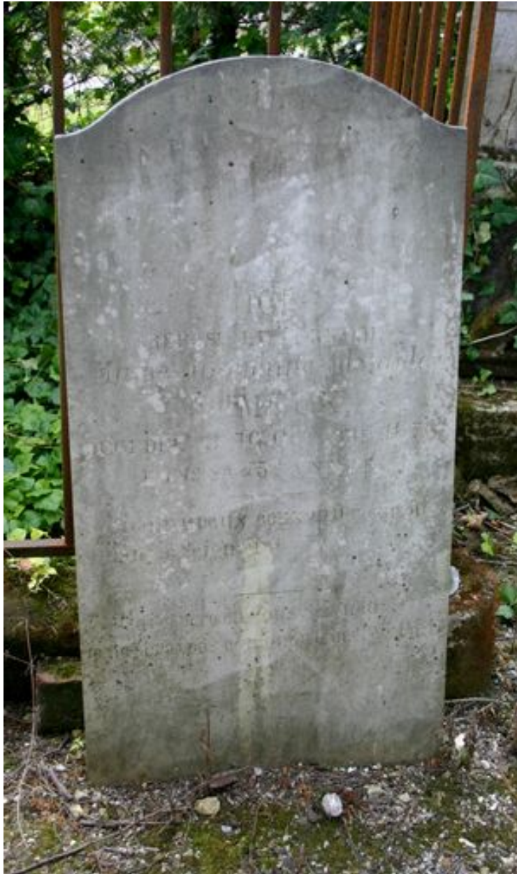
Stèle funéraire, vers 1876.