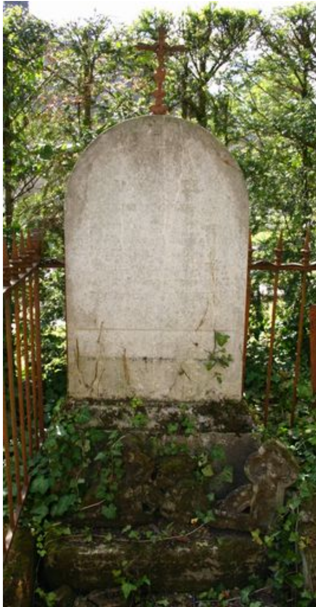
Stèle funéraire cintrée, vers 1832.