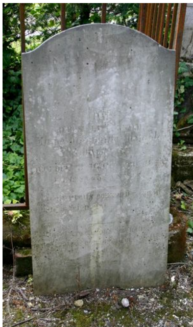
Stèle funéraire, vers 1876. IVR22_20078000954NUCA