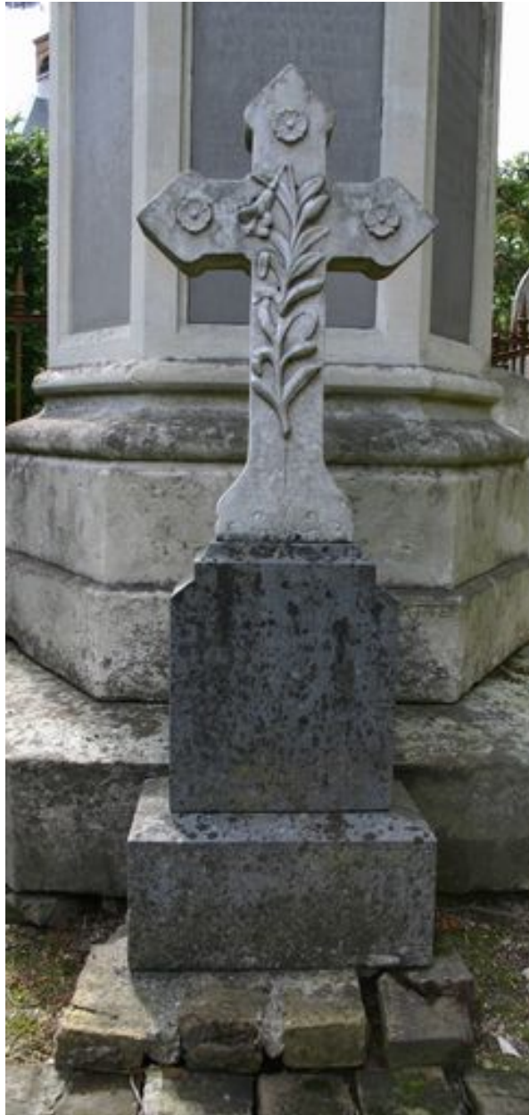
Croix funéraire, Lesot (entrepreneur), vers 1883.