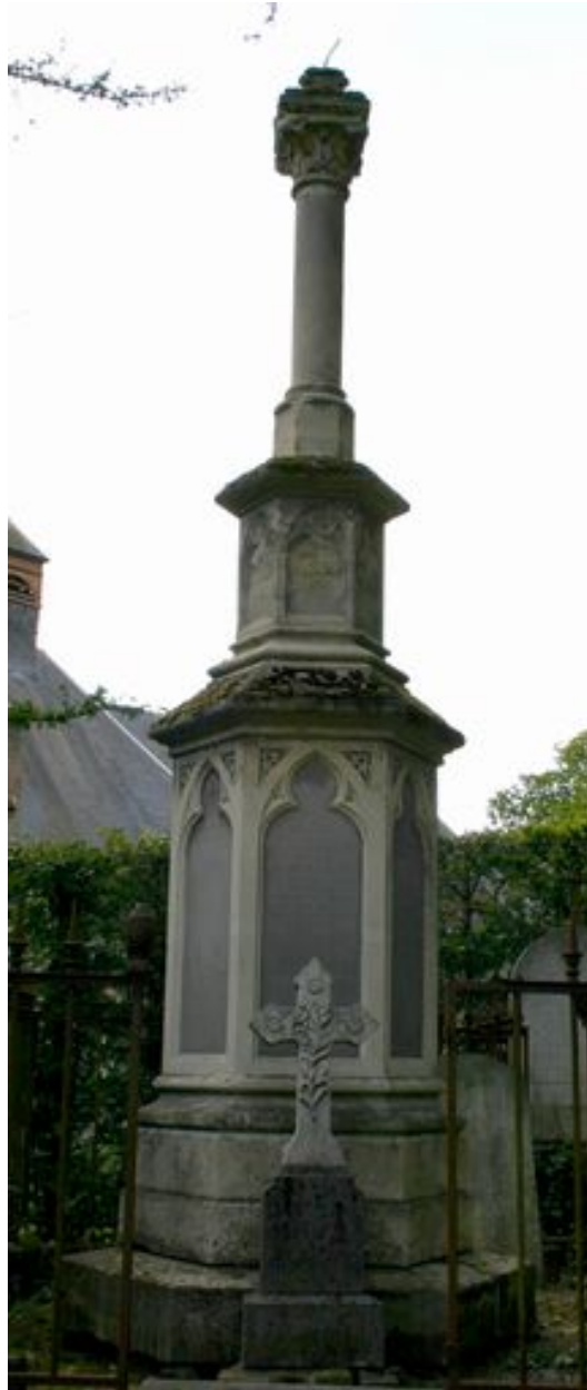
Croix funéraire monumentale de style néogothique, H. Patte (entrepreneur), vers 1871.