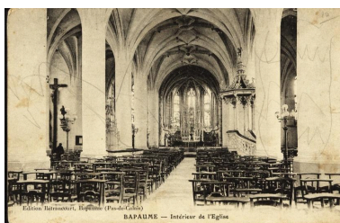
Bapaume - Intérieur de l'église. Edition Bétrancourt, Bapaume. Vue générale de la nef avec le banc d'œuvre à gauche. Carte postale, avant 1914. (coll. part.). IVR32_20196200962NUCA