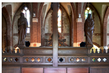
IVR32_20216200519NUCA