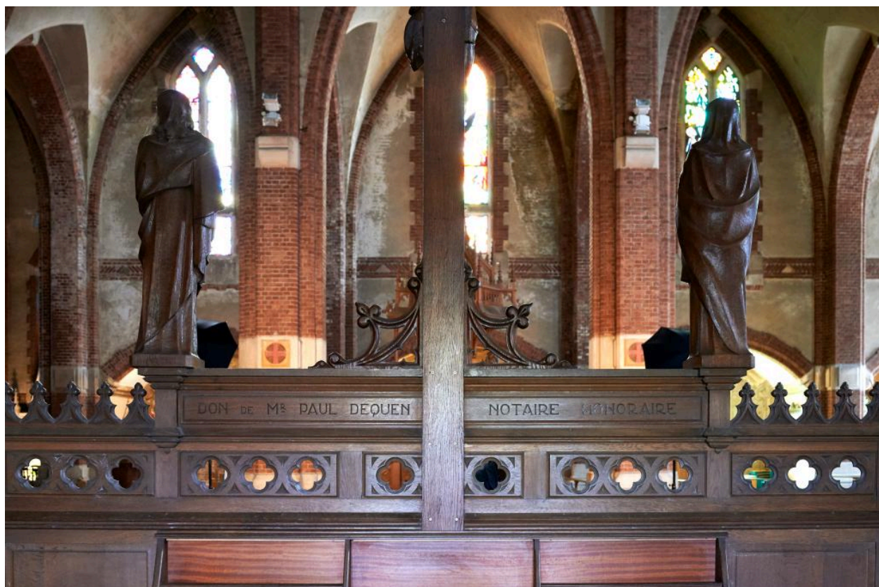
Vue de détail du revers avec l'inscription du donateur.