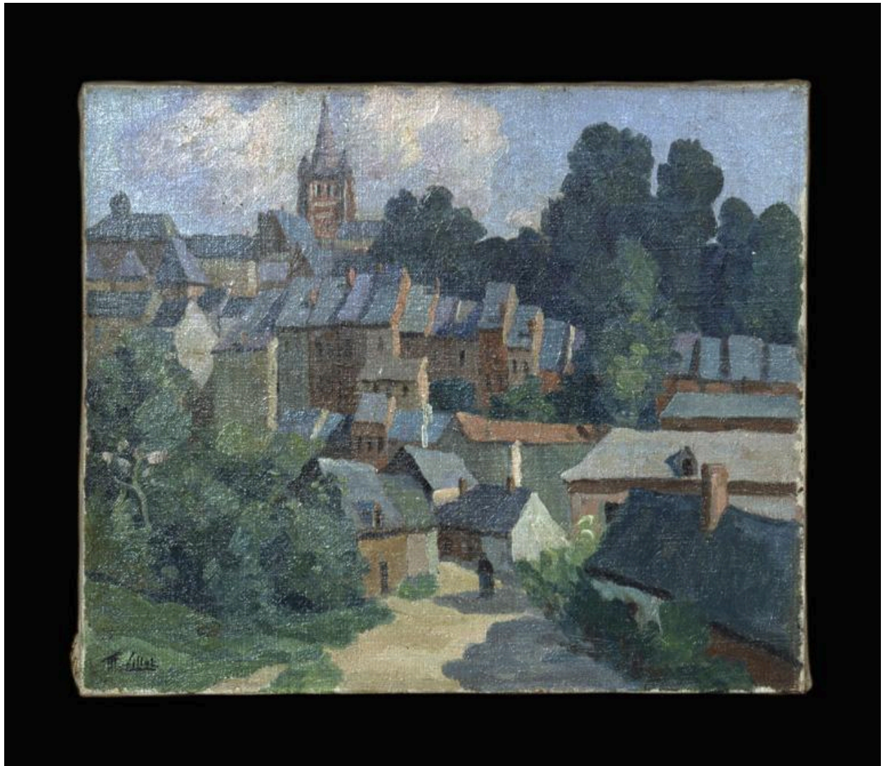
Vue du tableau.