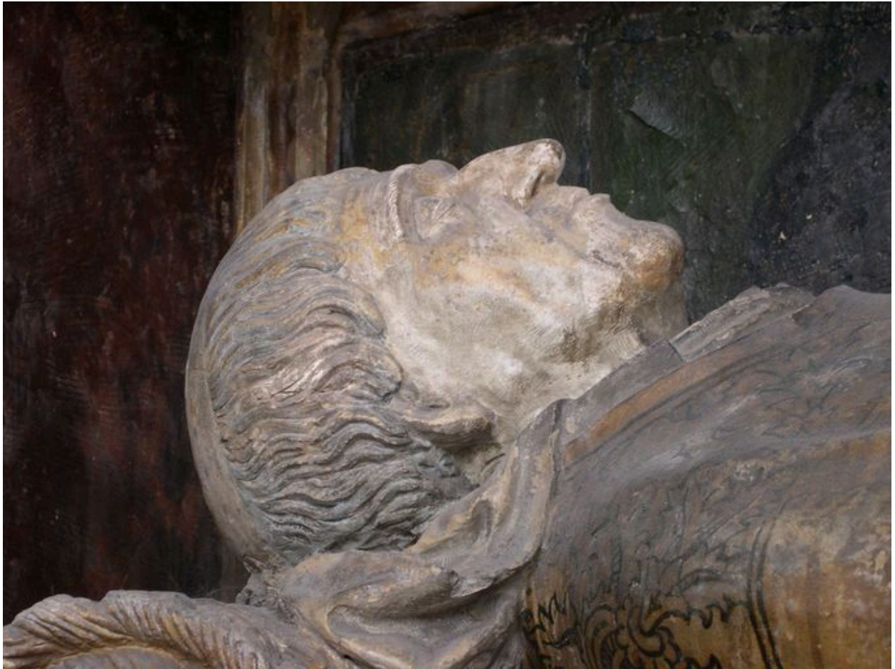
Vue de détail du visage d'Adrien de Hénencourt.