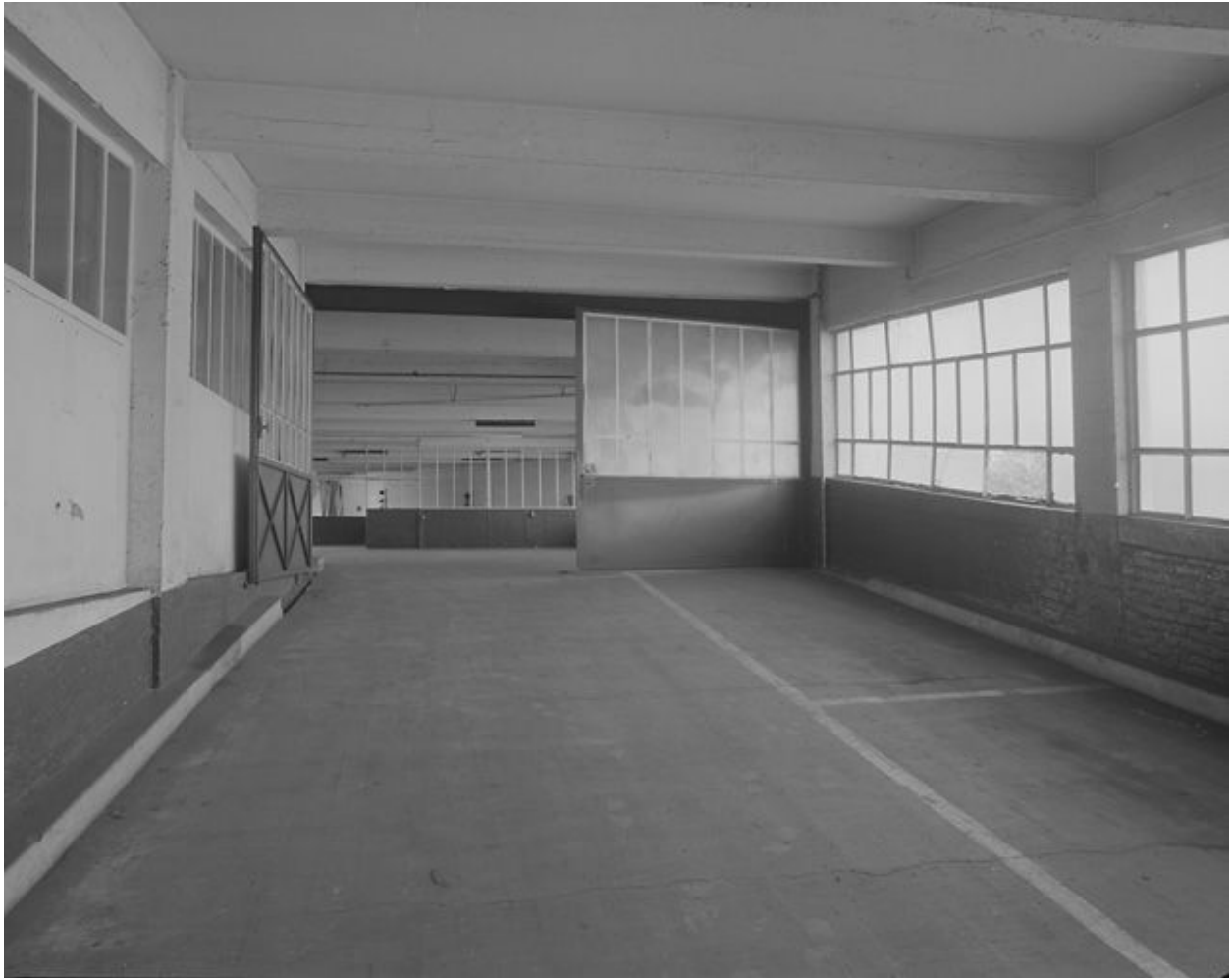
Vue d'ensemble de la rampe d'accès entre le niveau 2 et le niveau 3.