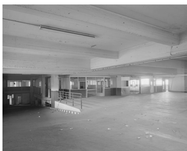
Vue d'ensemble de l'entresol et des bureaux de comptabilité.