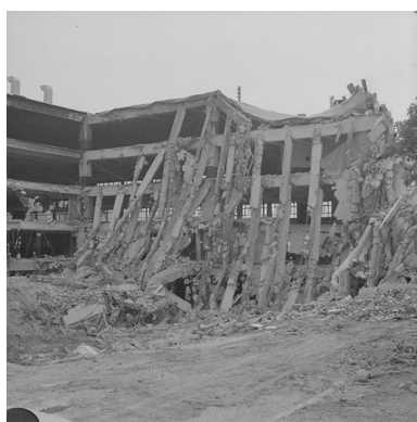
Vue d'ensemble du garage en cours de démolition, le 26 avril 1999.