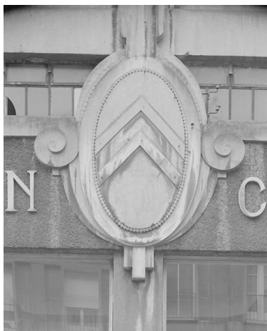
Détail du médaillon portant le sigle Citroën et ornant l'ancienne entrée principale sur la façade. IVR22_19978001056V