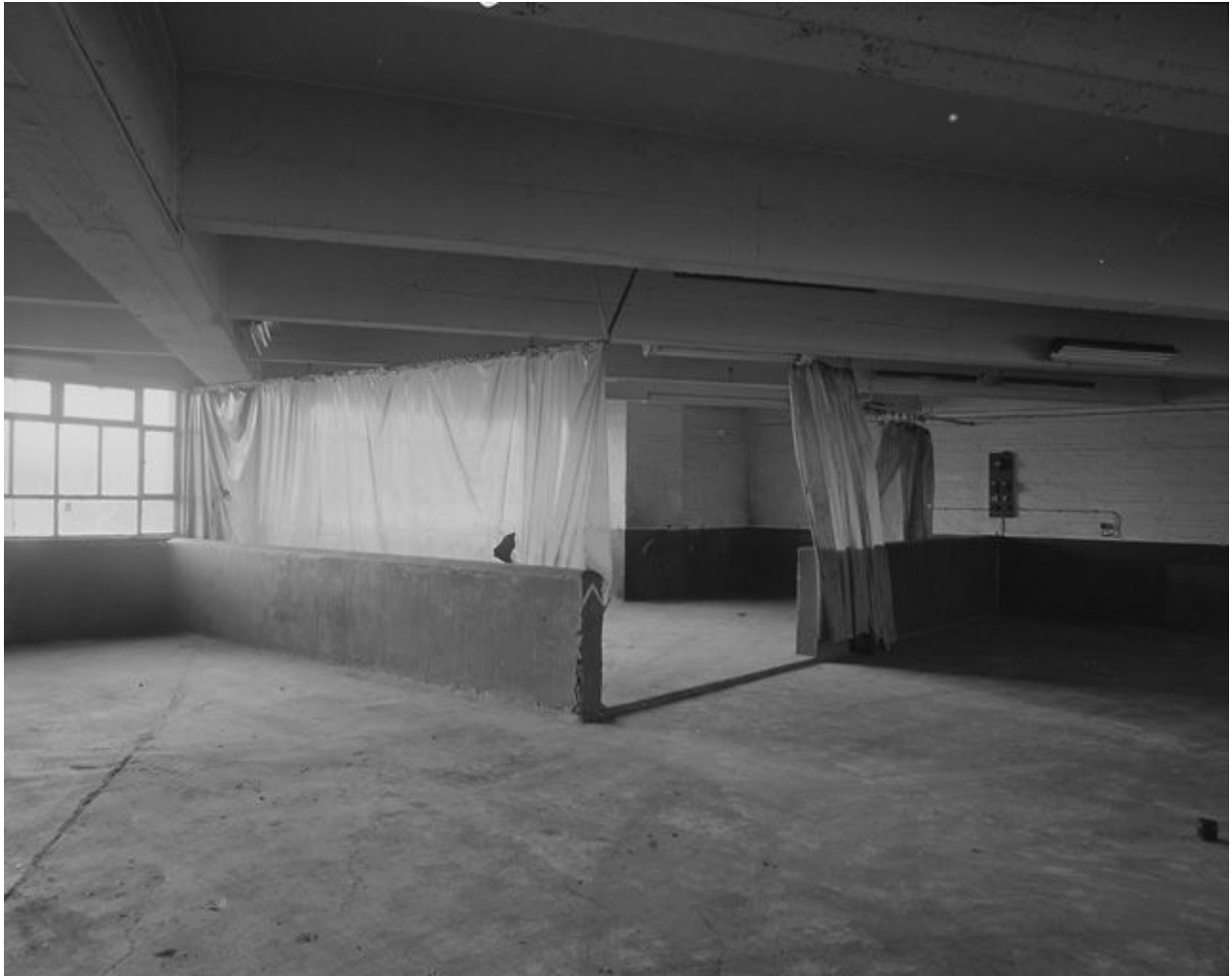
Vue d'ensemble d'une station de lavage au niveau 3.