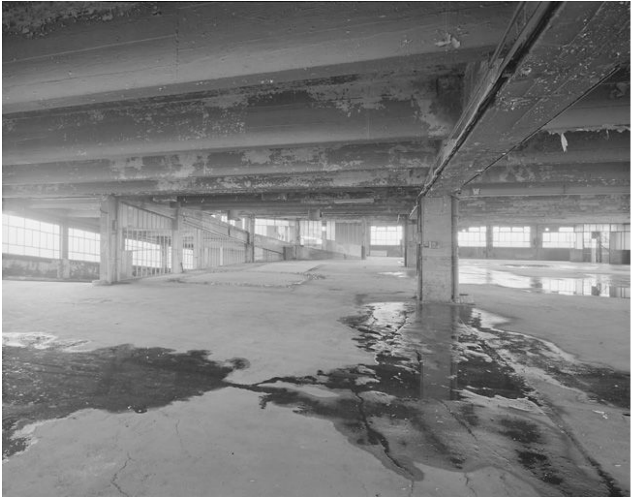
Vue d'ensemble du niveau 3.