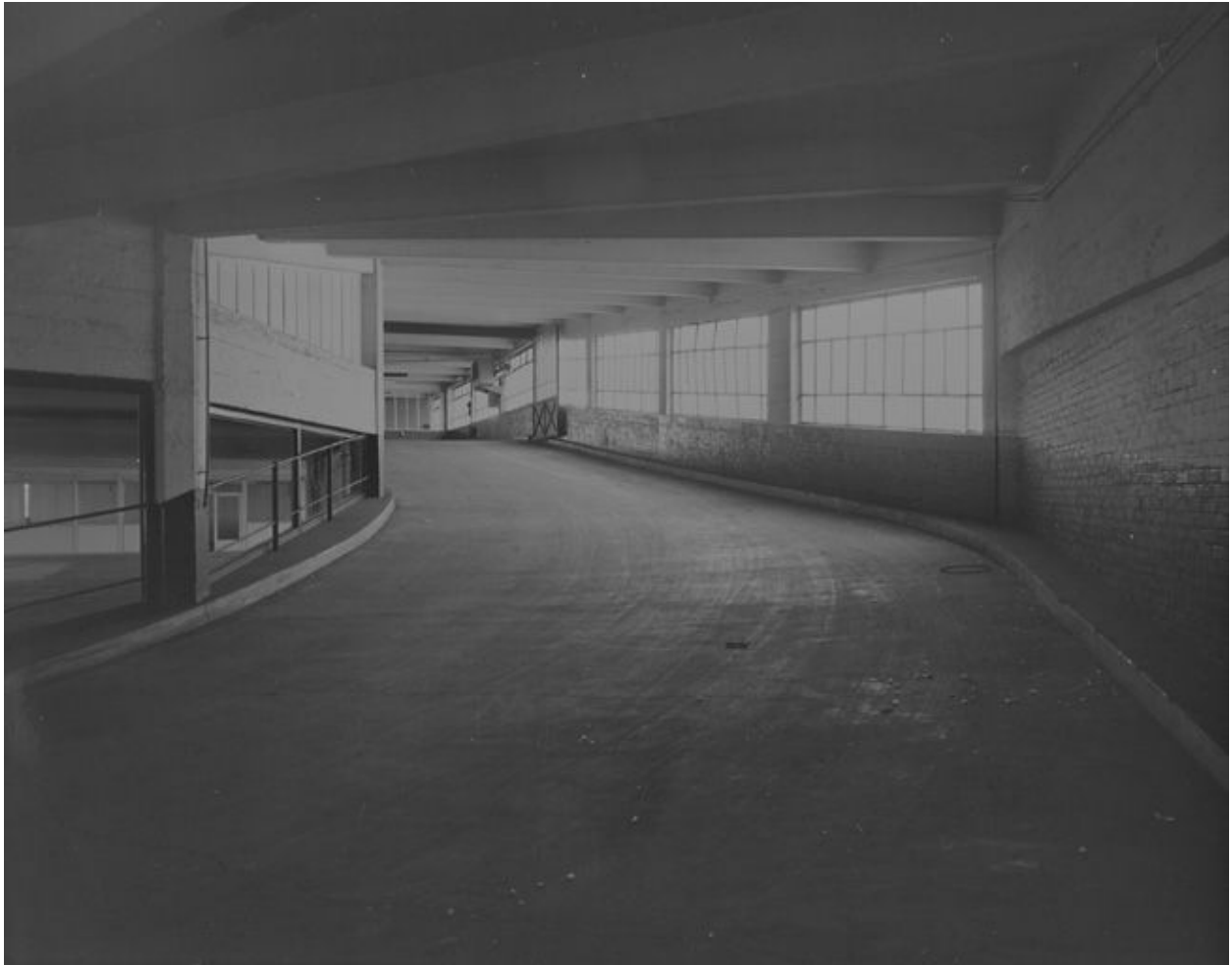
Vue d'ensemble de la rampe d'accès entre le niveau 2 et le niveau 3.