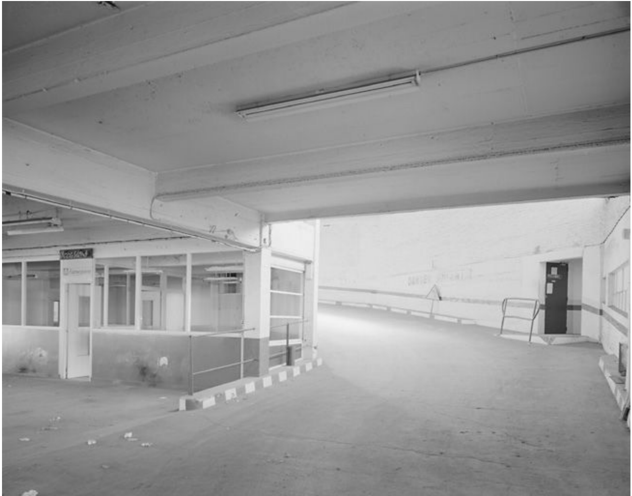
Vue du rez-de-chaussée et du début de la rampe d'accès.