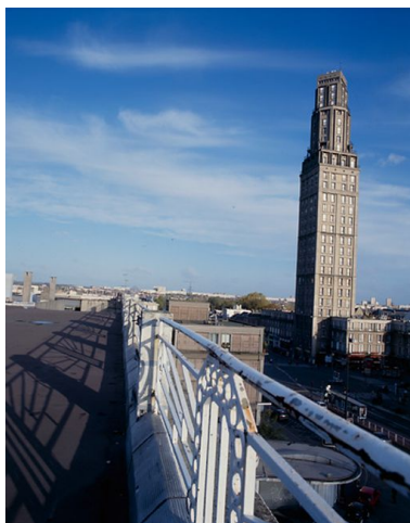
Vue de la tour Perret depuis la terrasse du garage Citroën.