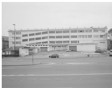
Vue générale depuis l'ouest. IVR22_19978001085V