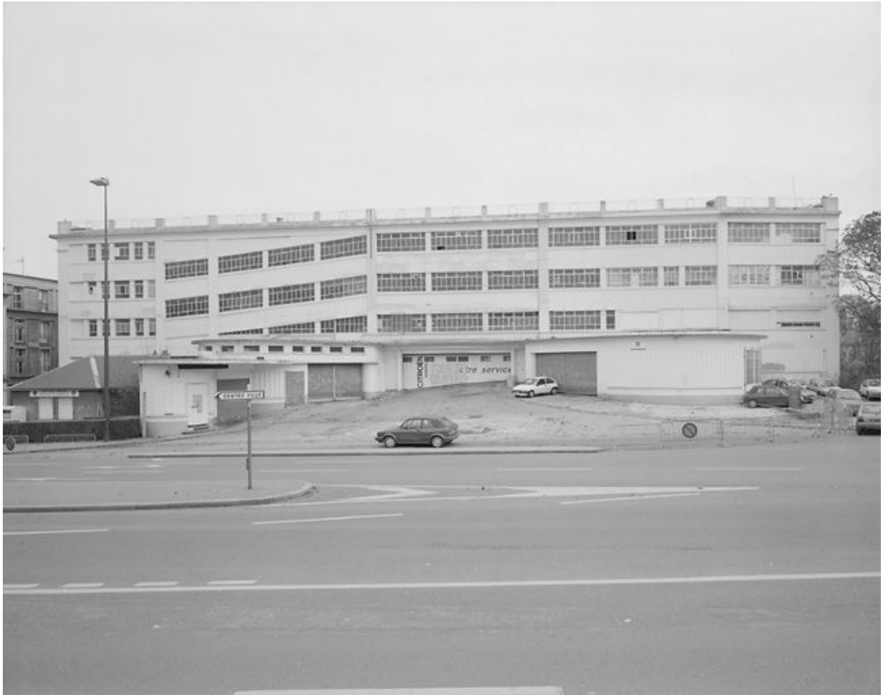
Vue générale depuis l'ouest.