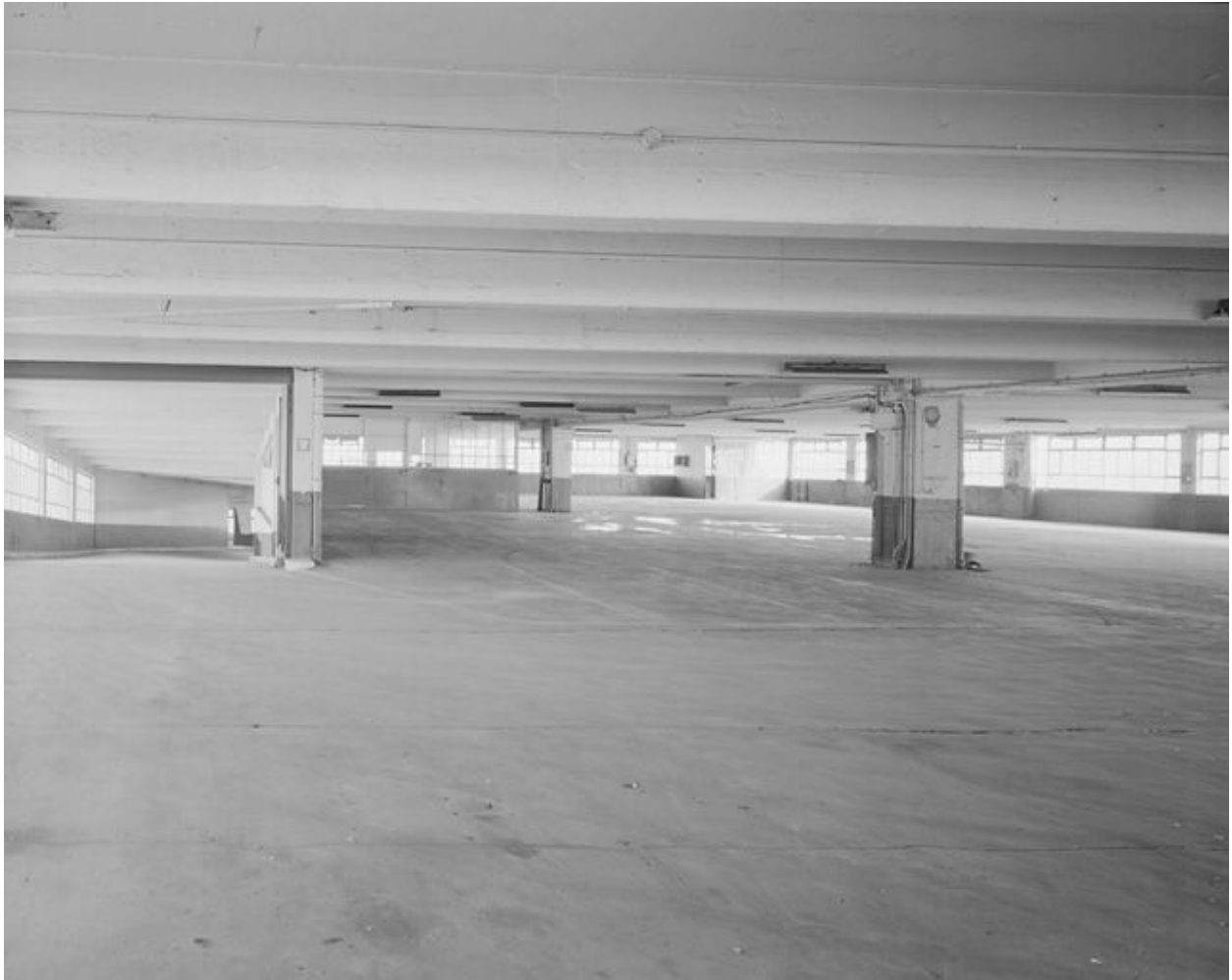
Vue d'ensemble du niveau 3.