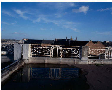
Détail de la balustrade bordant la terrasse.