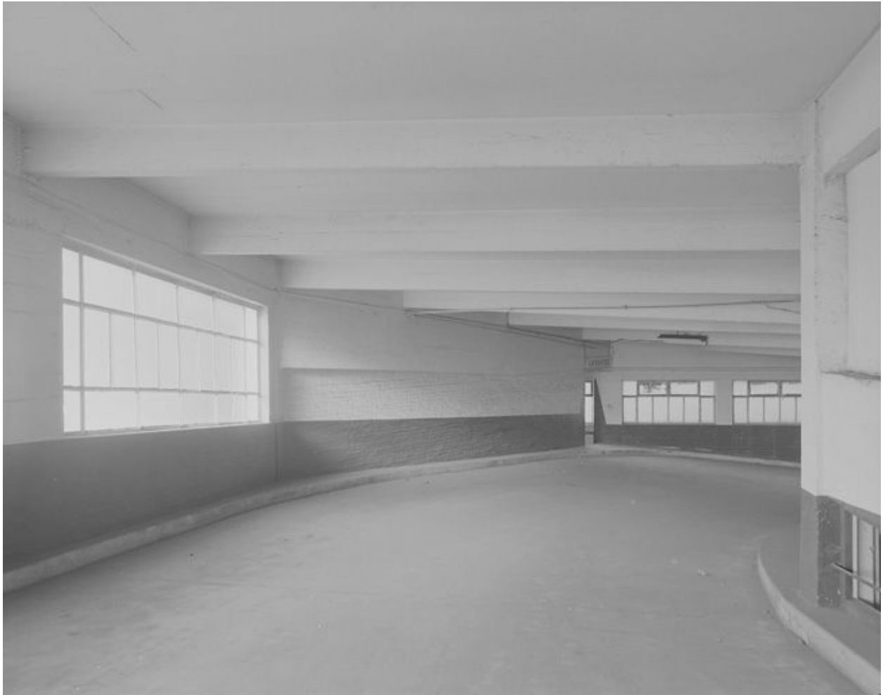
Vue d'une partie de la rampe d'accès entre le niveau 2 et le niveau 3.