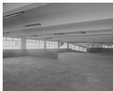
Vue d'ensemble du niveau 3.