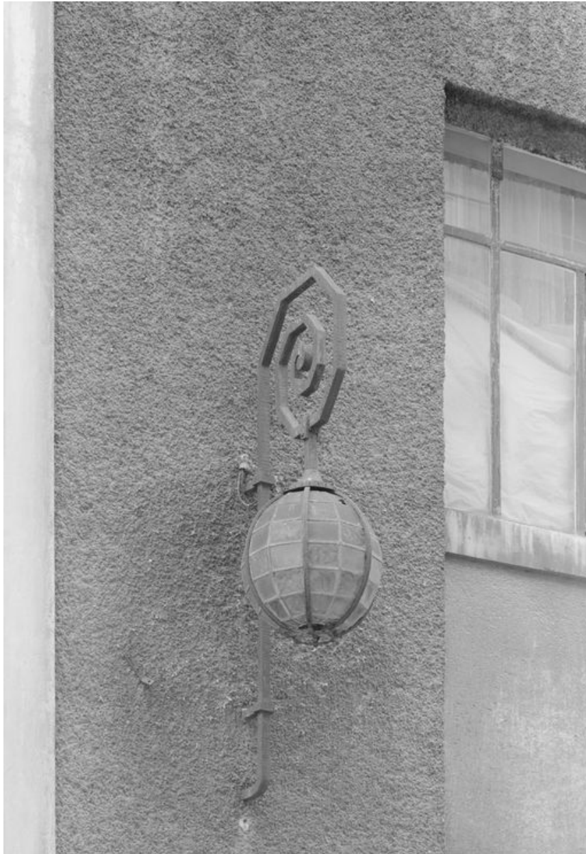
Vue d'un lampadaire style art déco.