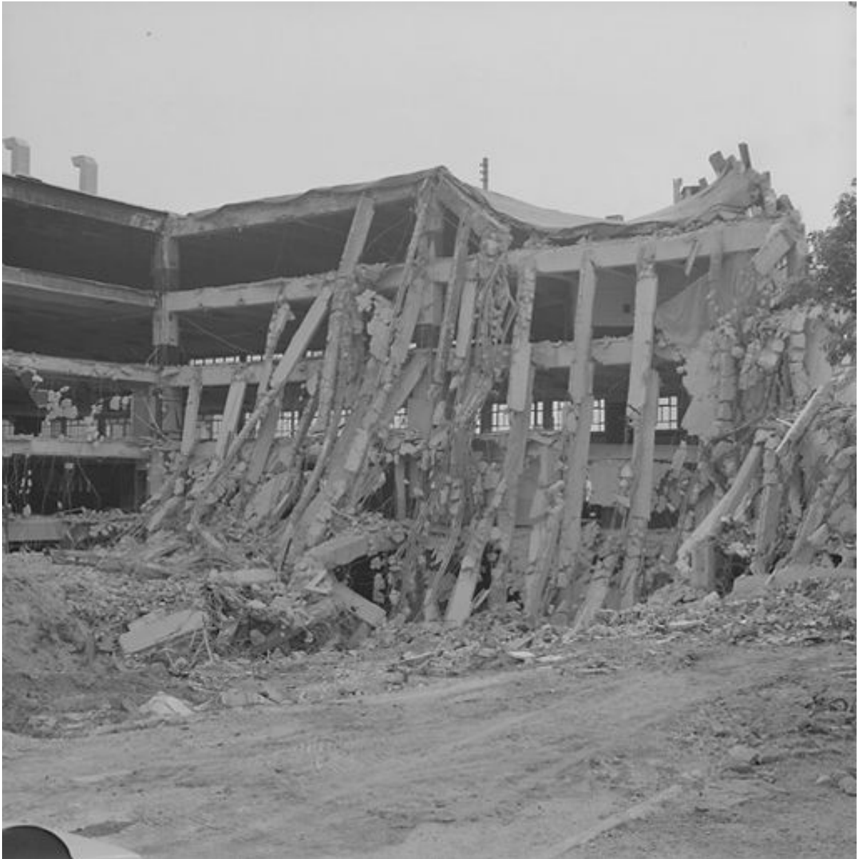
Vue d'ensemble du garage en cours de démolition, le 26 avril 1999.