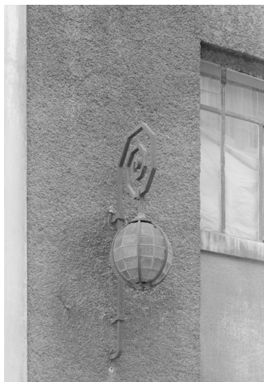
Vue d'un lampadaire style art déco. IVR22_19978001053X