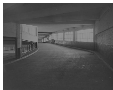
Vue d'ensemble de la rampe d'accès entre le niveau 2 et le niveau 3. IVR22_19988001212X