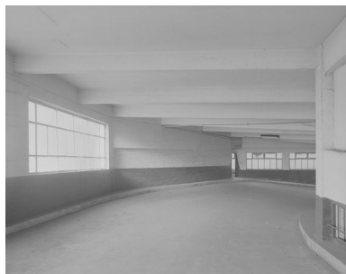
Vue d'une partie de la rampe d'accès entre le niveau 2 et le niveau 3.