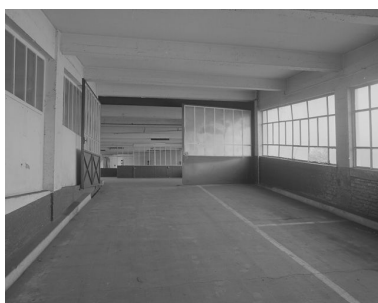
Vue d'ensemble de la rampe d'accès entre le niveau 2 et le niveau 3. IVR22_19988001213X