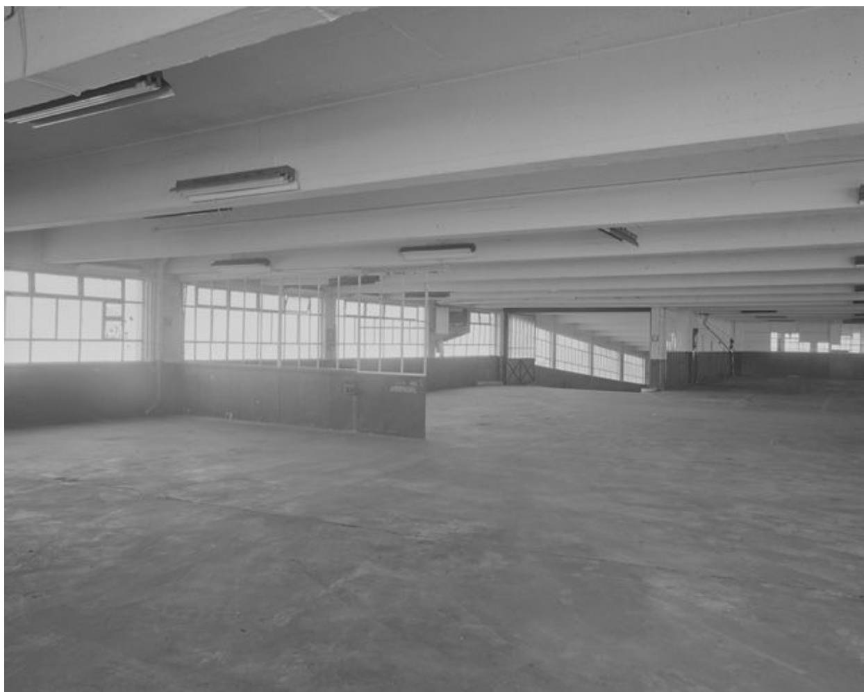
Vue d'ensemble du niveau 3.