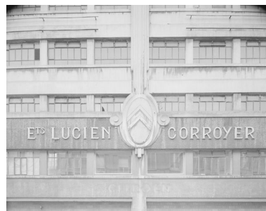
Vue du décor porté ornant l'ancienne entrée principale sur la façade nord. IVR22_19978001057V