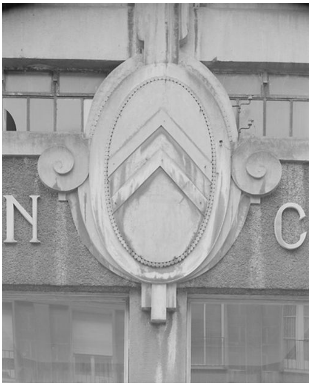
Détail du médaillon portant le sigle Citroën et ornant l'ancienne entrée principale sur la façade.