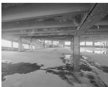
Vue d'ensemble du niveau 3.