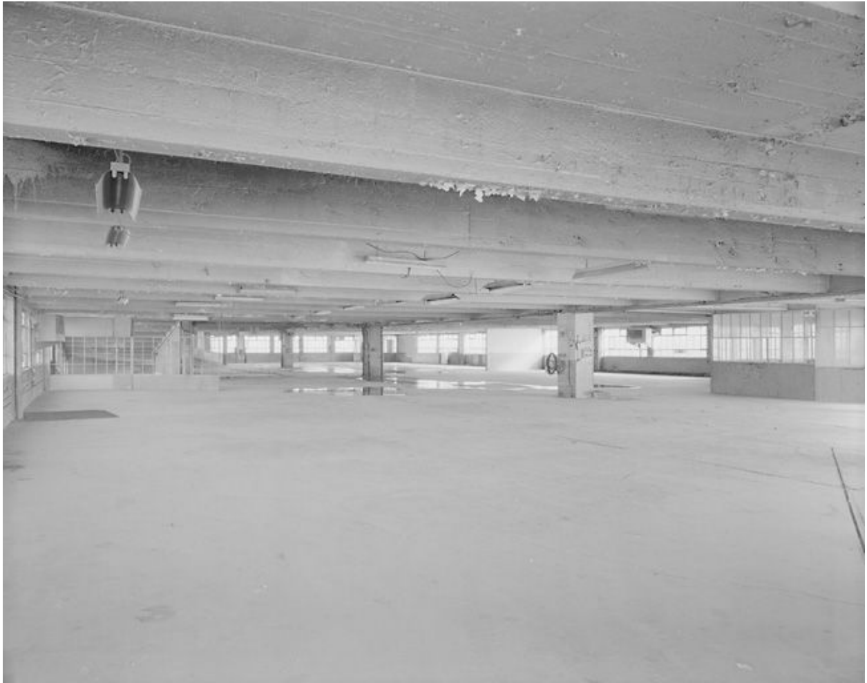
Vue d'ensemble du niveau 3.