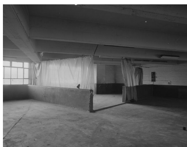
Vue d'ensemble d'une station de lavage au niveau 3. IVR22_19988001216X