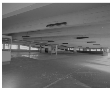
Vue d'ensemble du niveau 1.