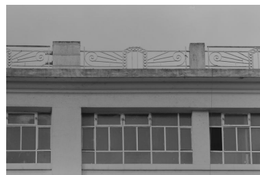
Détail de la balustrade bordant la terrasse.