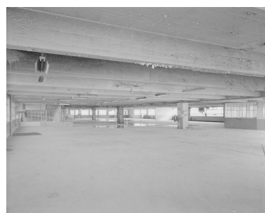
Vue d'ensemble du niveau 3. IVR22_19988001199V