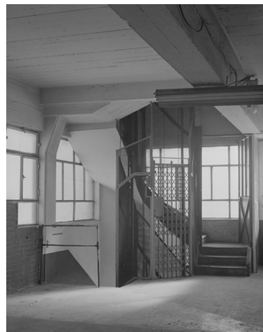
Vue d'ensemble de la cage d'ascenseur.