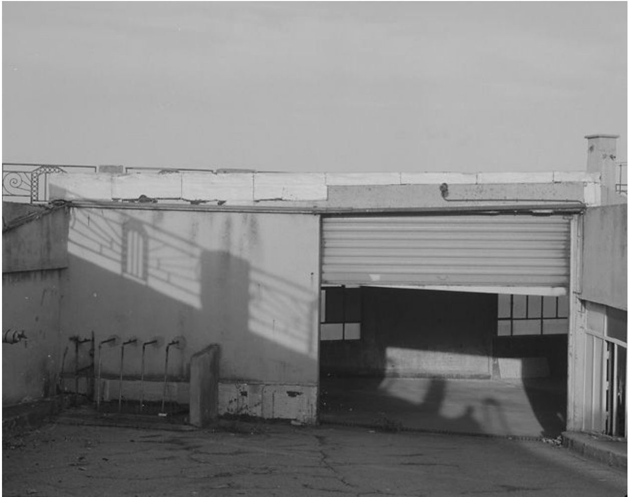
Vue de la sortie de garage sur la terrasse.