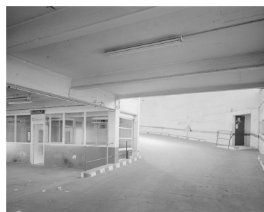
Vue du rez-de-chaussée et du début de la rampe d'accès.