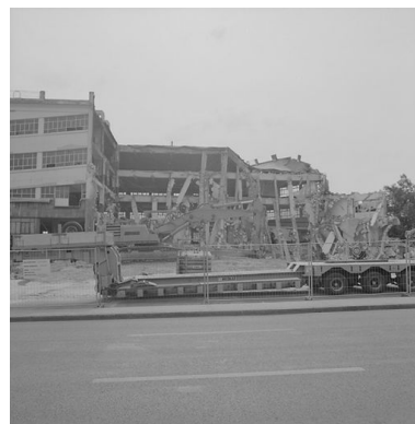
Vue d'ensemble du garage en cours de démolition, le 26 avril 1999. IVR22_19998000917X