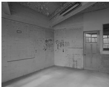
Vue d'ensemble du magasin à outils et pièces détachées. IVR22_19988001219X