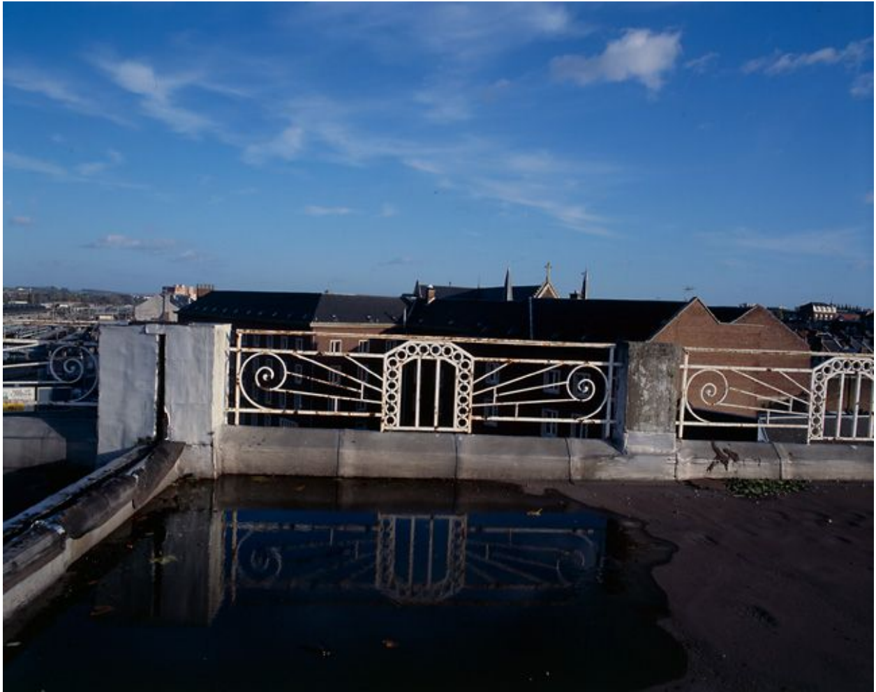
Détail de la balustrade bordant la terrasse.