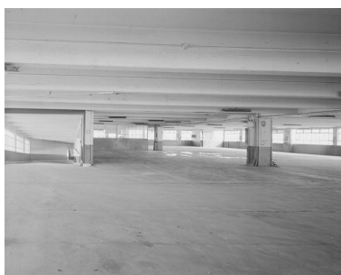
Vue d'ensemble du niveau 3. IVR22_19988001198V