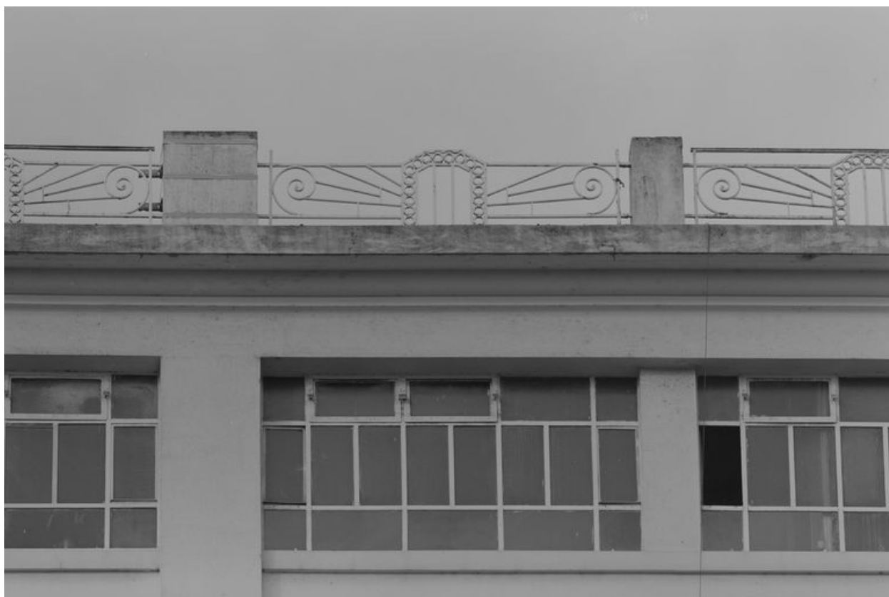
Détail de la balustrade bordant la terrasse.