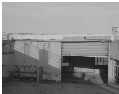
Vue de la sortie de garage sur la terrasse. IVR22_19988001248X