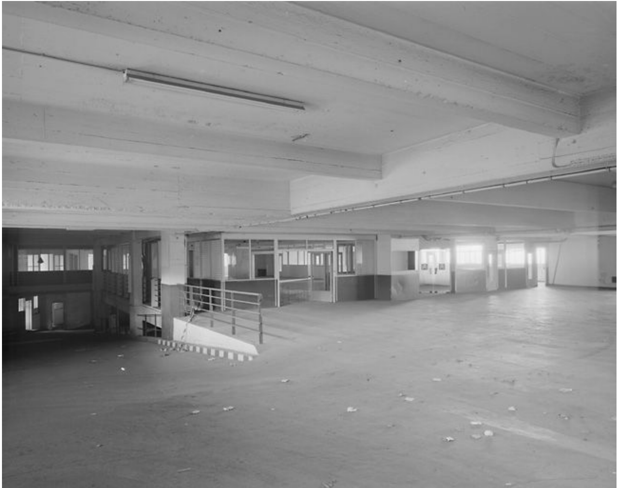
Vue d'ensemble de l'entresol et des bureaux de comptabilité.