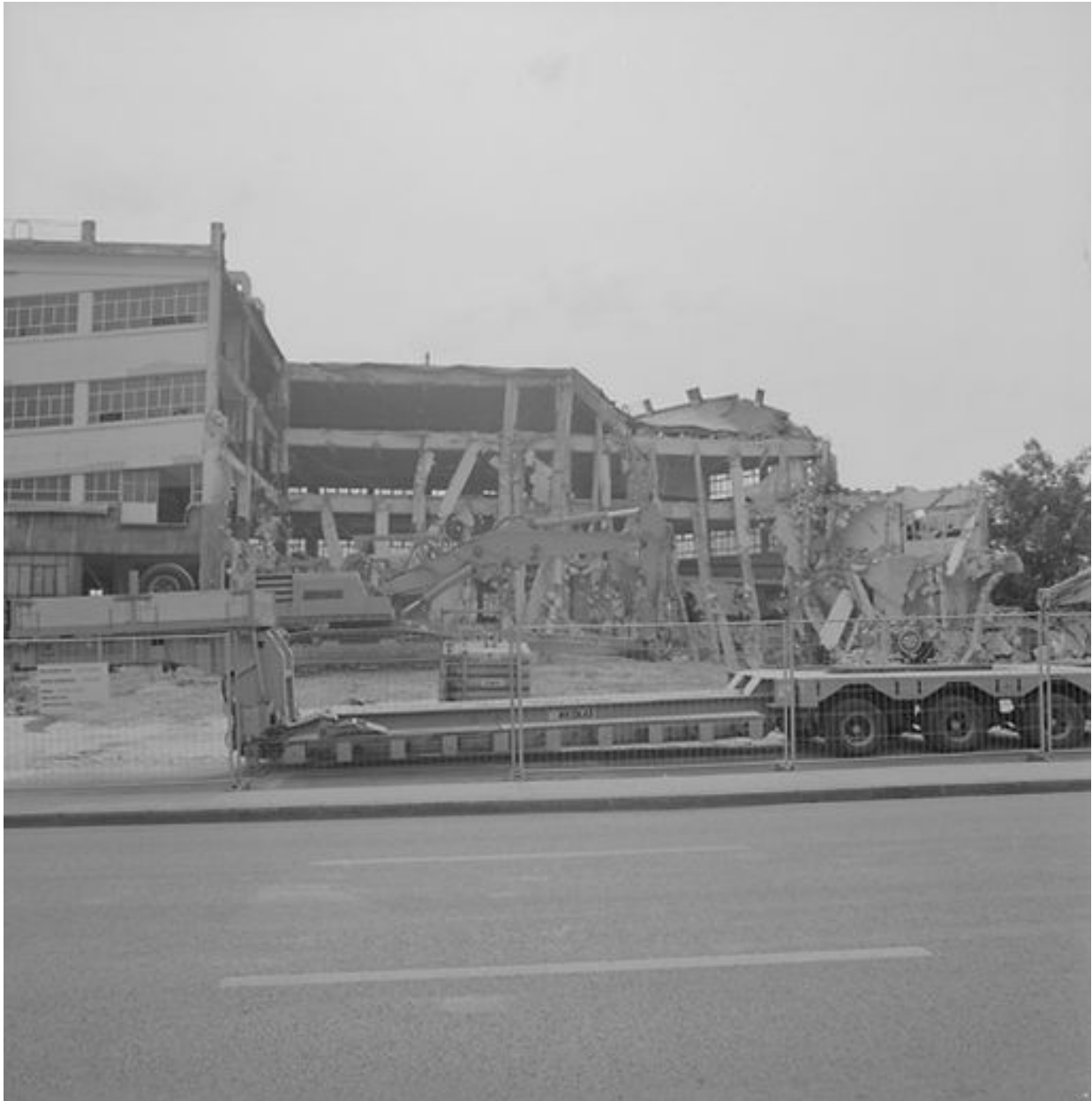
Vue d'ensemble du garage en cours de démolition, le 26 avril 1999.