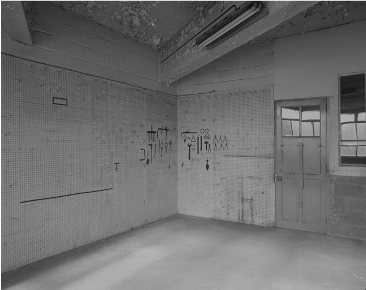
Vue d'ensemble du magasin à outils et pièces détachées.