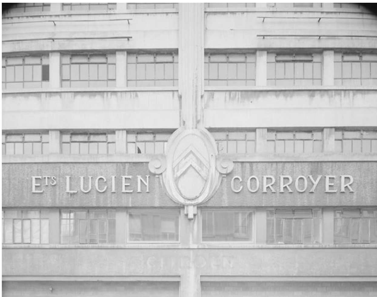
Vue du décor porté ornant l'ancienne entrée principale sur la façade nord.