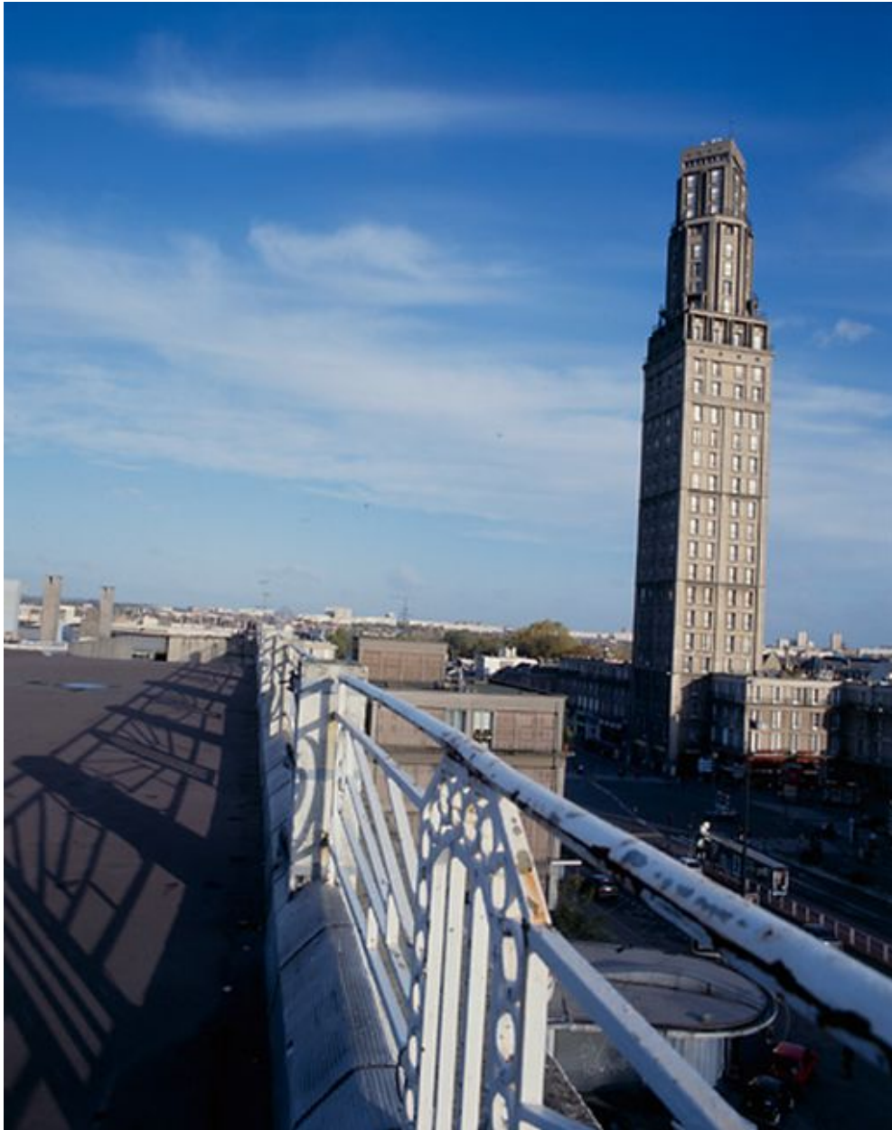
Vue de la tour Perret depuis la terrasse du garage Citroën.