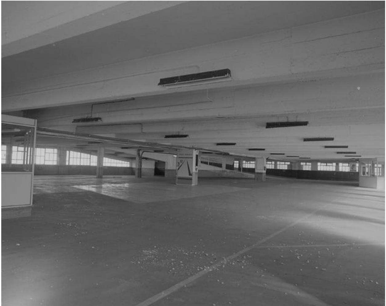
Vue d'ensemble du niveau 1.