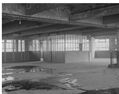
Vue d'une partie des bureaux au niveau 3. IVR22_19988001217X