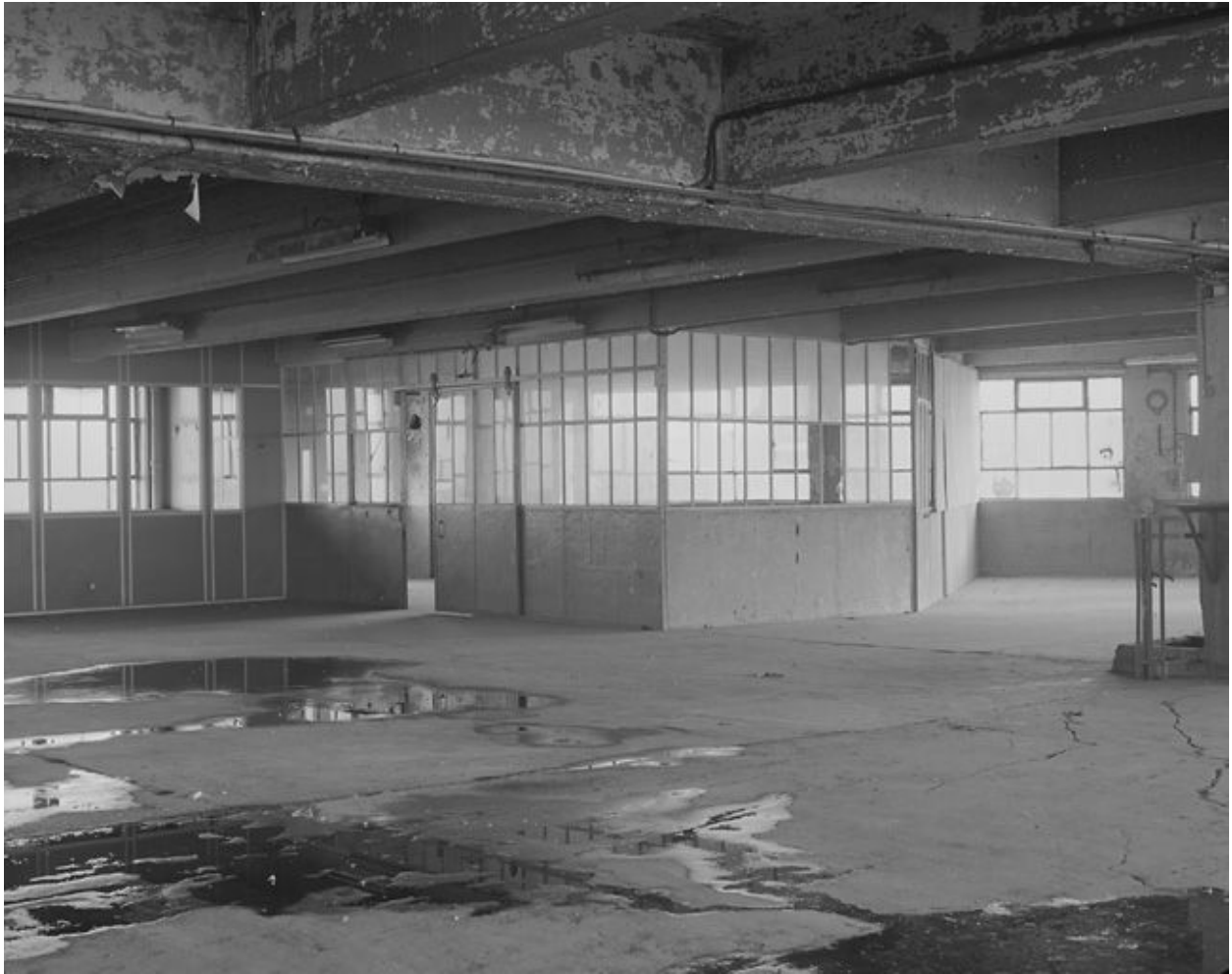
Vue d'une partie des bureaux au niveau 3.