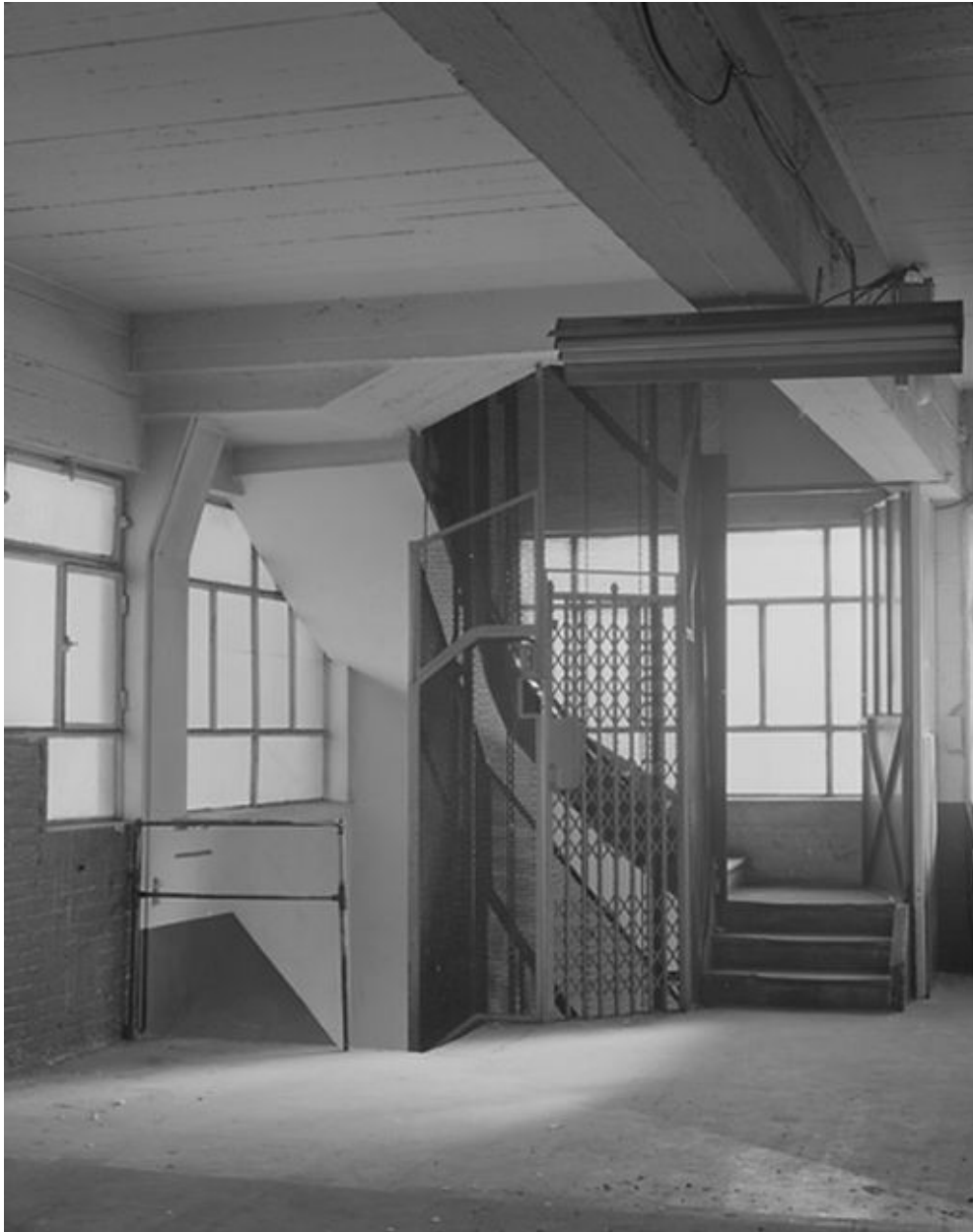
Vue d'ensemble de la cage d'ascenseur.