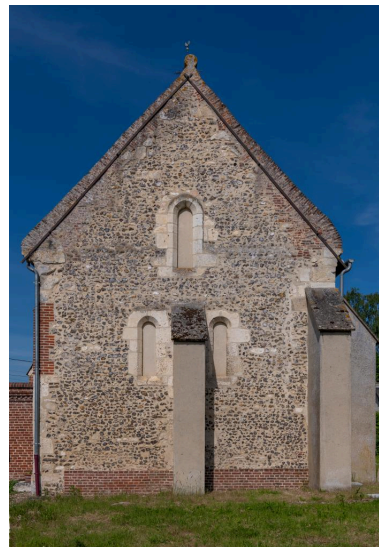
Vue du chevet.