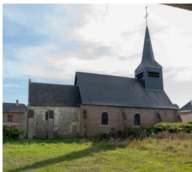
Vue depuis le nord. IVR32_20216000933NUCA