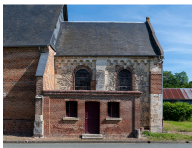
Vue sud du chœur et de la sacristie.