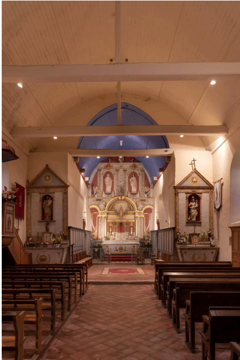
Vue intérieure vers le chœur.