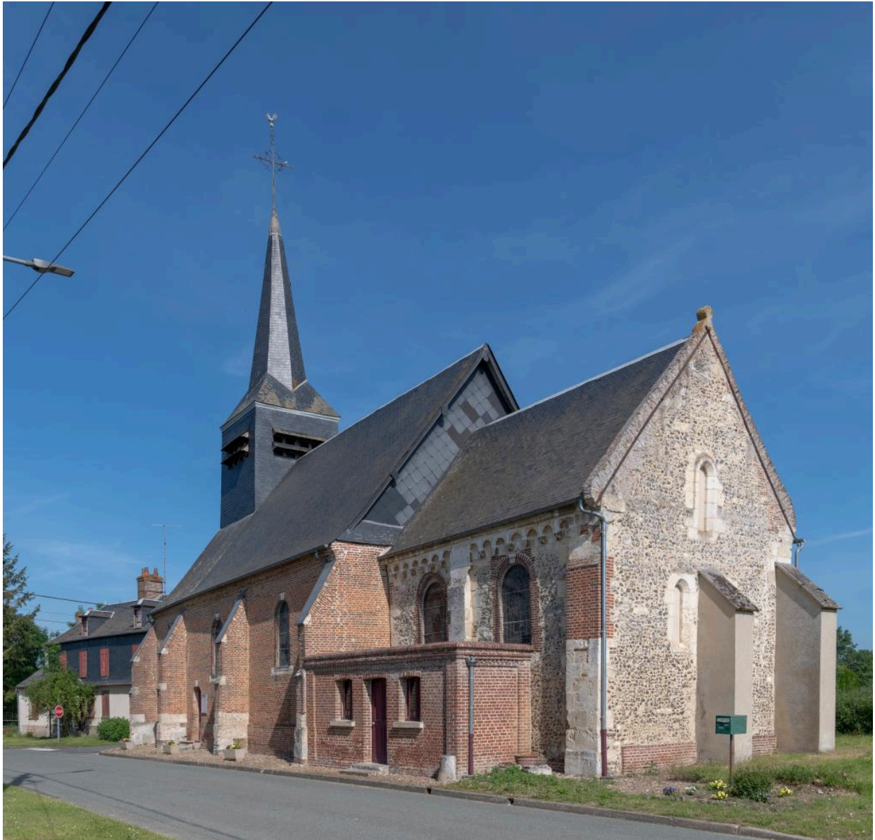
Vue de l'église depuis le sud-est.