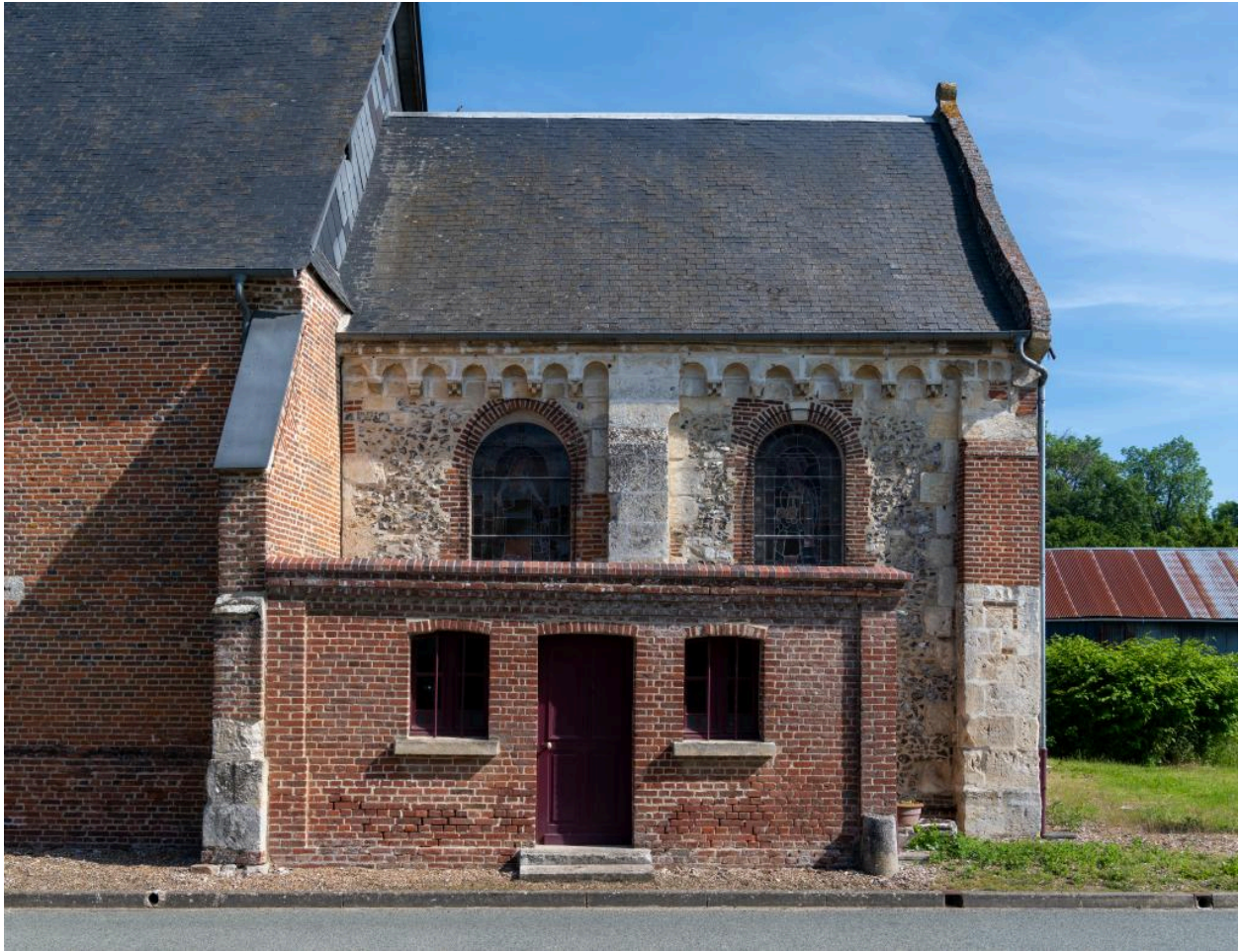
Vue sud du chœur et de la sacristie.