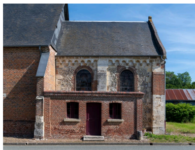
Vue sud du chœur et de la sacristie. IVR32_20216000566NUCA