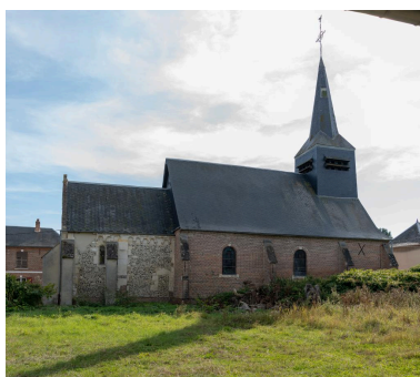
Vue depuis le nord. IVR32_20216000933NUCA