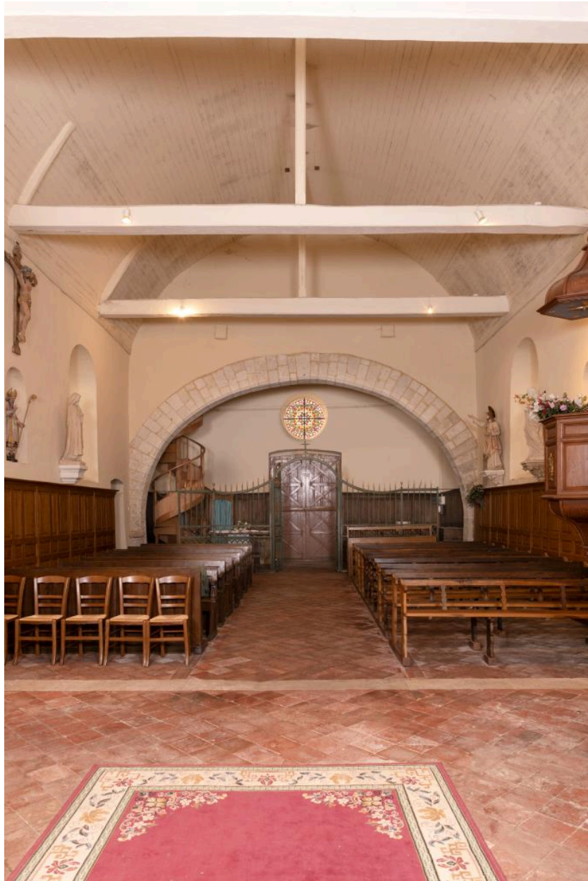
Vue intérieure vers la nef.