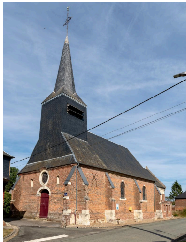
Vue générale depuis le sud-ouest. IVR32_20216000931NUCA