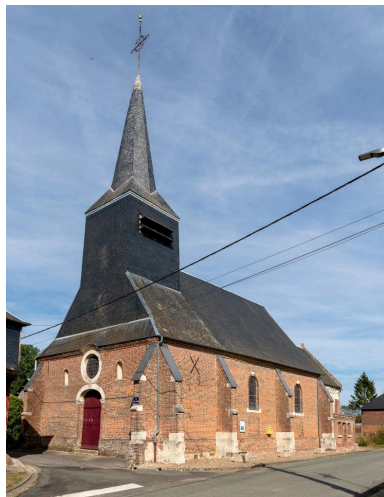
Vue générale depuis le sud-ouest. IVR32_20216000931NUCA