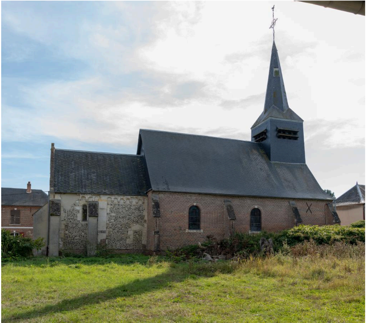
Vue depuis le nord.