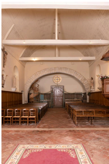
Vue intérieure vers la nef.