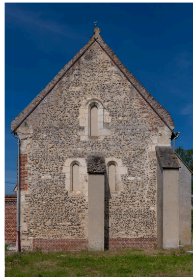
Vue du chevet. IVR32_20216000565NUCA