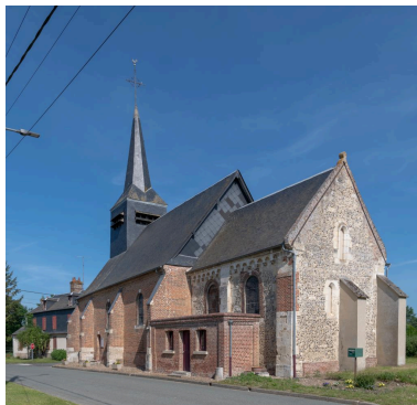
Vue de l'église depuis le sud-est. IVR32_20216000564NUCA