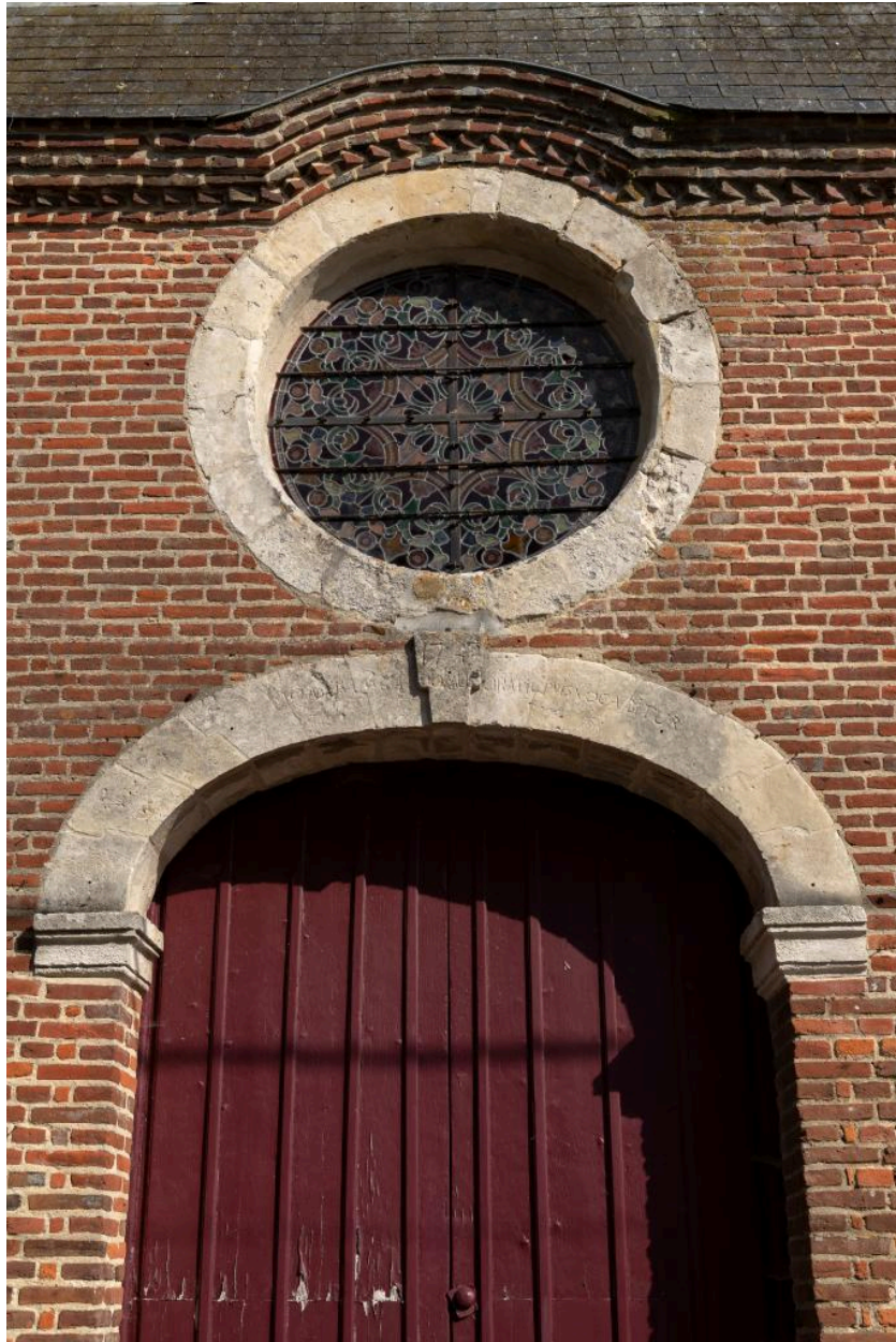
Détail du portail occidental avec inscription en latin et date "1742" sur l'arc au-dessus de la porte.