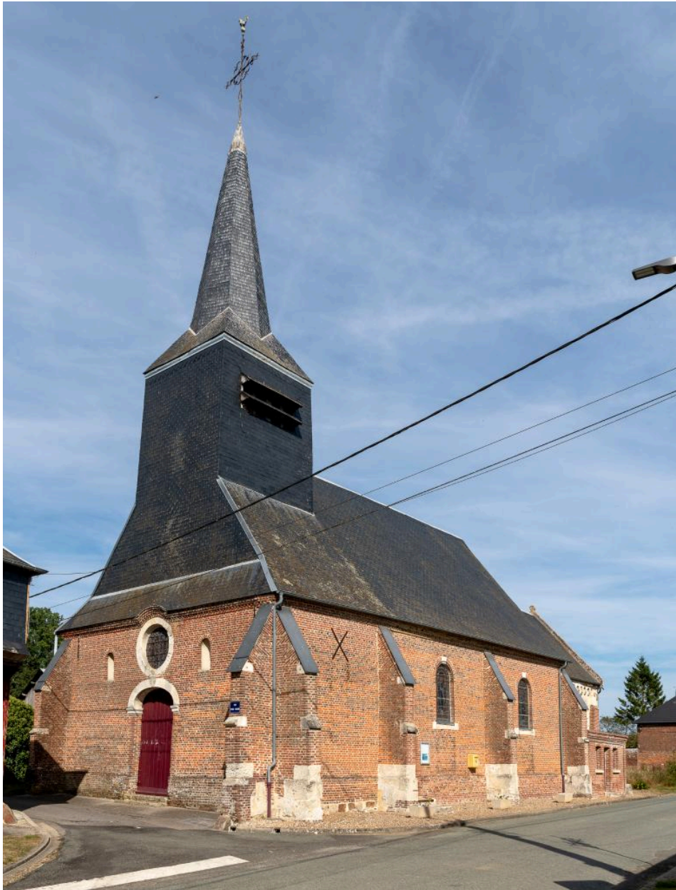
Vue générale depuis le sud-ouest.