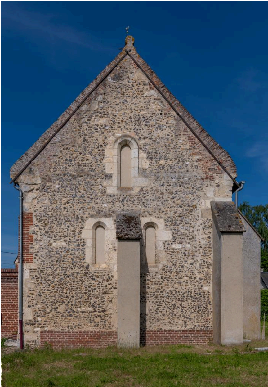
Vue du chevet.