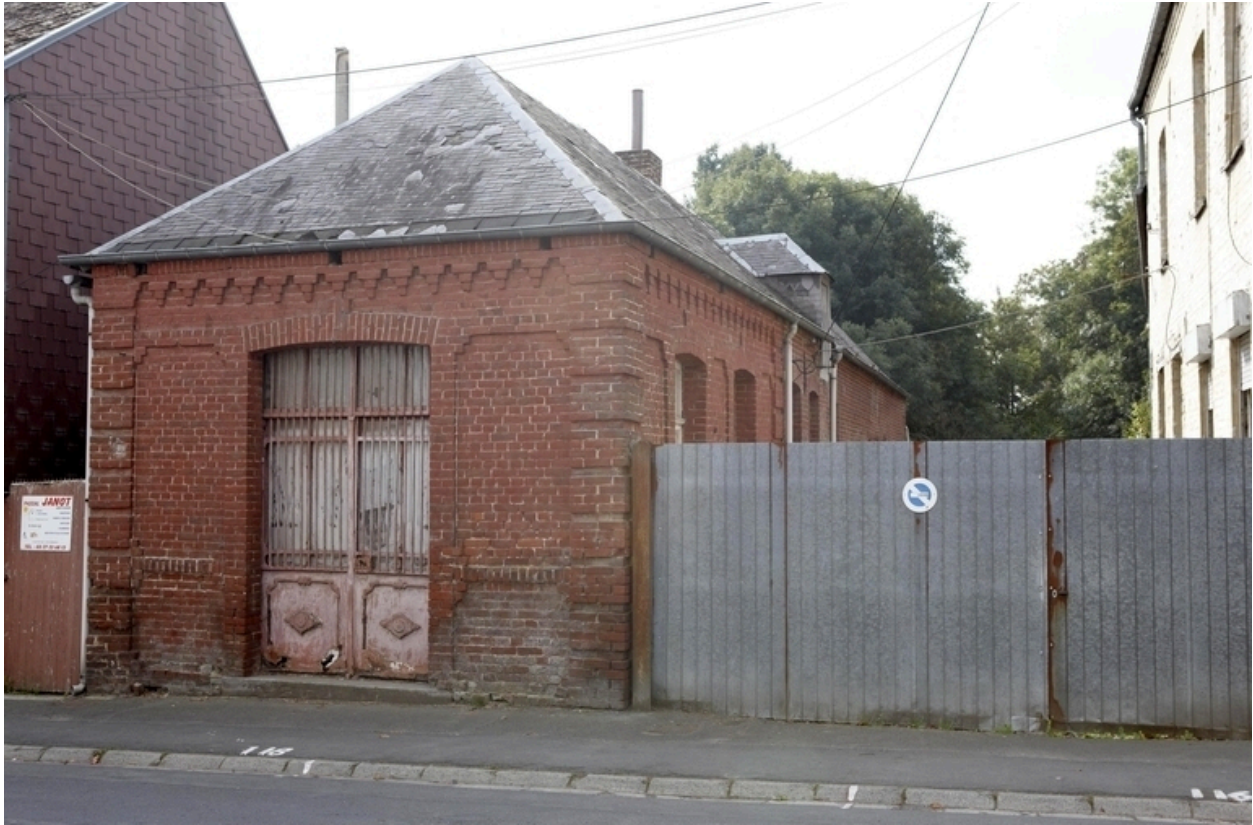
Vue de la boucherie.