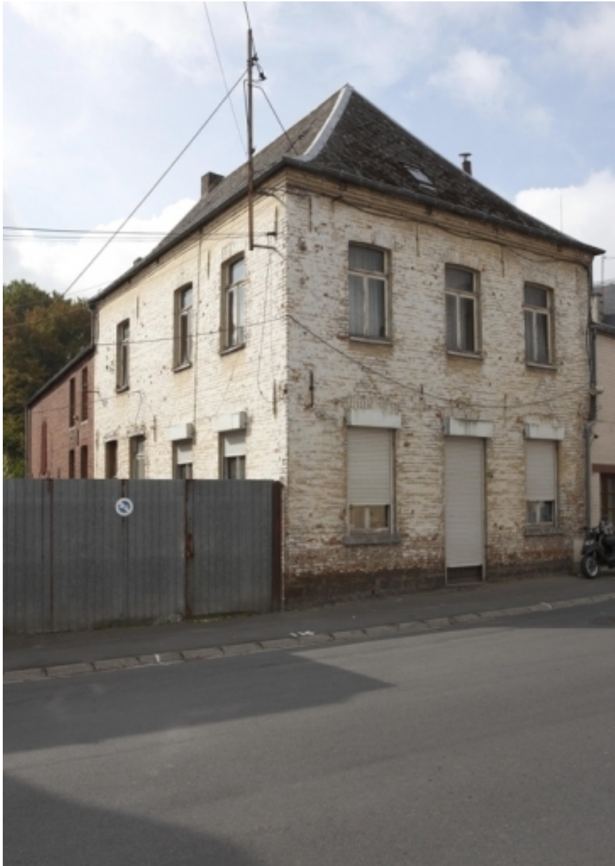
Vue de l'habitation et des étables.