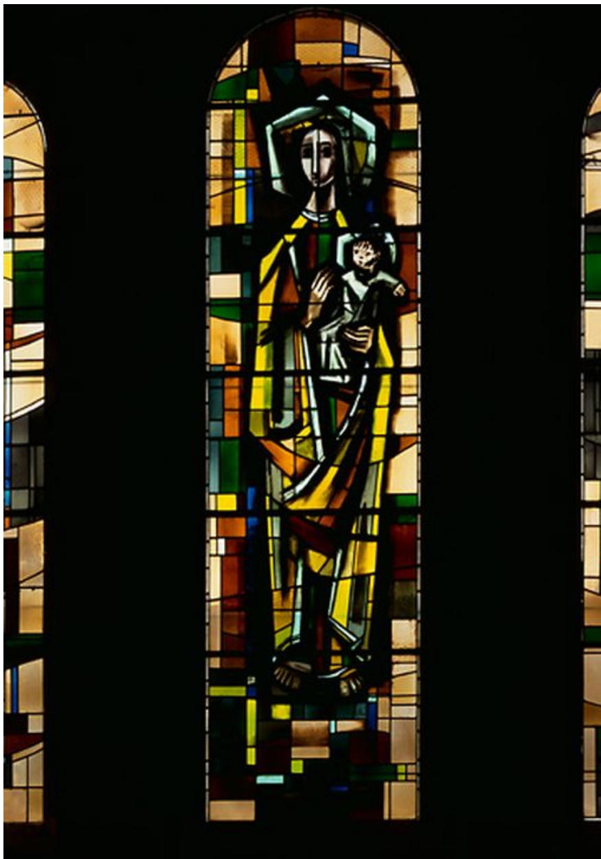
Verrière représentant une Vierge à l'Enfant, J. Archepel, 1955.