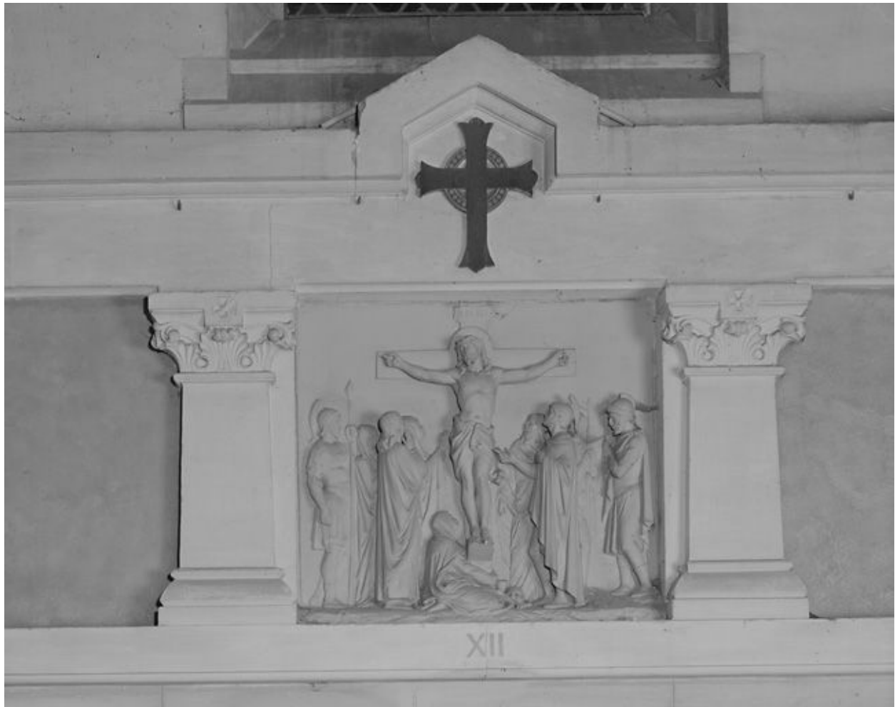
Station du chemin de croix.