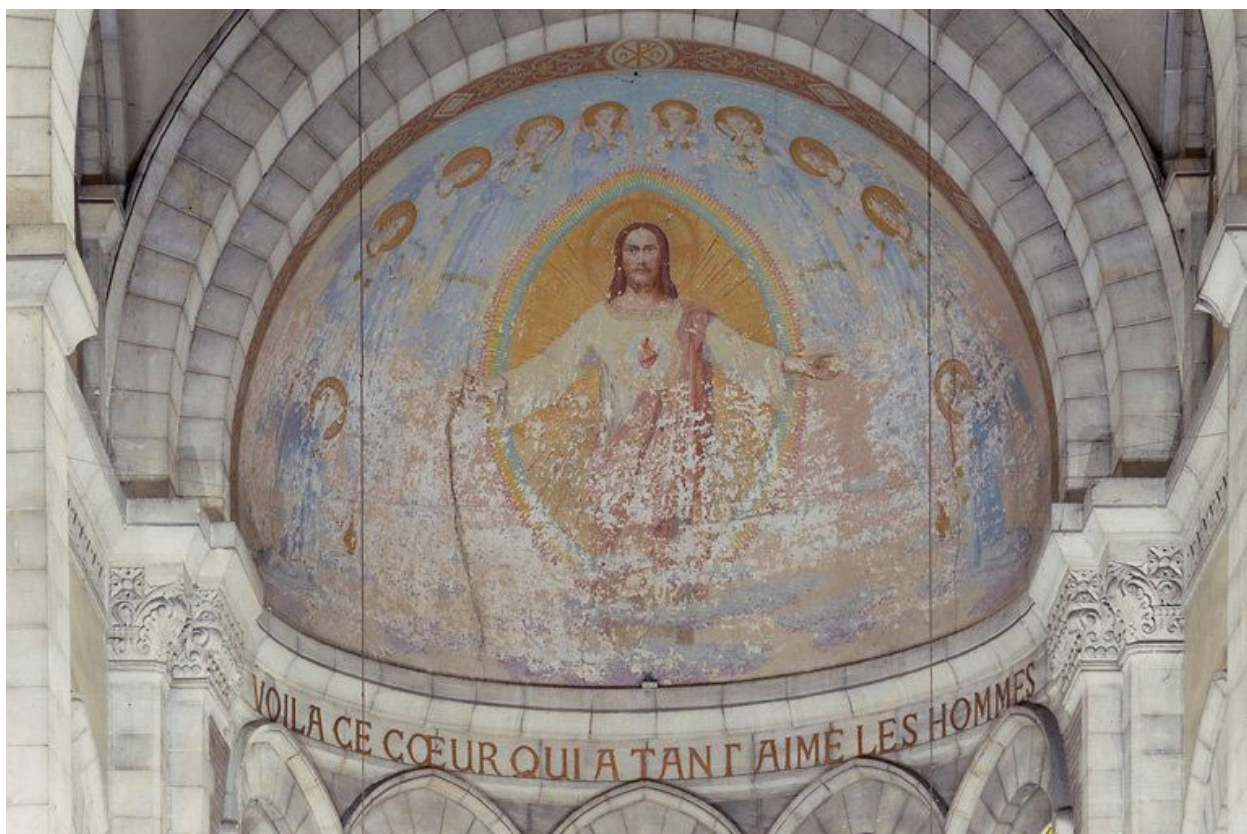
Le décor peint de l'abside, G. Riquet.