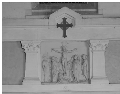
Station du chemin de croix. IVR22_19968000210V