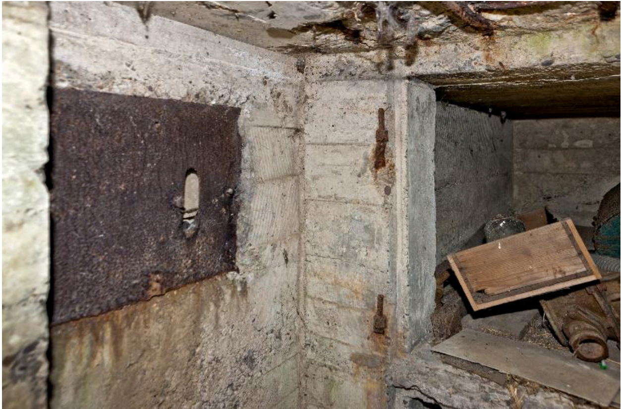
Resseres à mitrailleuses ? et ouverture de tir, à gauche