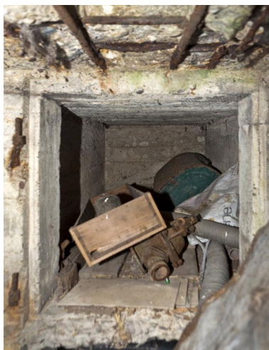
Resseres à mitrailleuses ? IVR31_20145904479NUCA