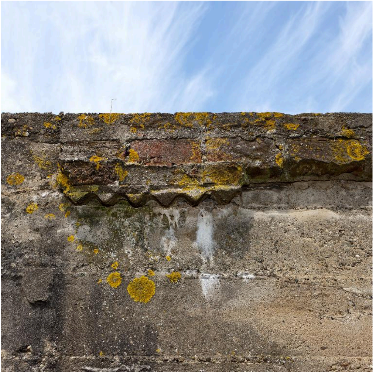
Elévation est, détail