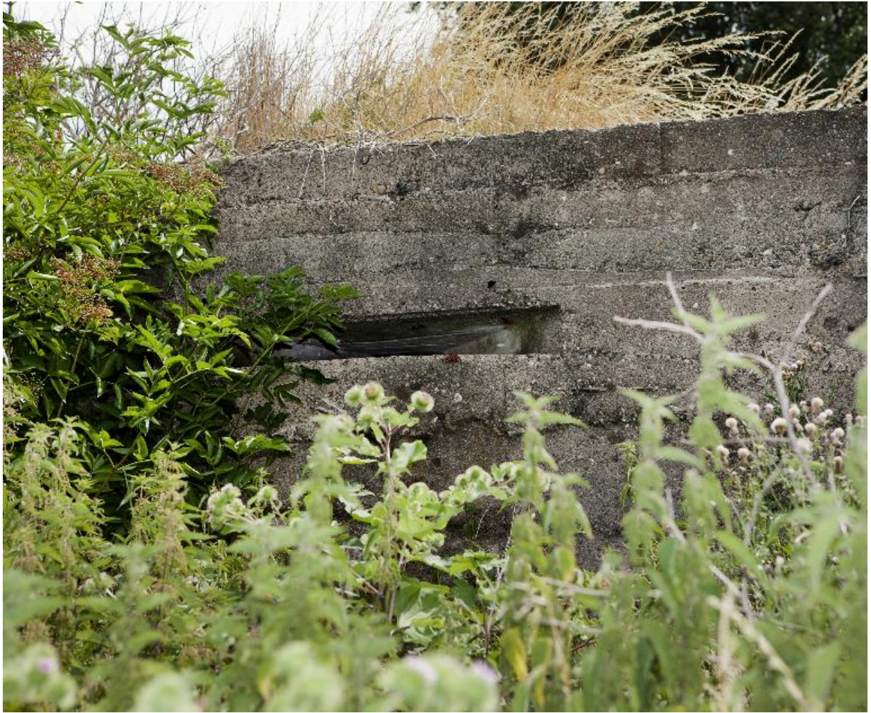
Embrasure de tir, élévation ouest