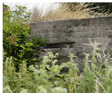
Embrasure de tir, élévation ouest IVR31_20145904480NUCA