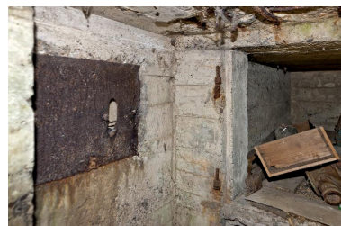
Resseres à mitrailleuses ? et ouverture de tir, à gauche IVR31_20145904478NUCA