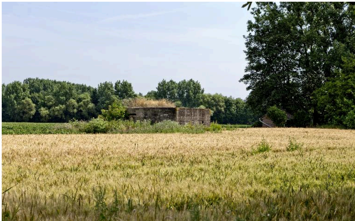
Vue de trois-quarts, vers le nord-est