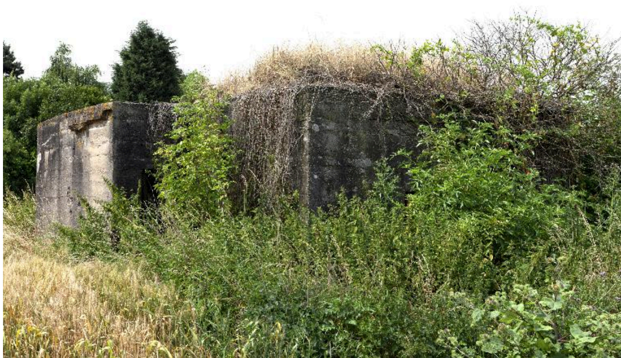
Vue de trois-quarts, vers le sud-ouest.