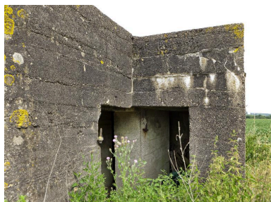
Entrées, sud IVR31_20145904475NUCA