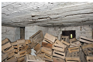
Vue intérieure