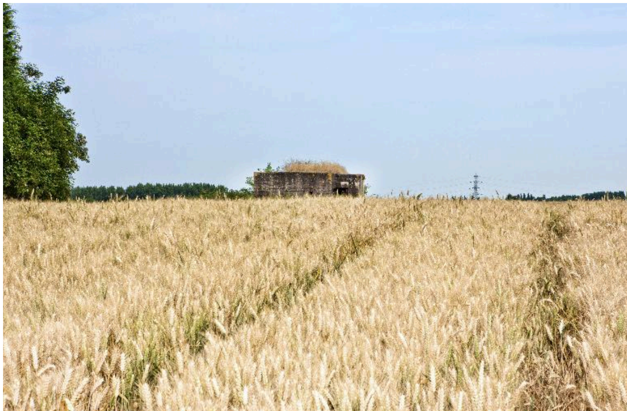
Vue générale, vers le nord