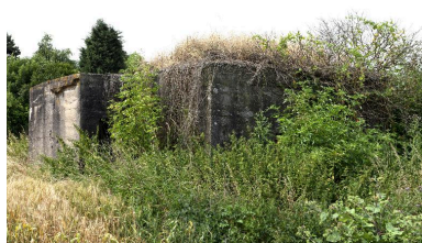
Vue de trois-quarts, vers le sud-ouest. IVR31_20145904473NUCA