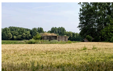
Vue de trois-quarts, vers le nord-est IVR31_20145904472NUCA