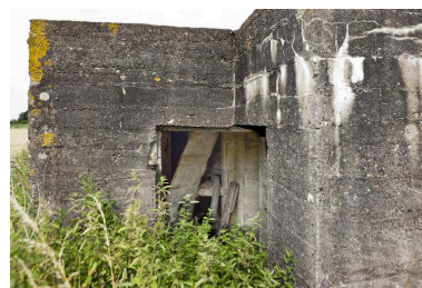
Entrées sud IVR31_20145904474NUCA