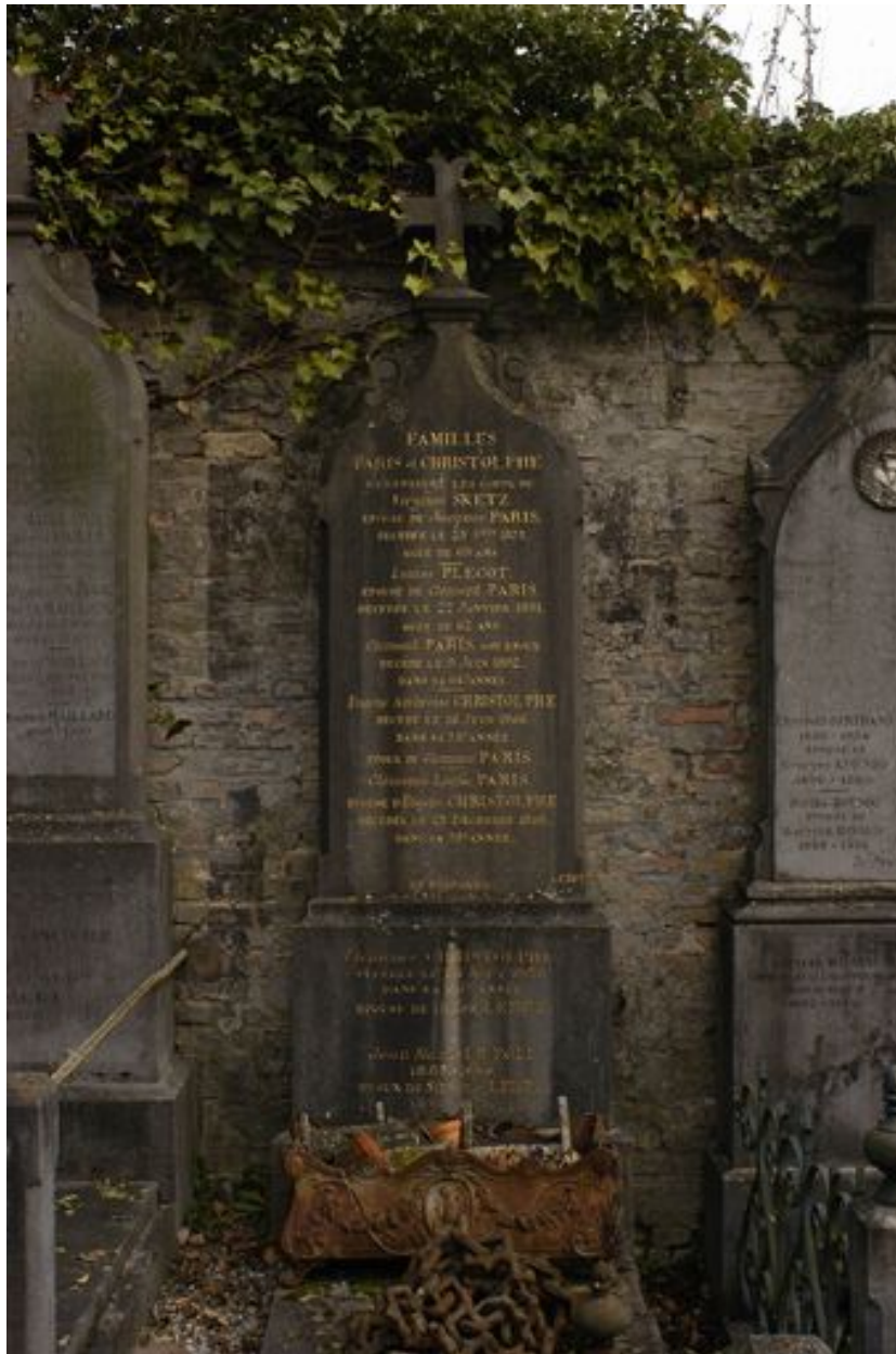
Vue de la stèle.