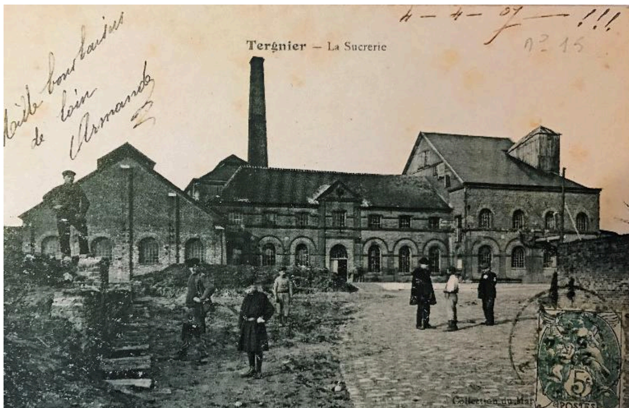
La sucrierie en 1907, carte postale.