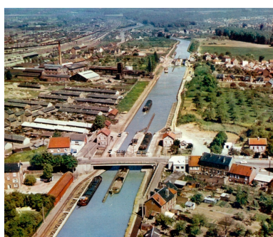
Vue aérienne du canal et de la cité provisoire. Carte postale, vers 1960 (coll. part.).