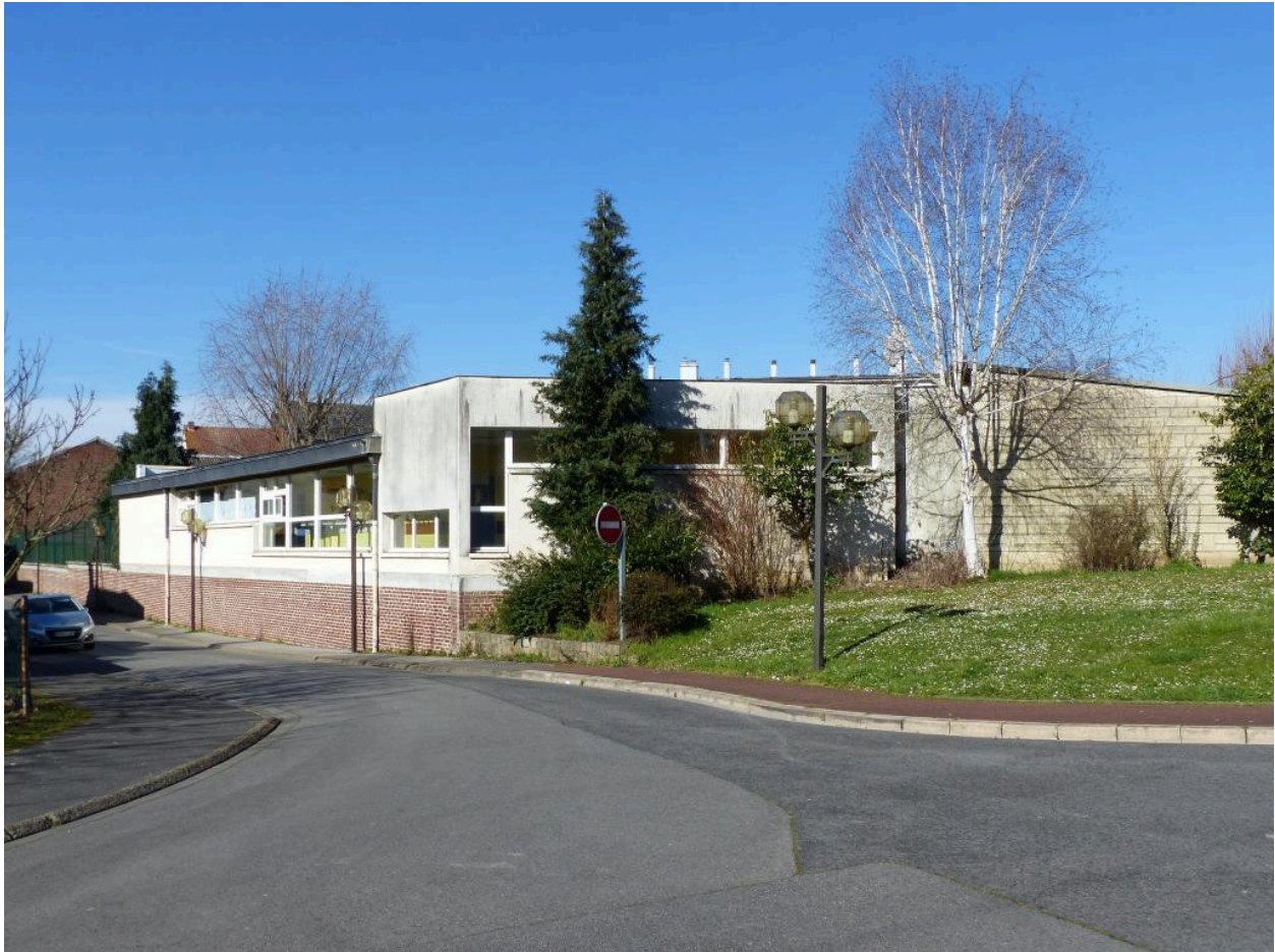
L'école maternelle. Les bâtiments construits côté rue des Lutins.