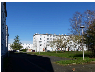
Le pavillon Lorraine.