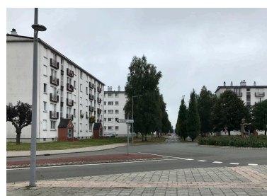
Vue de situation depuis le rond-point de la gare.