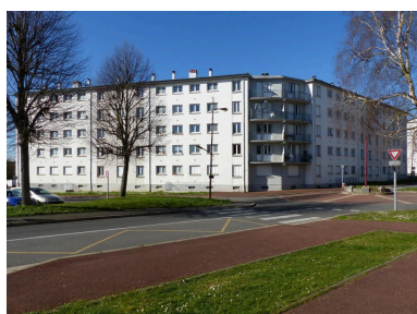
Les pavillons Bretagne et Auvergne.