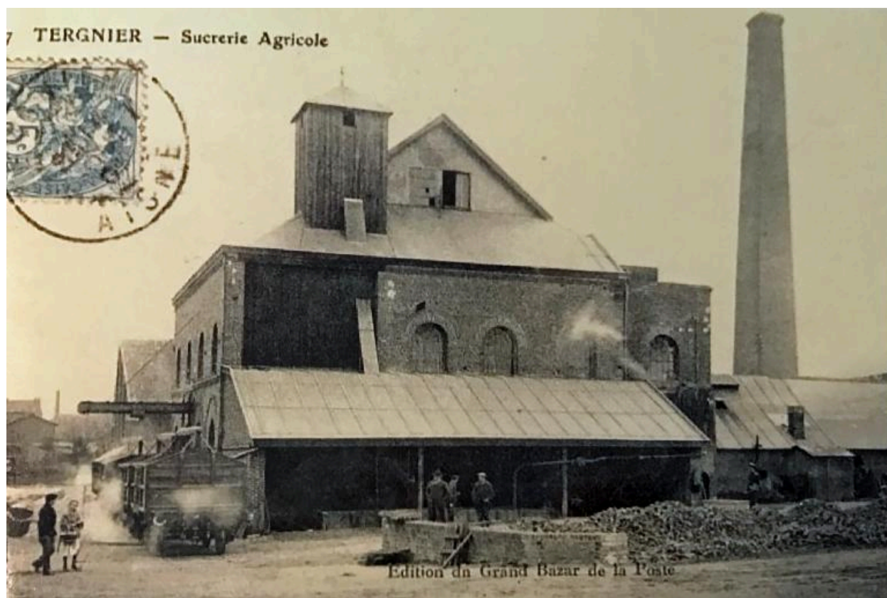
La sucrerie agricole de Tergnier, carte postale, vers 1910.