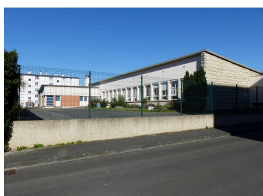
L'école primaire Roosevelt. Vue depuis la rue de la Résistance.