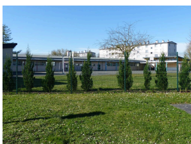
L'école primaire Roosevelt. Vue depuis la rue Marcel-Paul. La cour de récréation et le préau. IVR32_20220205026NUCA