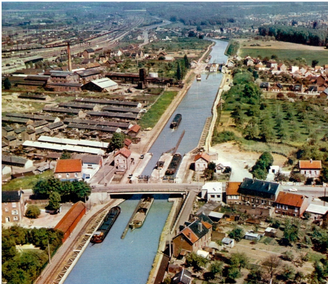
Vue aérienne du canal et de la cité provisoire. Carte postale, vers 1960.