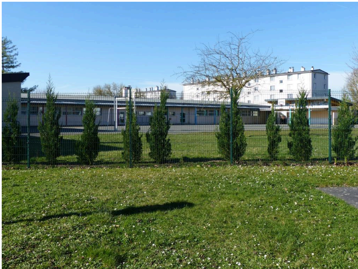
L'école primaire Roosevelt. Vue depuis la rue Marcel-Paul. La cour de récréation et le préau.