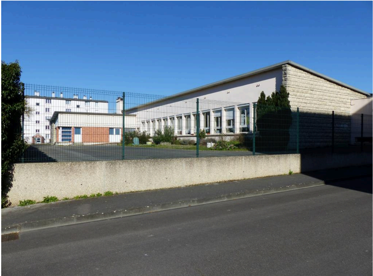
L'école primaire Roosevelt. Vue depuis la rue de la Résistance.