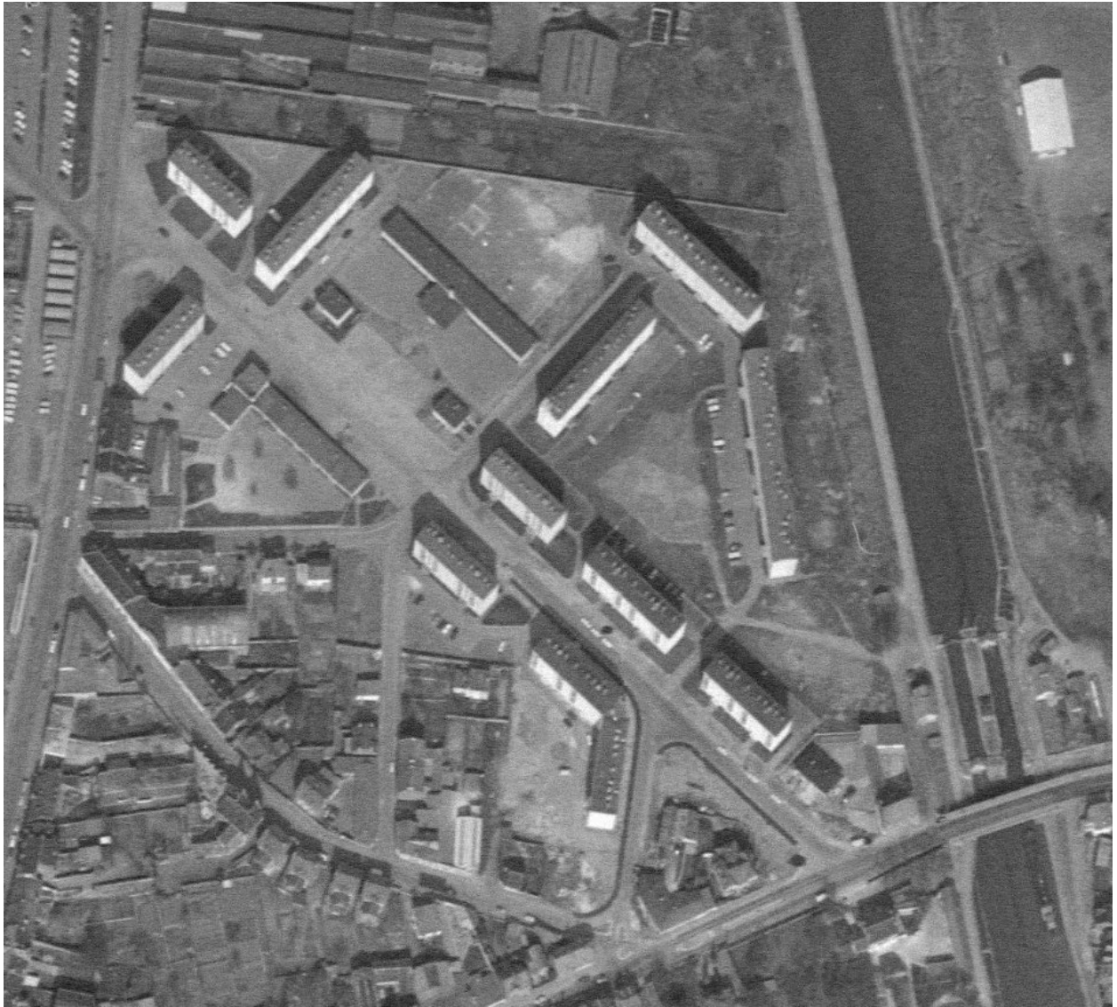
Vue aérienne de la nouvelle cité Roosevelt en 1972.