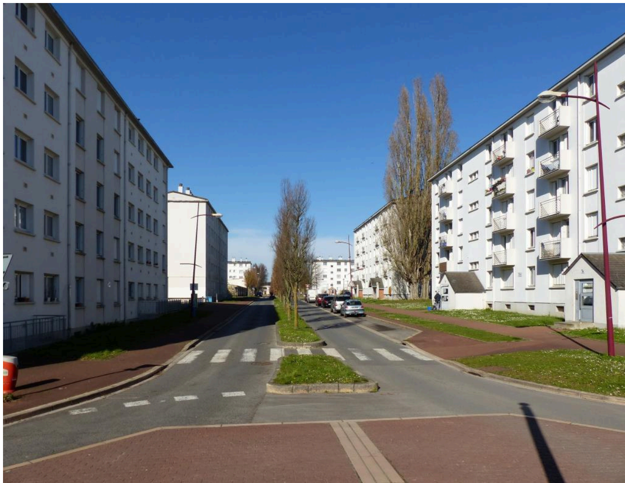
Le boulevard Roosevelt, vue vers le nord-ouest depuis le carrefour avec les rues de la Paix et Marcel-Paul.