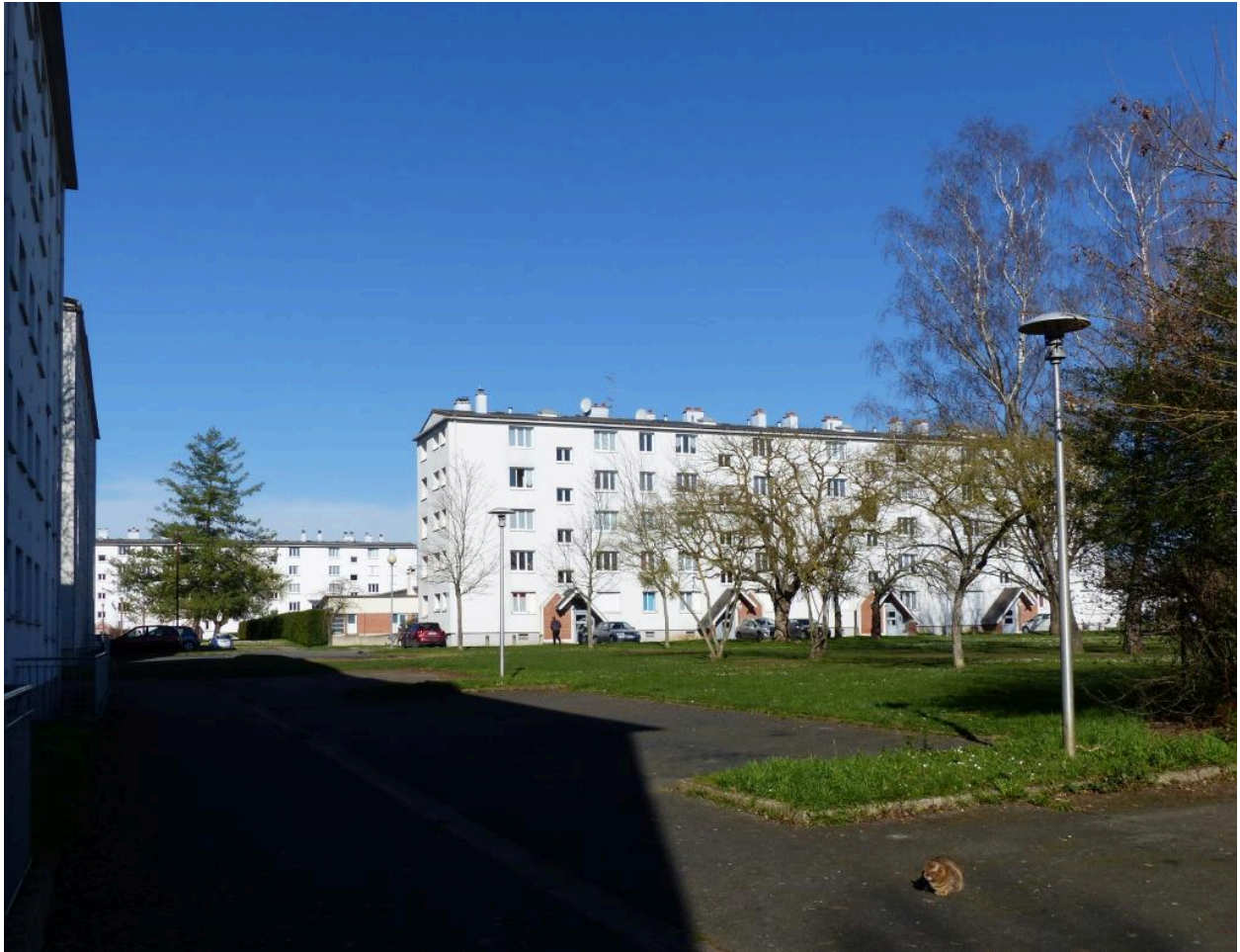
Le pavillon Lorraine.