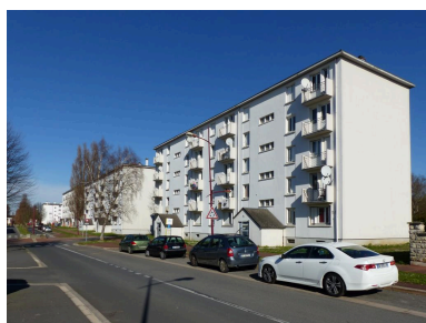
Le pavillon Franche-Comté. Boulevard Roosevelt. IVR32_20220205019NUCA