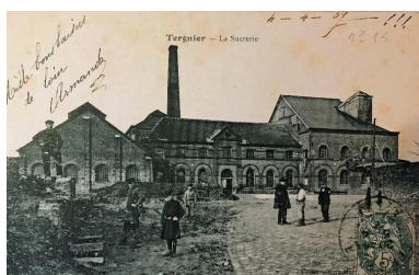
La sucrerie en 1907, carte postale.