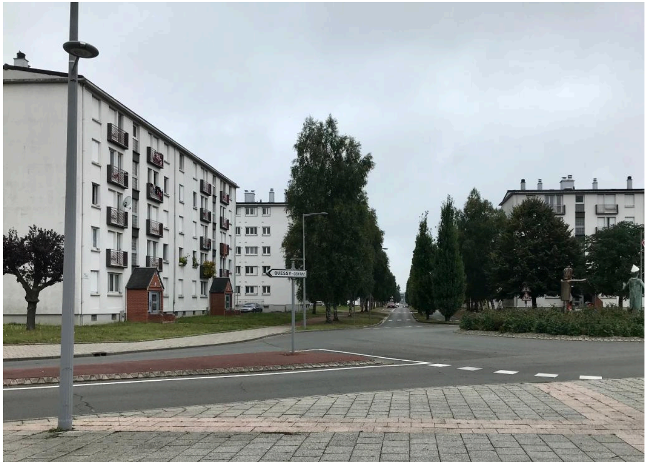
Vue de situation depuis le rond-point de la gare.