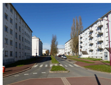
Le boulevard Roosevelt, vue vers le nord-ouest depuis le carrefour avec les rues de la Paix et Marcel-Paul. IVR32_20220205024NUCA