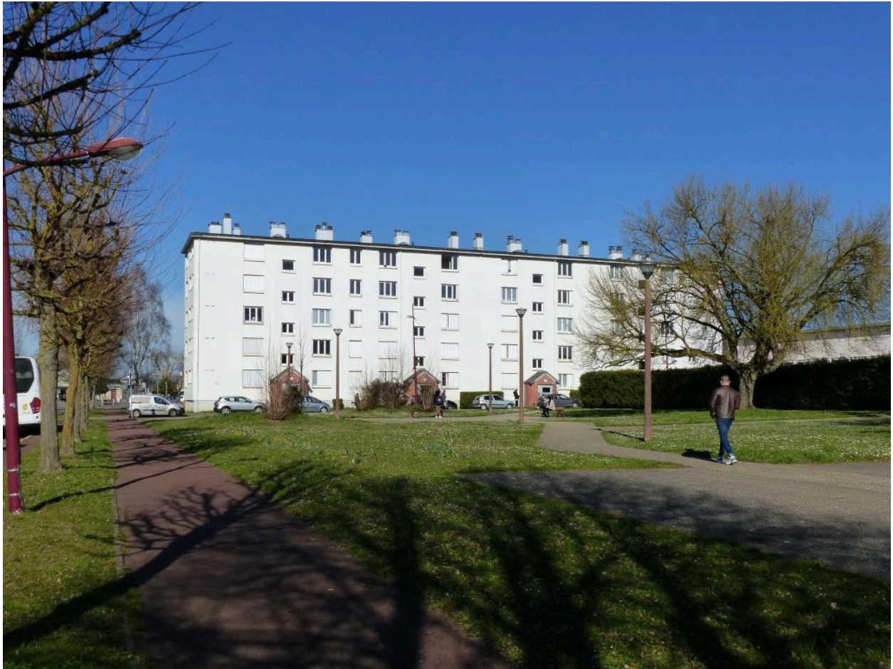
Le pavillon Artois, rue de la Fraternité.