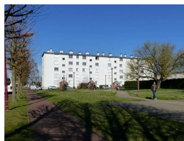
Le pavillon Artois, rue de la Fraternité.