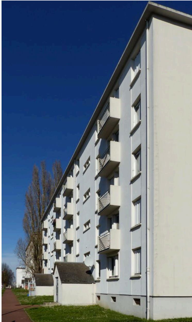
Le pavillon Ile-de-France, boulevard Roosevelt.