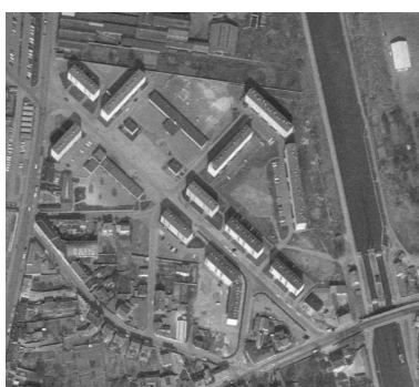
Vue aérienne de la nouvelle cité Roosevelt en 1972.