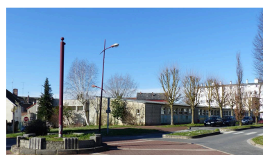
L'école maternelle.