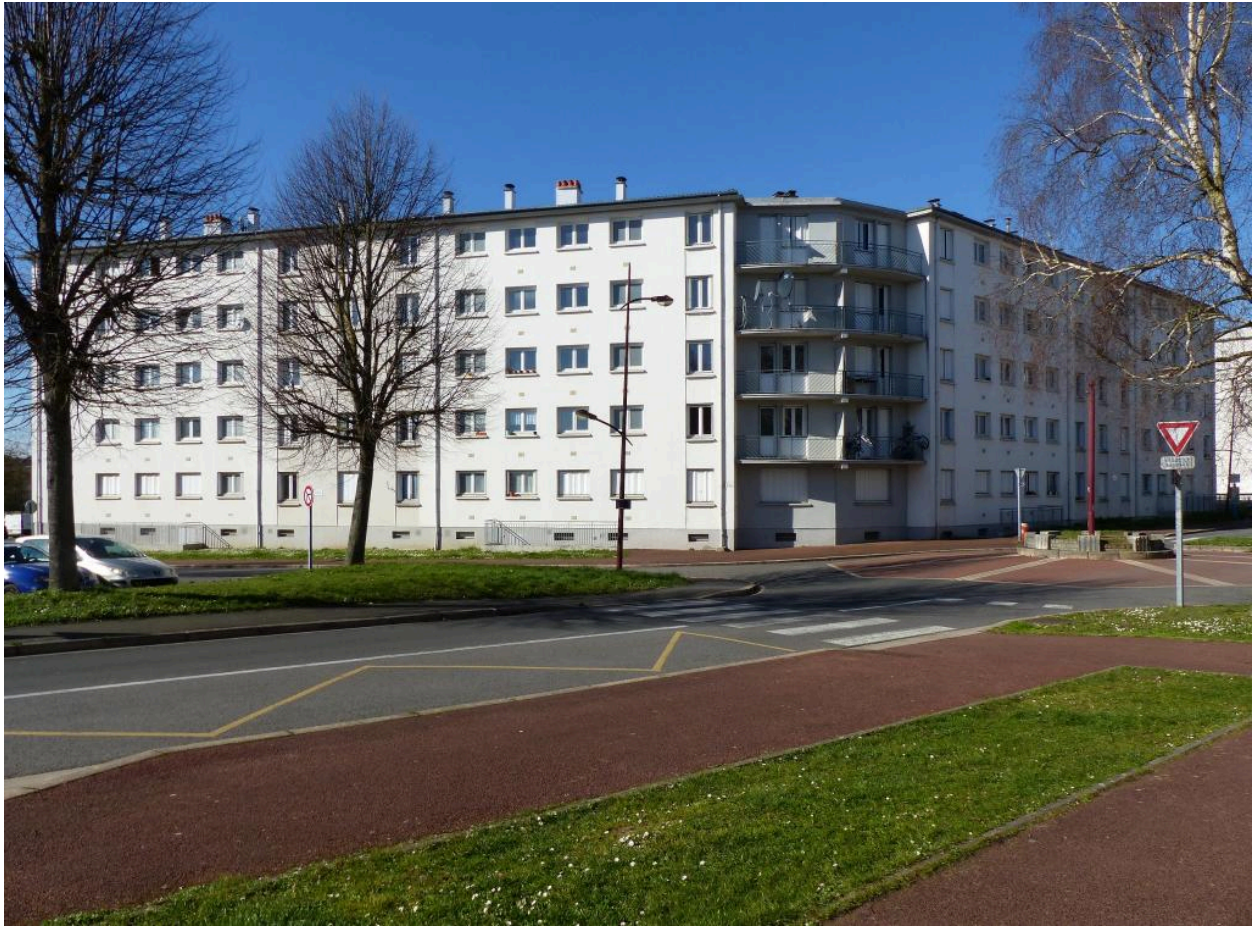
Les pavillons Bretagne et Auvergne.