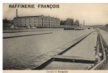
Les anciens entrepôts de sucres indigènes des Magasins généraux. Carte postale, début 20e siècle (coll. part.). IVR32_20210205175NUCA