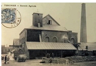
La sucrerie agricole de Tergnier, carte postale, vers 1910. IVR32_20170205042NUCA