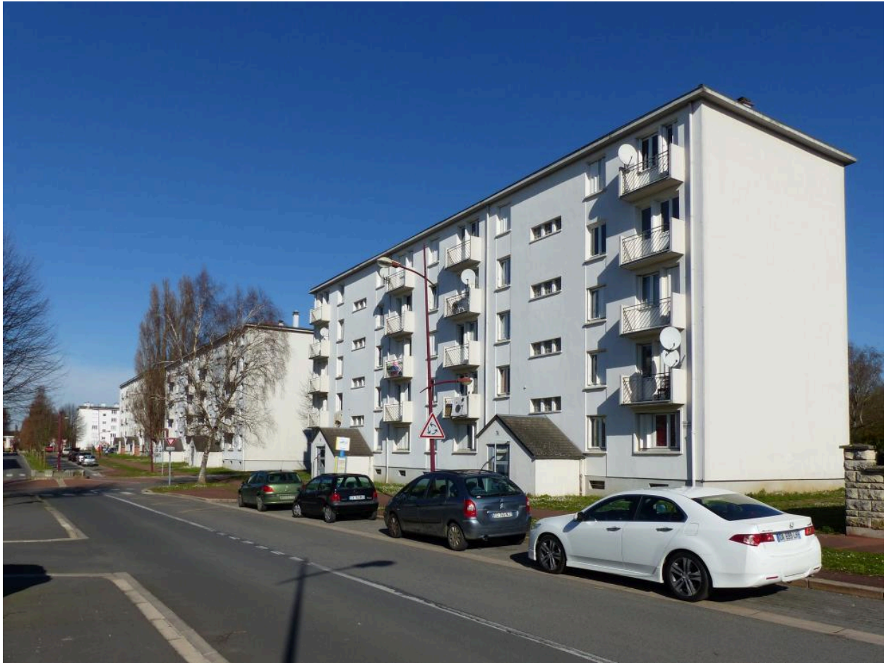
Le pavillon Franche-Comté. Boulevard Roosevelt.