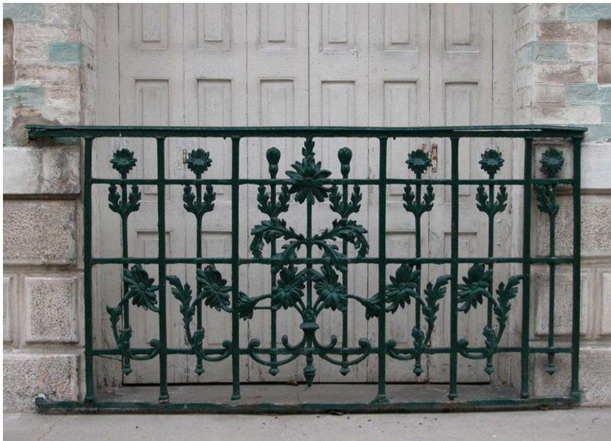
Vue du garde-corps en fonte de la baie du rez-de-chaussée.