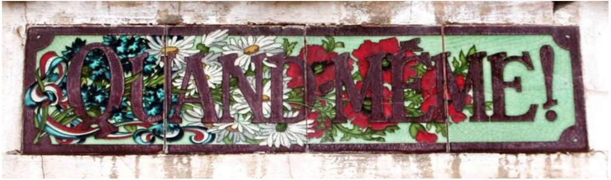
Détail des carreaux de céramique portant appellation.