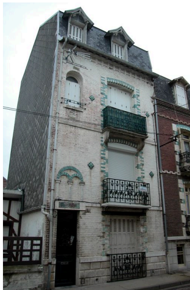
Vue d'ensemble depuis la rue. IVR22_20058002517NUCA