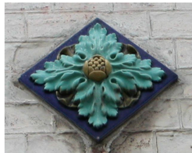
Détail d'un cabochon de céramique (faïencerie de Sarreguemines).