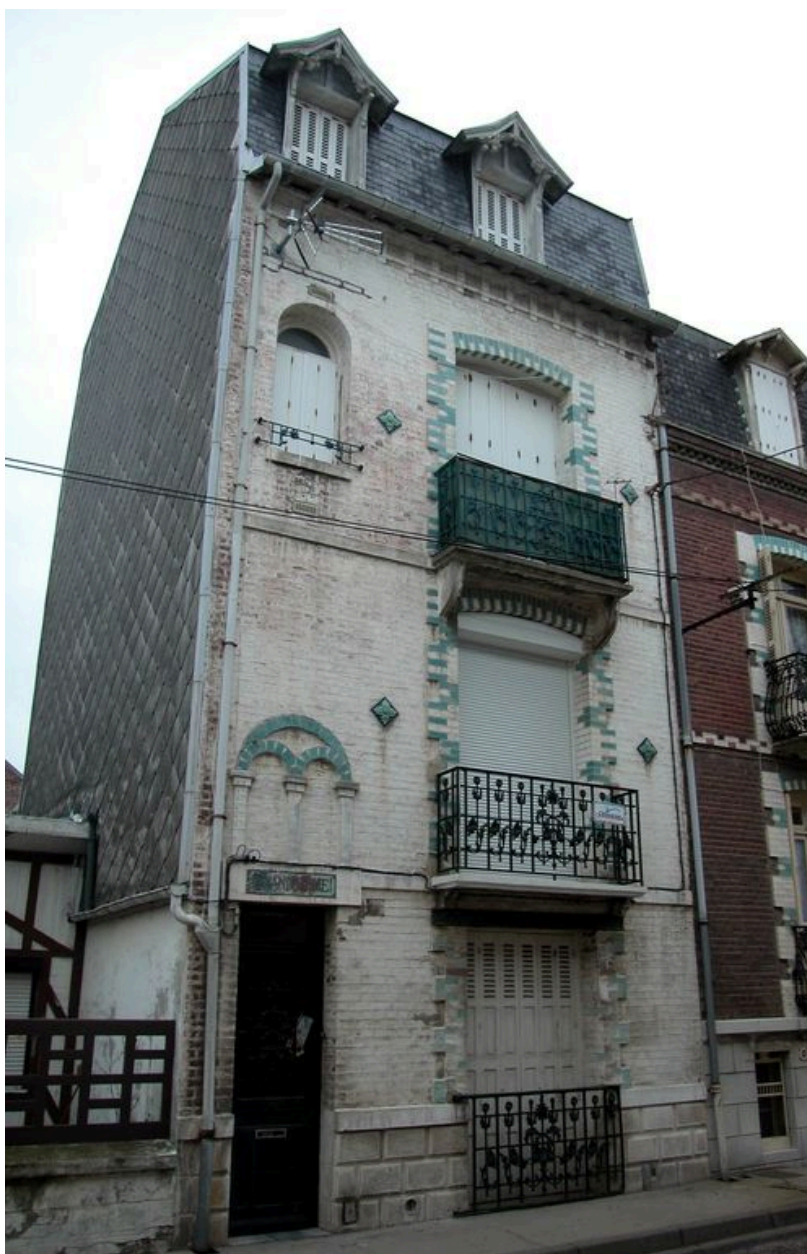
Vue d'ensemble depuis la rue.