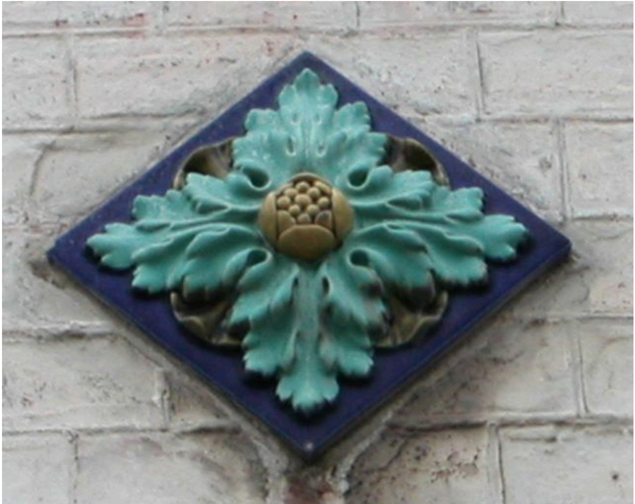
Détail d'un cabochon de céramique (faïencerie de Sarreguemines).