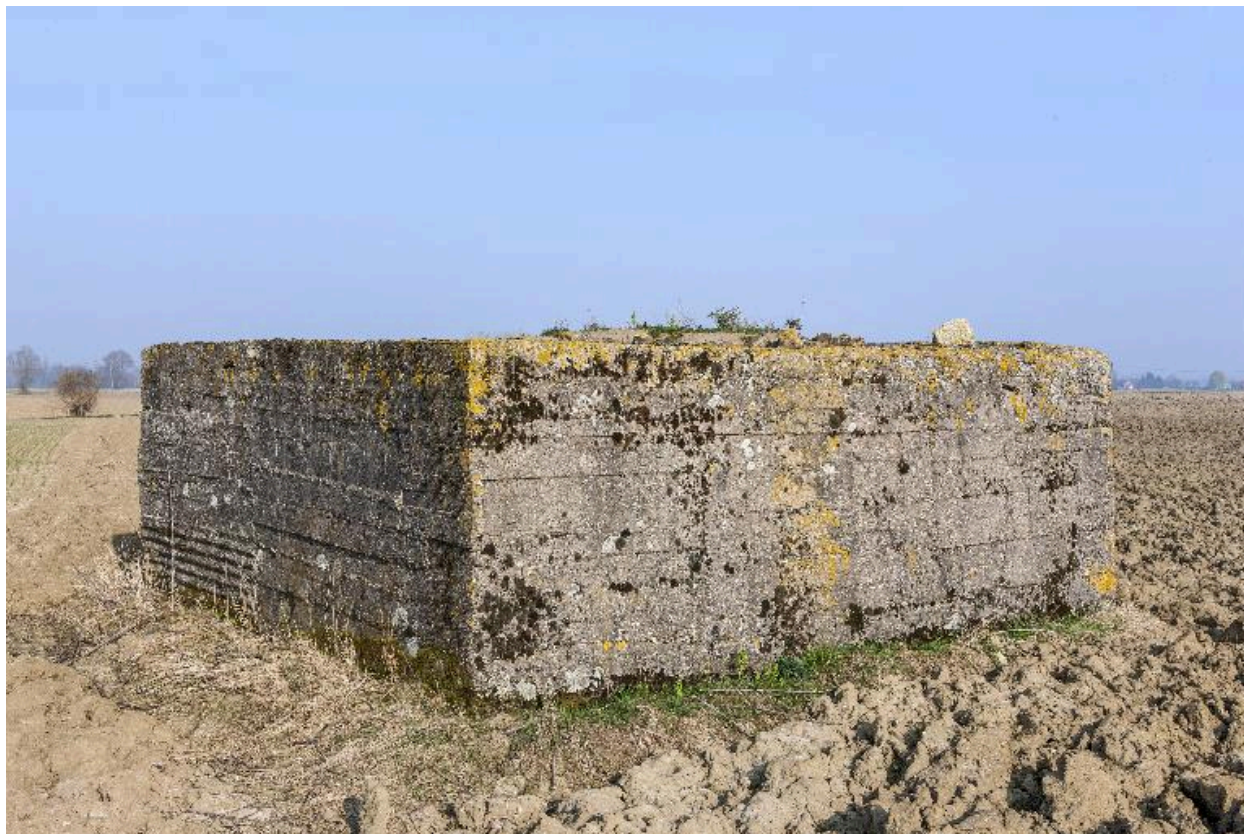
Vue vers le sud