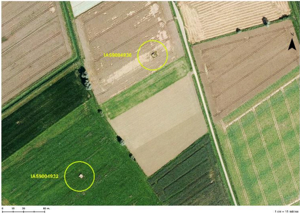
Position de l'édifice (cercle du bas) sur une photographie de 2014