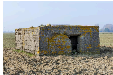
Vue vers le nord IVR31_20145905358NUCA