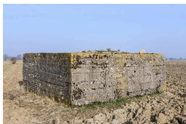
Vue vers le sud IVR31_20145905357NUCA