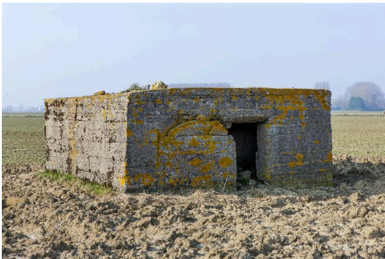
Vue vers le nord