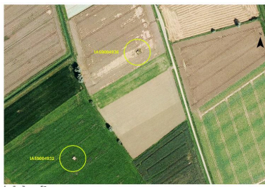
Position de l'édifice (cercle du bas) sur une photographie de 2014