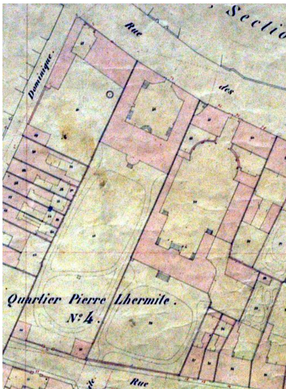
Extrait du cadastre de 1851.