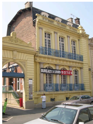
Vue sur le corps de logis aligné sur la rue des Jacobins.