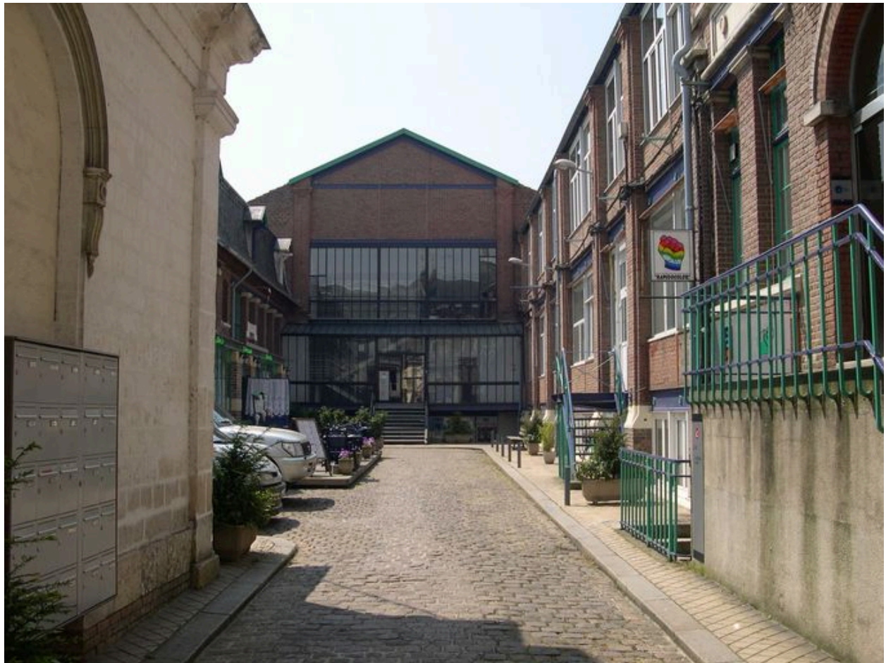
Vue de la cour intérieure.