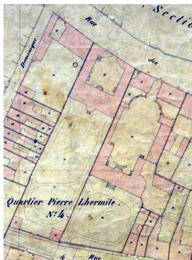
Extrait du cadastre de 1851. IVR22_20078012517NUCA