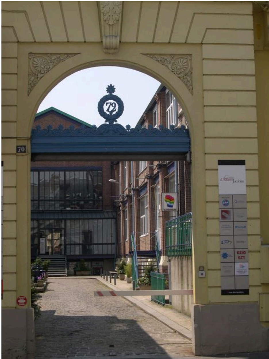
Vue du portail.