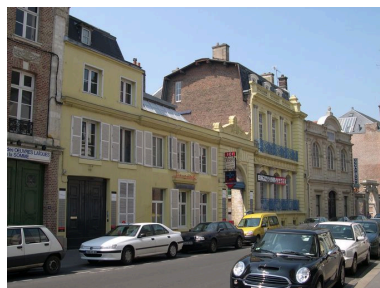
Vue générale. IVR22_20048010121NUCA