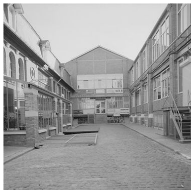
La cour intérieure en 1989.