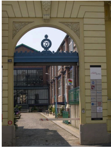
Vue du portail.