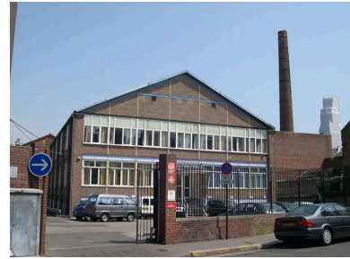
Vue depuis la rue Pierre- Lhermite, au sud. IVR22_20048010012NUCA