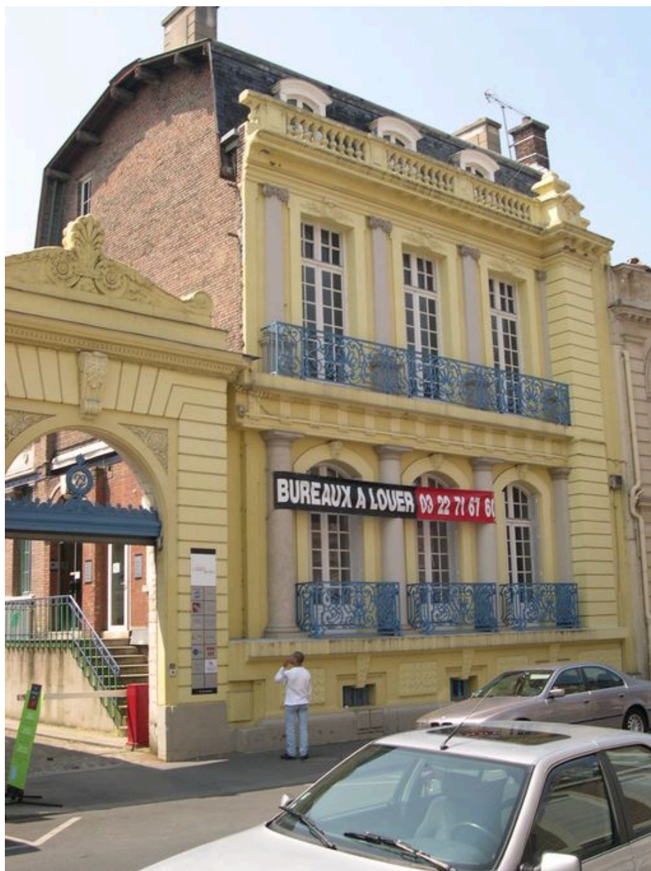
Vue sur le corps de logis aligné sur la rue des Jacobins.