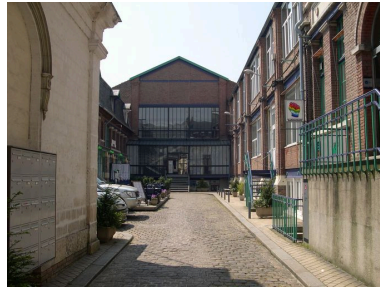
Vue de la cour intérieure.