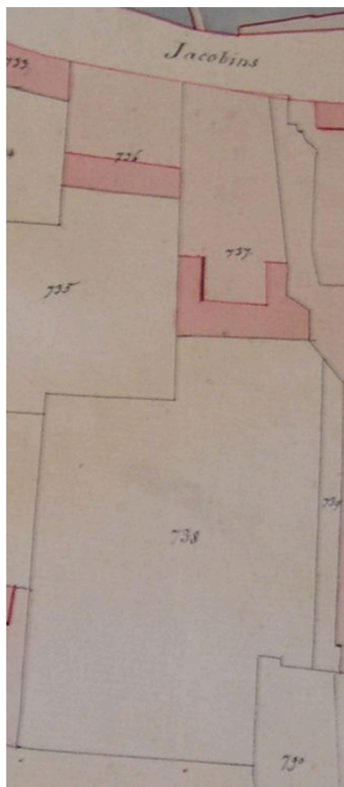
Extrait du cadastre de 1813.