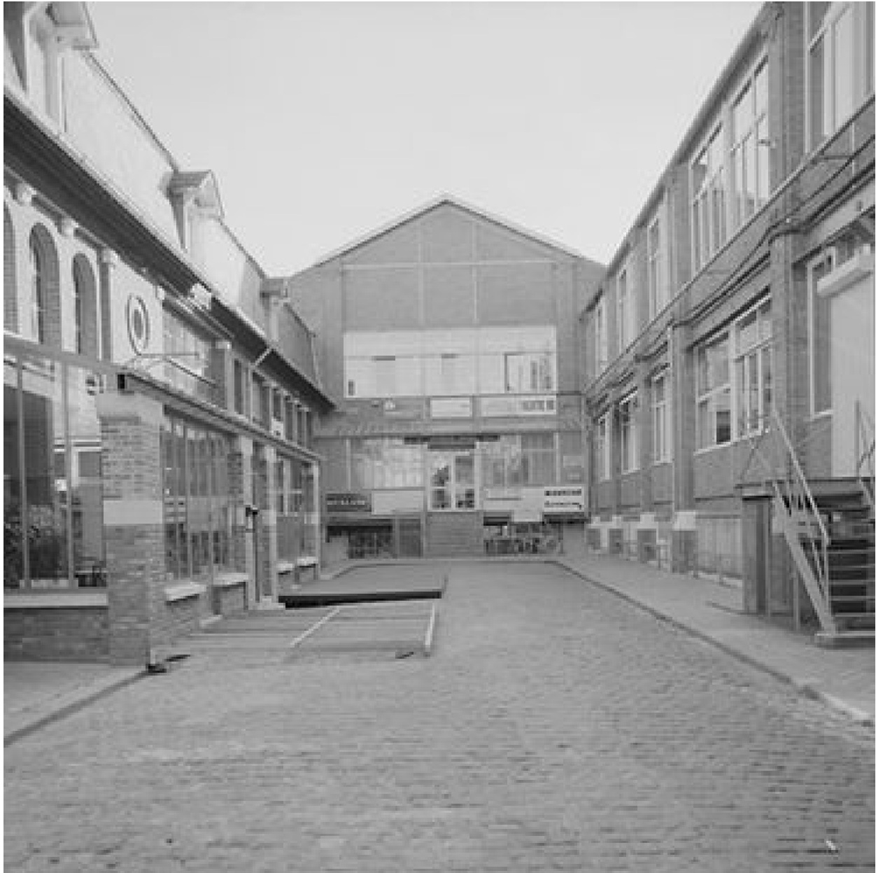
La cour intérieure en 1989.