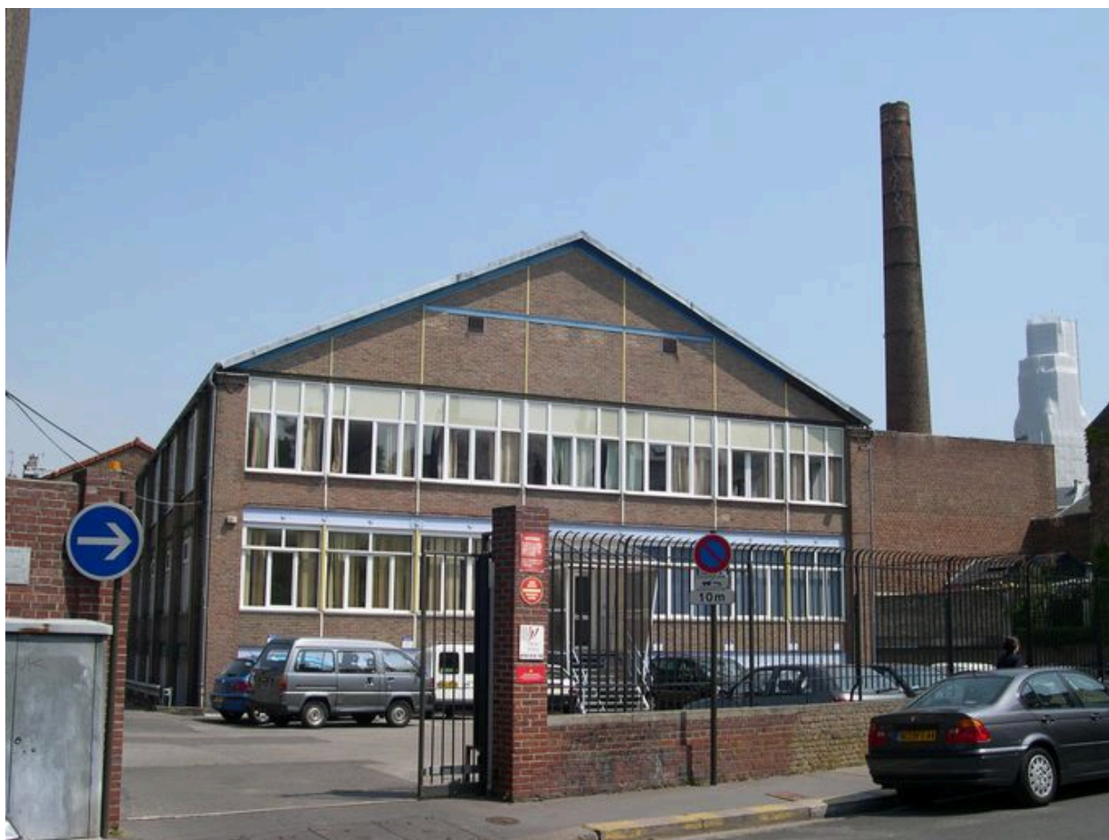
Vue depuis la rue Pierre-Lhermite, au sud.