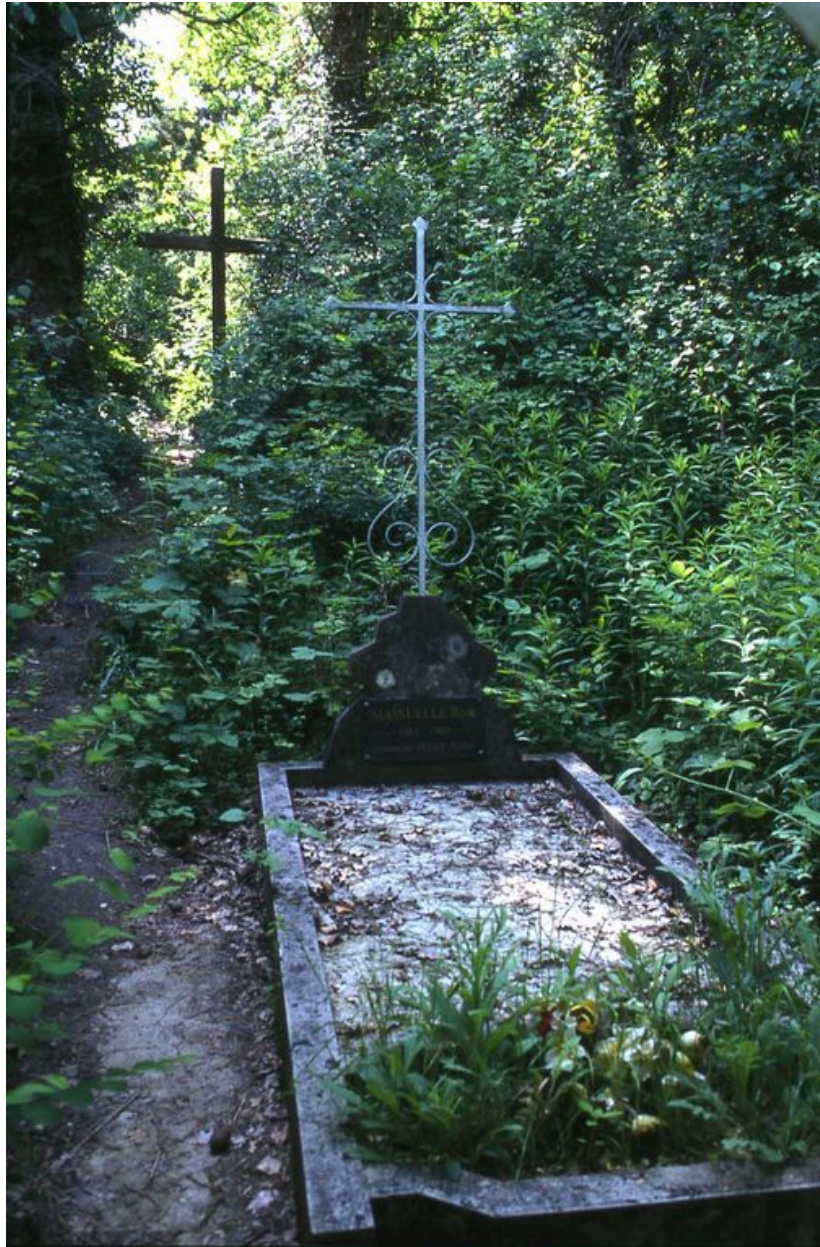
Vue d'une des tombes de l'ancien cimetière.