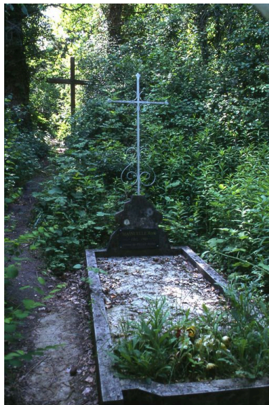
Vue d'une des tombes de l'ancien cimetière.