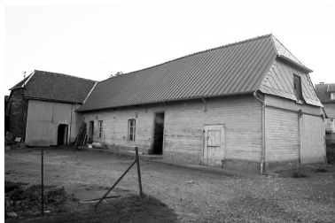
Vue générale. IVR22_19980202655Z

Plan de situation. Extrait du plan cadastral de 1991, section AB. IVR22_20080290089NUCA