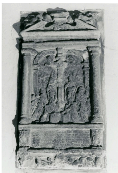
Vue générale IVR31_20106201998NUC