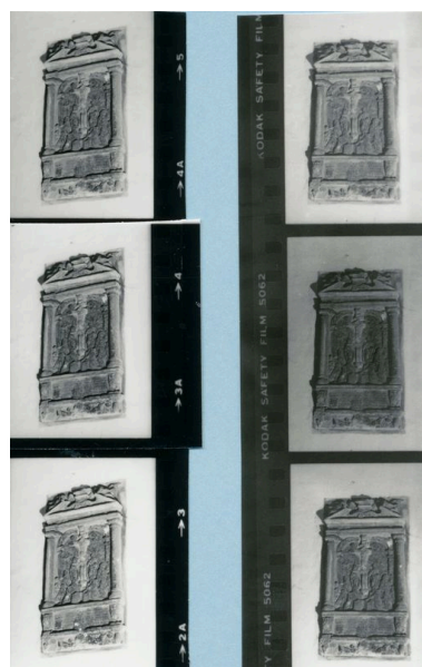
Vues générales IVR31_20106202010NUC