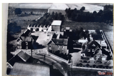
Vue aérienne du site industriel, prise de vue vers 1955-1960. IVR31_20055907452NUCA