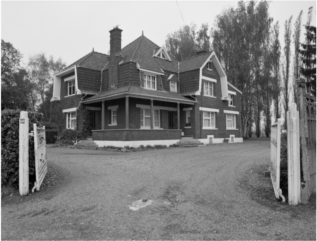
Vue générale de la villa patronale construite vers 1948-1949.