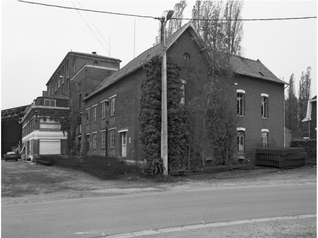
Vue de l'entrée du site depuis la rue, à droite, le premier bâtiment de 1924, à gauche le premier logis patronal construit vers 1925-1926.