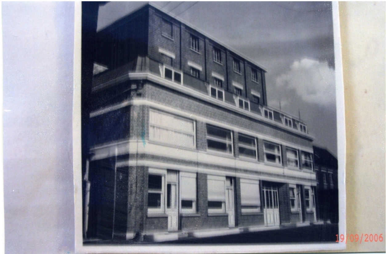
Façades du bâtiment de production de 1934 et des bureaux, prise de vue vers 1955-1960.