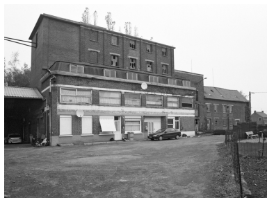
Façades du bâtiment de production construit en 1934 et des bureaux.

IVR31_20085901111X