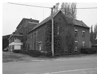
Vue de l'entrée du site depuis la rue, à droite, le premier bâtiment de 1924, à gauche le premier logis patronal construit vers 1925-1926. IVR31_20085901103X