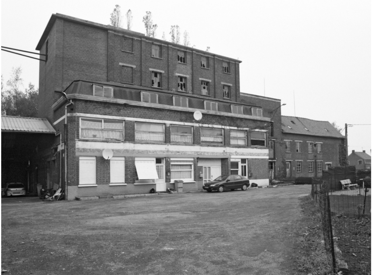
Façades du bâtiment de production construit en 1934 et des bureaux.