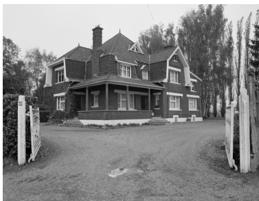
Vue générale de la villa patronale construite vers 1948-1949.