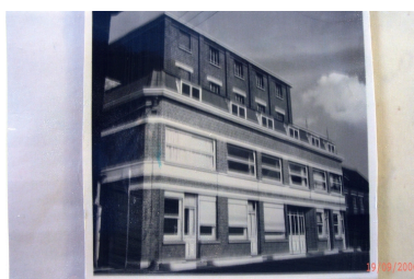
Façades du bâtiment de production de 1934 et des bureaux, prise de vue vers 1955-1960