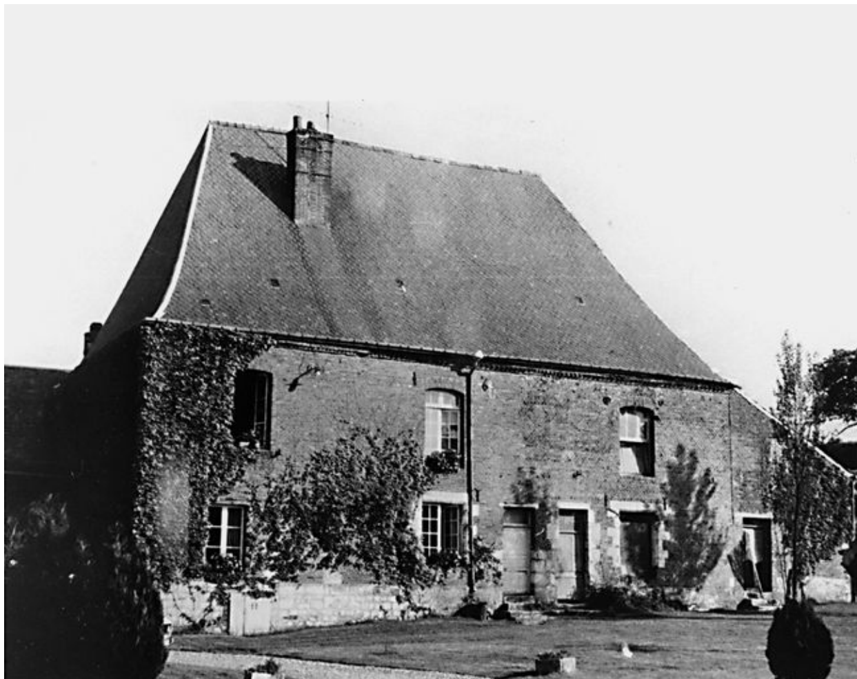
Vue de la façade antérieure dans les années 1960.