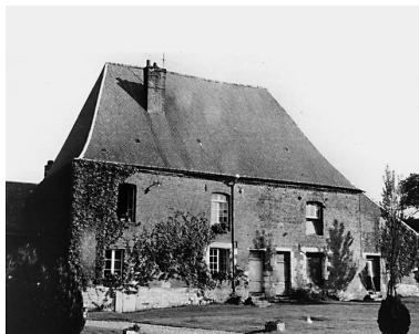
Vue de la façade antérieure dans les années 1960 (AP).