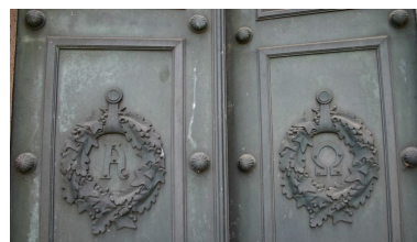
Détail du décor de la porte en fonte ouvragée : couronnes de feuilles de chêne et de lierre, entrelacées de rubans et ornées de l'alpha et de l'oméga. IVR22_20088000410NUCA