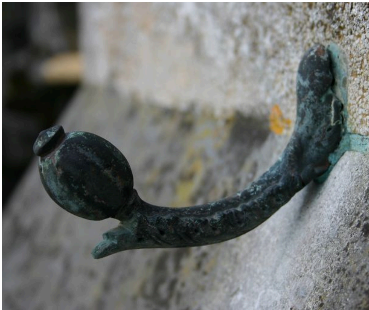
Détail de l'un des crochets ornant le tombeau-chapelle, à usage de porte-couronne et en forme de pavot.