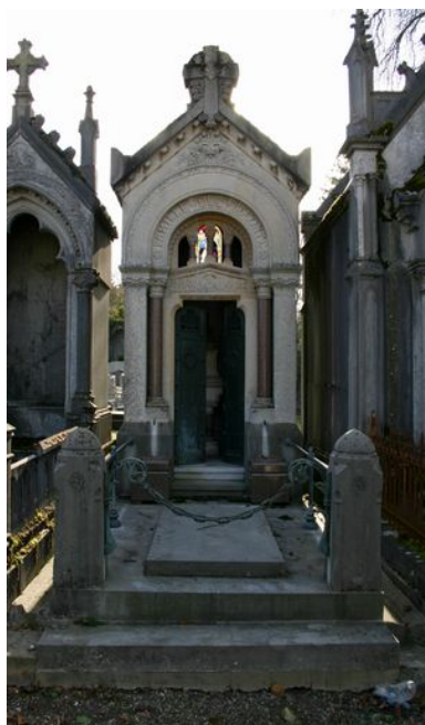
Vue générale. IVR22_20088000408NUCA