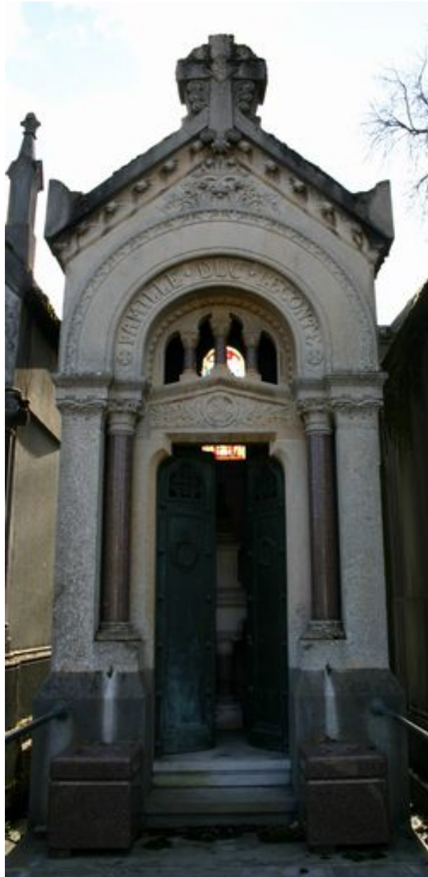
Tombeau en forme de chapelle.