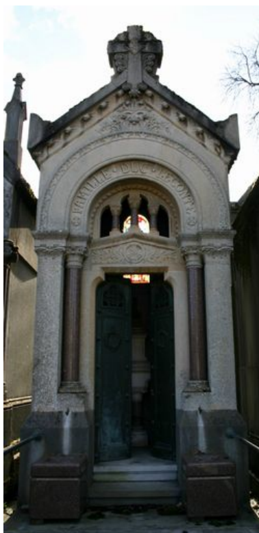
Tombeau en forme de chapelle. IVR22_20088000409NUCA