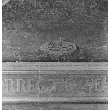
Détail de la signature et de la date. IVR22_19966003827X