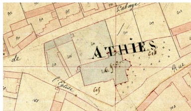
Extrait du cadastre napoléonien (AD Somme ; 3P).