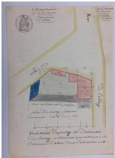
Procès-verbal d'arpentage et d'estimation des bâtiments de la commune, 1860 (AD Somme ; 990 425).