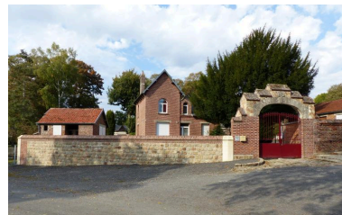
Vue générale. IVR32_20188005122NUCA