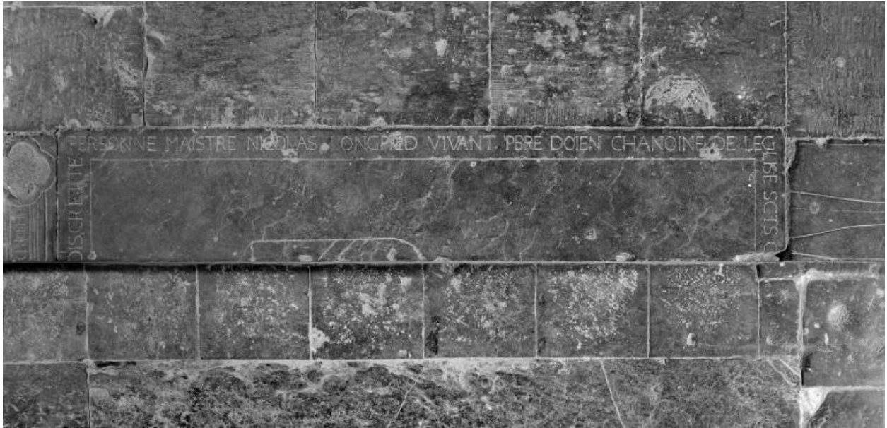
Vue du fragment droit de la dalle, portant une partie de l'épithaphe et des armoiries du défunt.