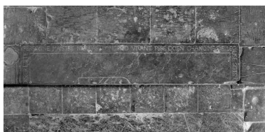
Vue du fragment droit de la dalle, portant une partie de l'épitaphe et des armoiries du défunt.