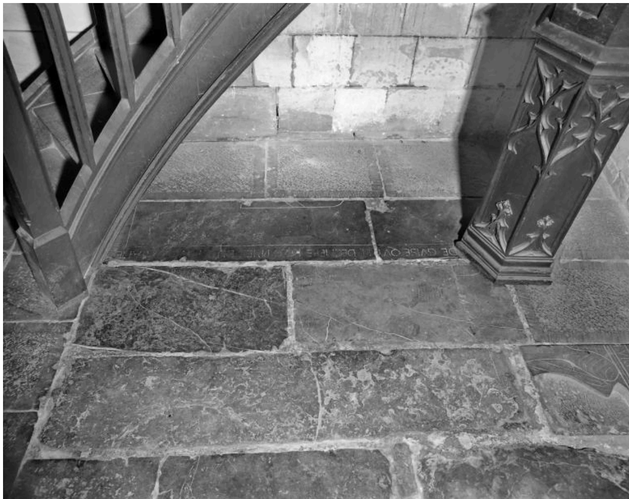
Vue des fragments gauches de la dalle, portant une partie de l'épitaphe et des armoiries du défunt.