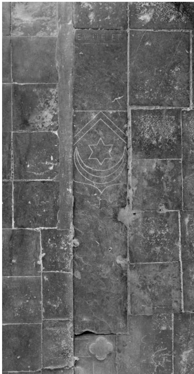
Vue du fragment central de la dalle, portant une partie de l'épithaphe et des armoiries du défunt.