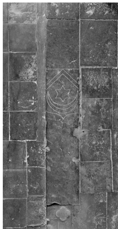
Vue du fragment central de la dalle, portant une partie de l'épitaphe et des armoiries du défunt. IVR22_19980200581X