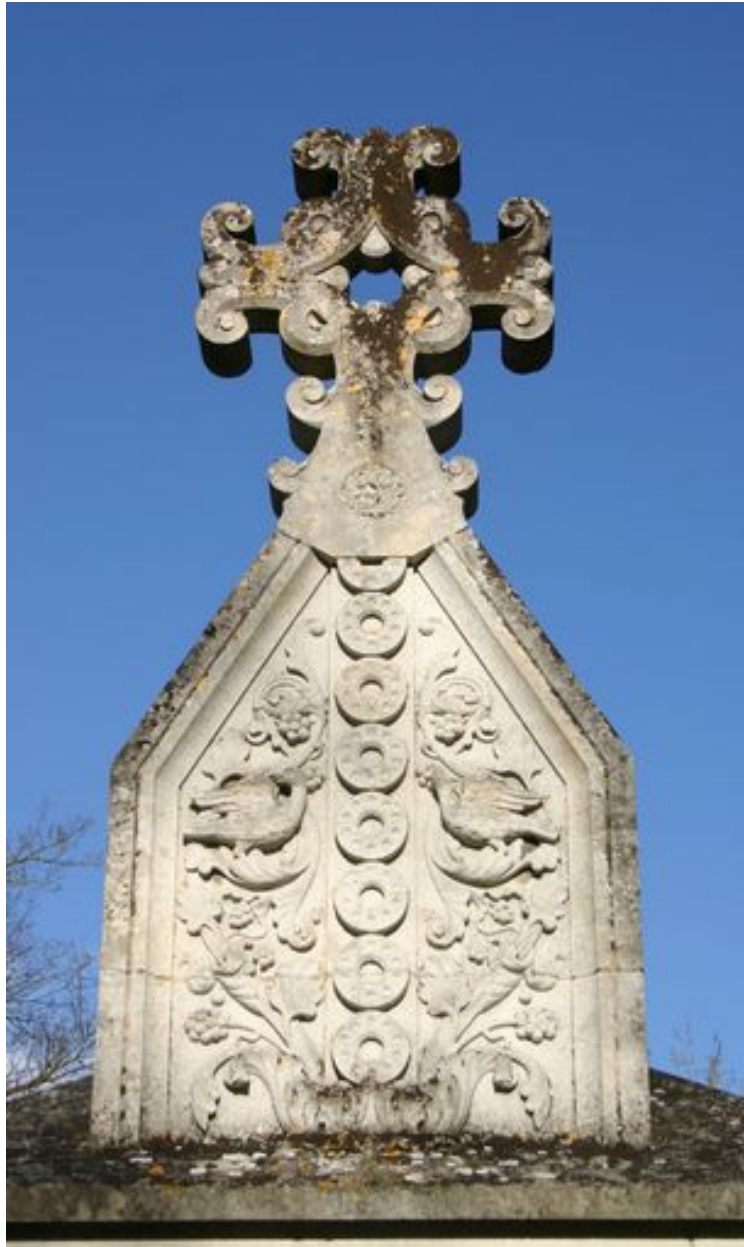
Détail du fronton sculpté du tombeau-monument.