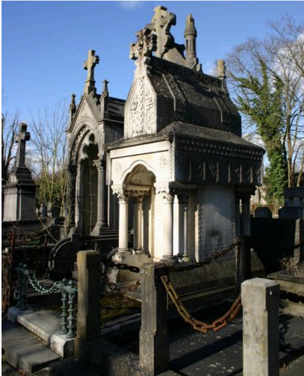
Vue générale, de trois-quarts.