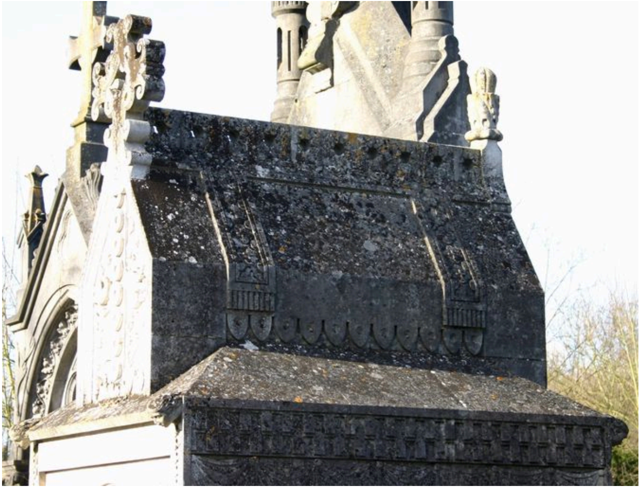
Détail de la partie supérieure du tombeau-monument.