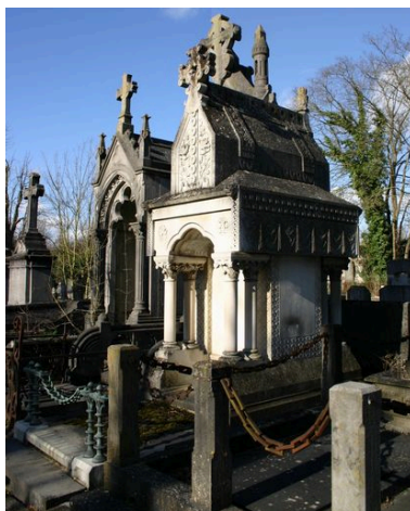
Vue générale, de trois-quarts.