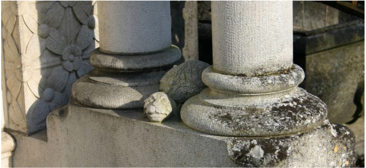
Détail du décor sculpté inférieur : animal fantastique, côté droit.