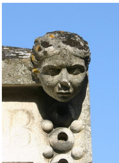
Détail du décor sculpté supérieur : visage humain, côté droit. IVR22_20088000366NUCA