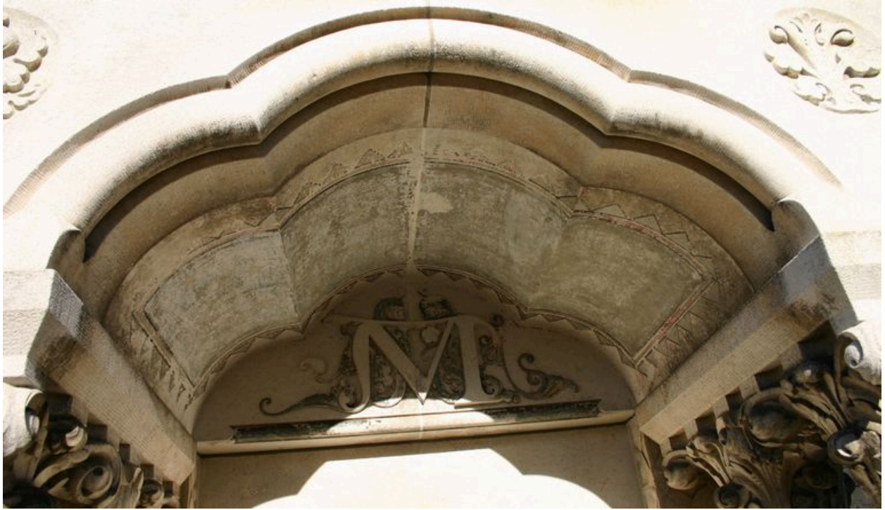
Détail du décor polychrome du tombeau-monument.