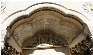
Détail du décor polychrome du tombeau-monument.