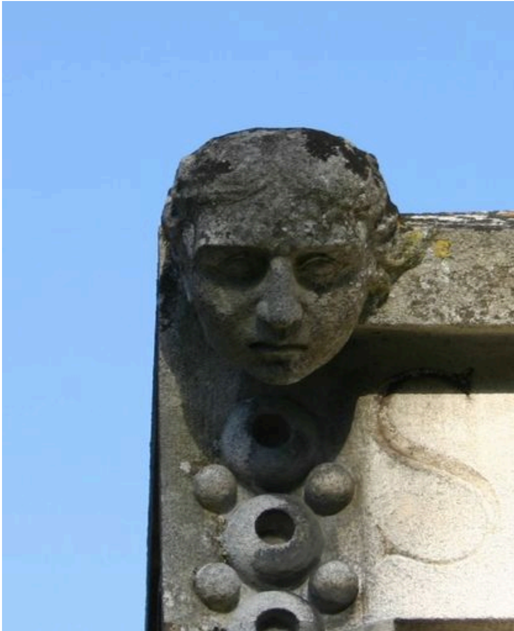
Détail du décor sculpté supérieur : visage humain, côté gauche.