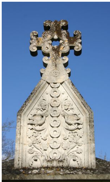
Détail du fronton sculpté du tombeau-monument. IVR22_20088000363NUCA

IVR22_20088000359NUCA