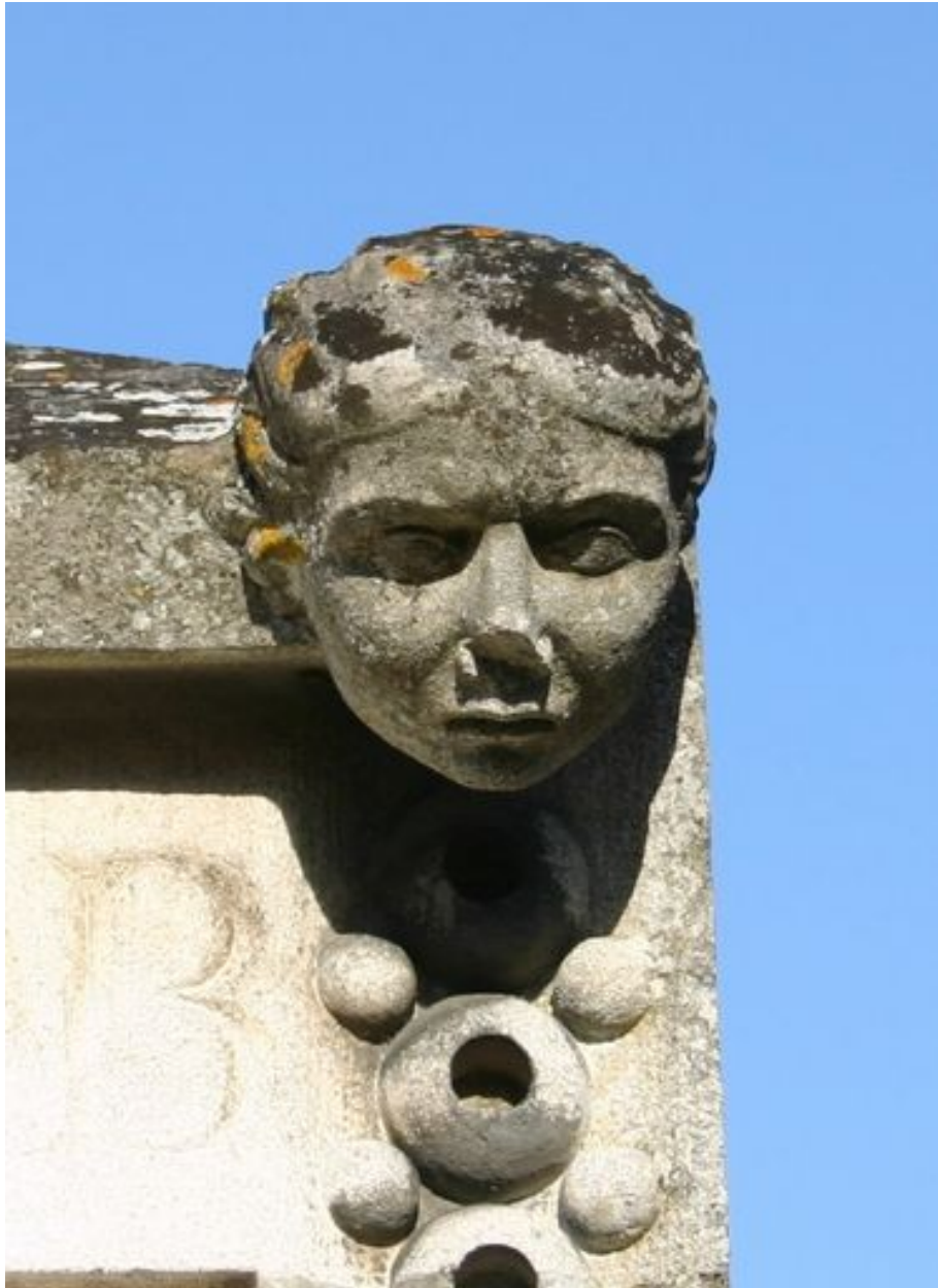
Détail du décor sculpté supérieur : visage humain, côté droit.