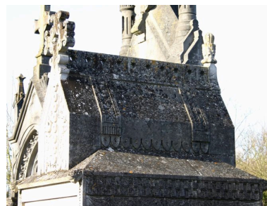
Détail de la partie supérieure du tombeau-monument.