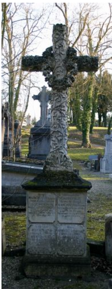
Stèle à croix (néorocaille). IVR22_20088000253NUCA