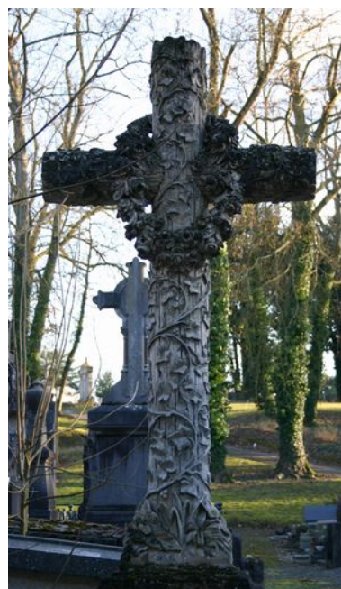
Détail du décor sculpté de la croix. IVR22_20088000254NUCA