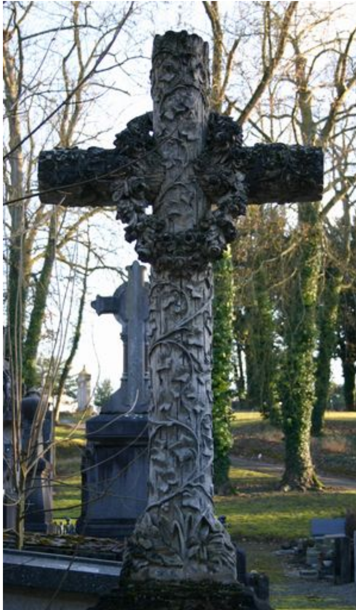
Détail du décor sculpté de la croix.