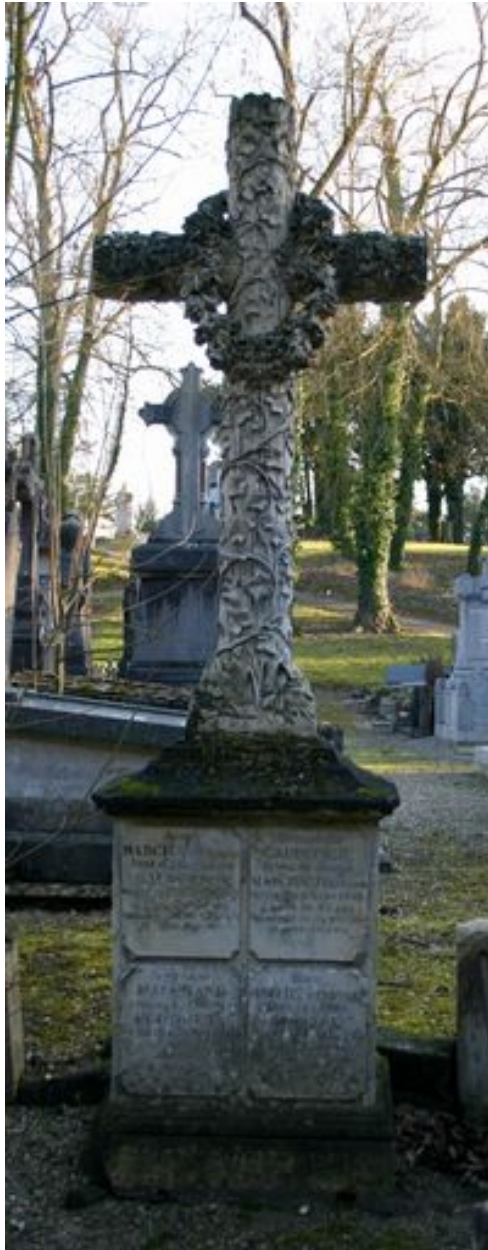
Stèle à croix (néorocaille).