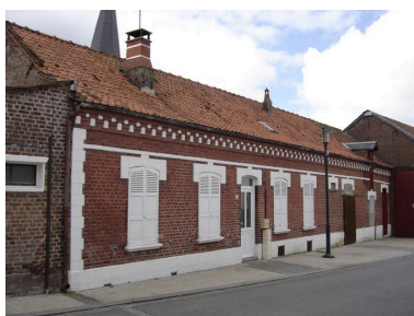
Vue générale du logis.