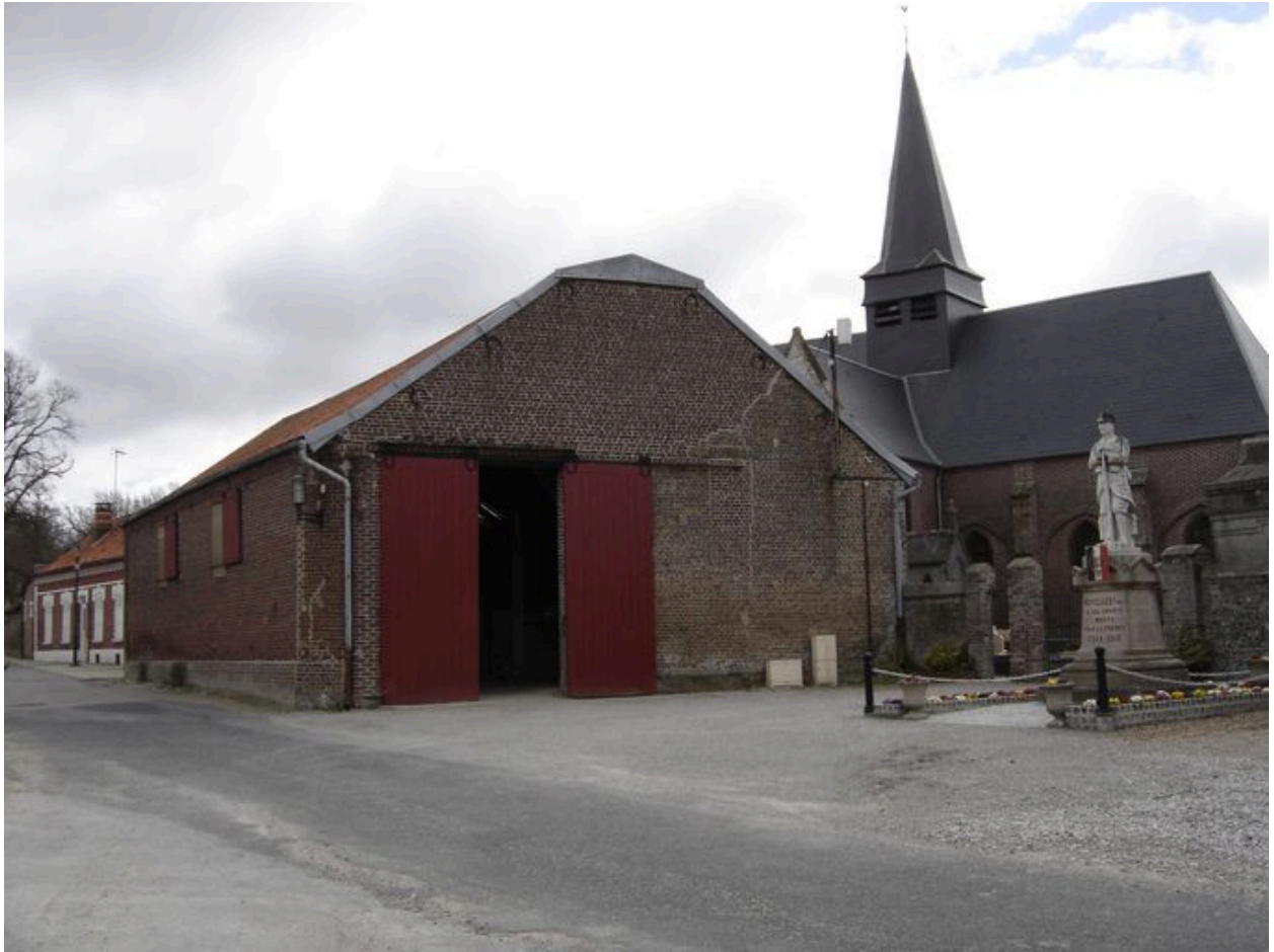
Autre vue latérale de la grange.