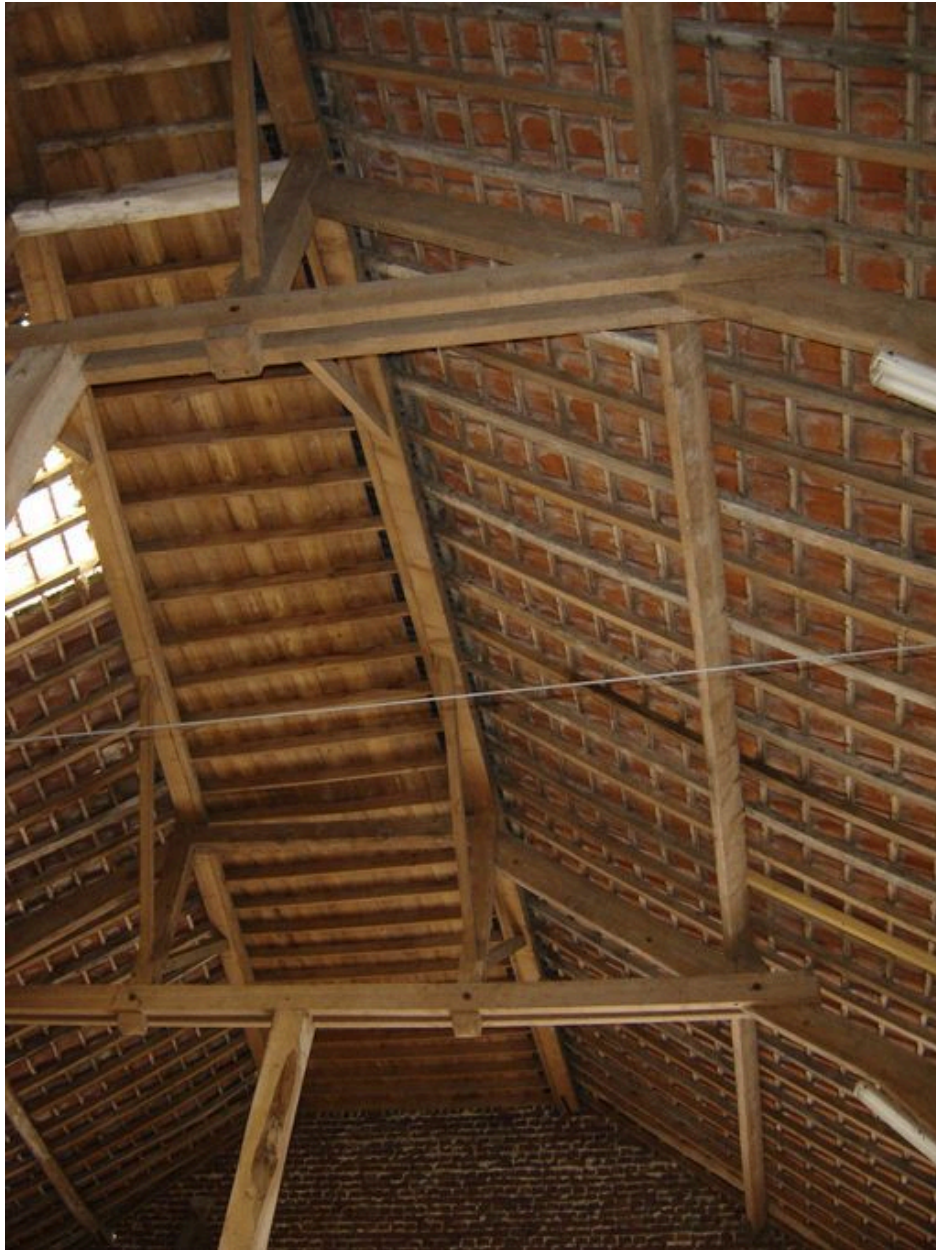
Vue intérieure de la grange.