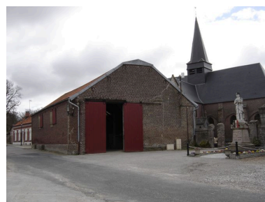
Autre vue latérale de la grange. IVR22_20058005335NUCA