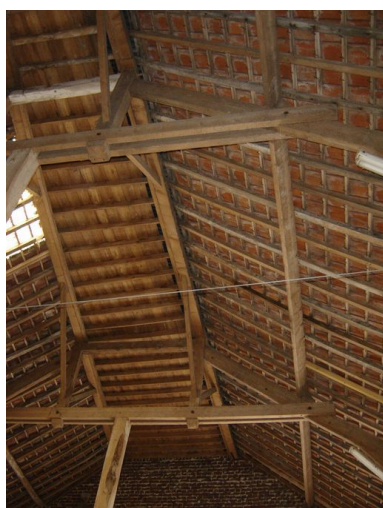
Vue intérieure de la grange.