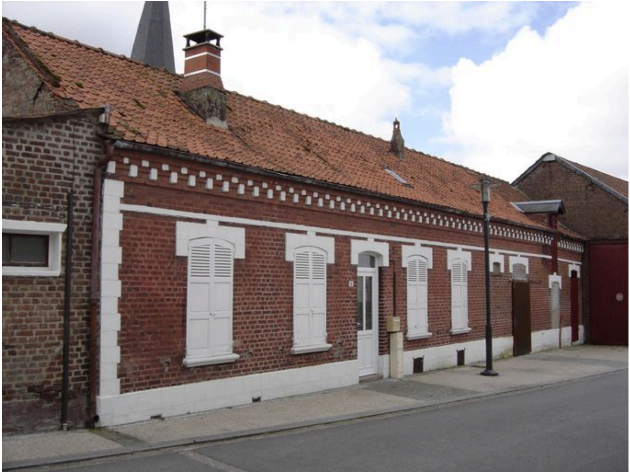
Vue générale du logis.