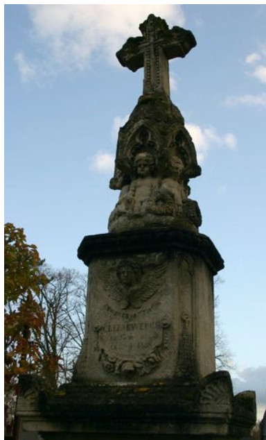
Détail de la partie supérieure sculptée.

Phot. Caroline Vincent IVR22_20098001649NUCA