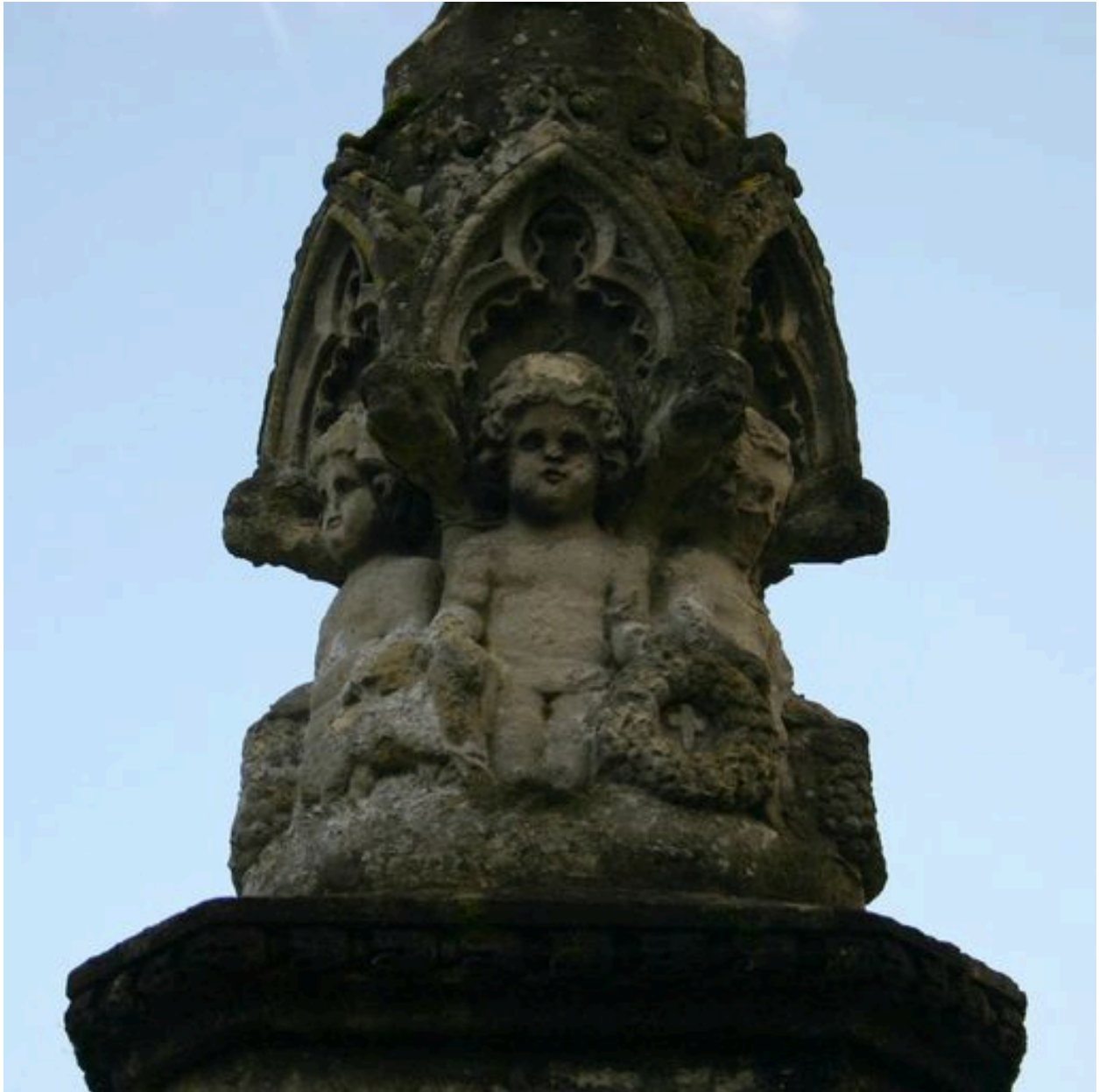
Détail du décor sculpté (ronde d'angelots).