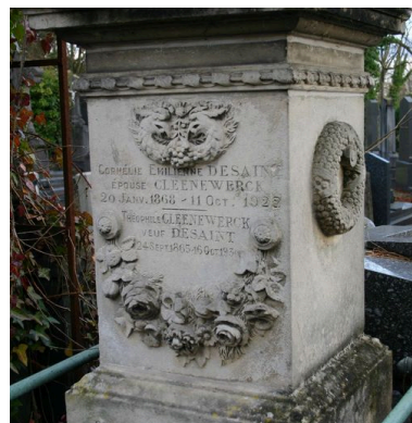
Détail du socle sculpté. IVR22_20098001648NUCA