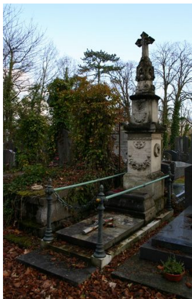
Vue générale. IVR22_20098001646NUCA