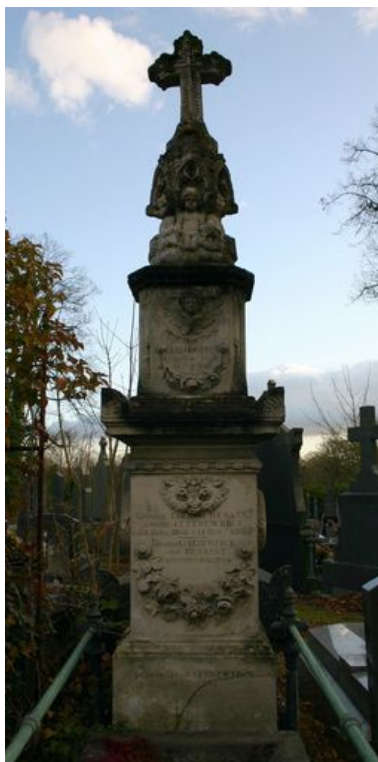
Stèle architecturée. IVR22_20098001647NUCA