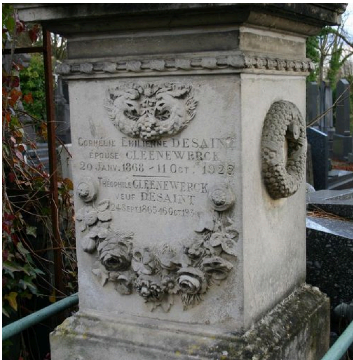
Détail du socle sculpté.