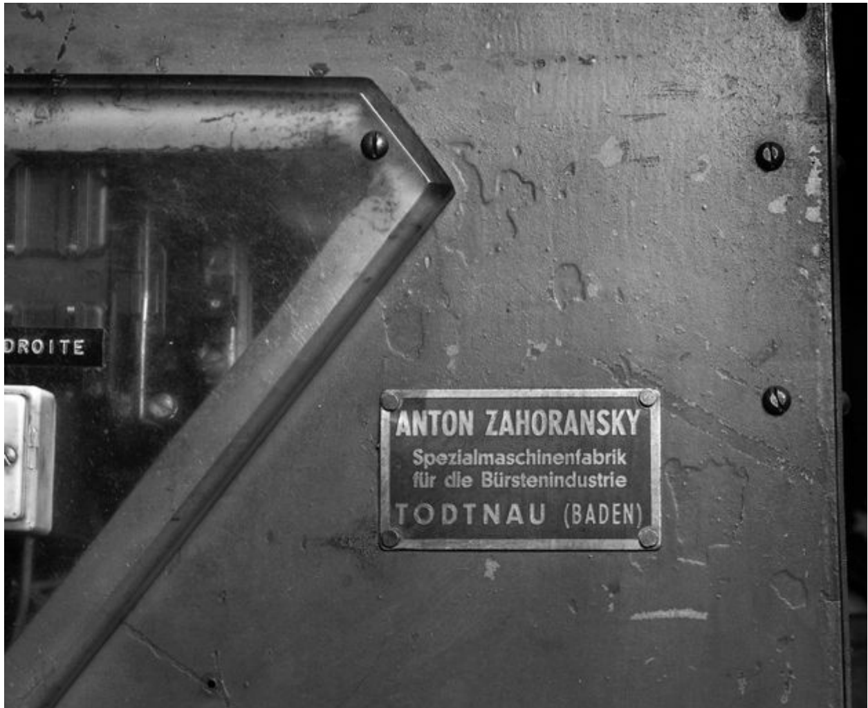
Détail de la plaque signalétique.