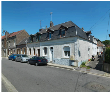
Vue générale. IVR22_20148000422NUC2A