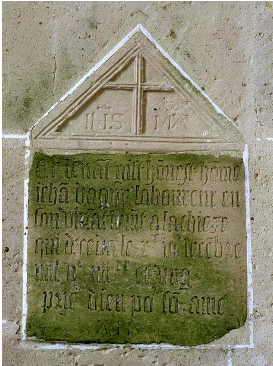
Vue de la plaque.