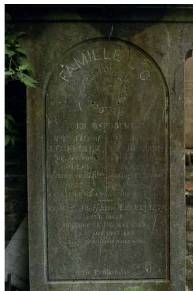
Table de la stèle. IVR22_20058001184NUCA