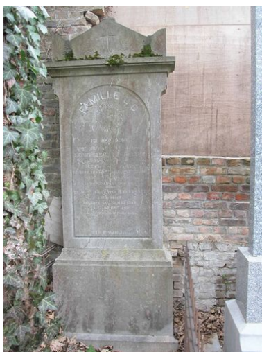
Vue de la stèle. IVR22_20048001322NUCA