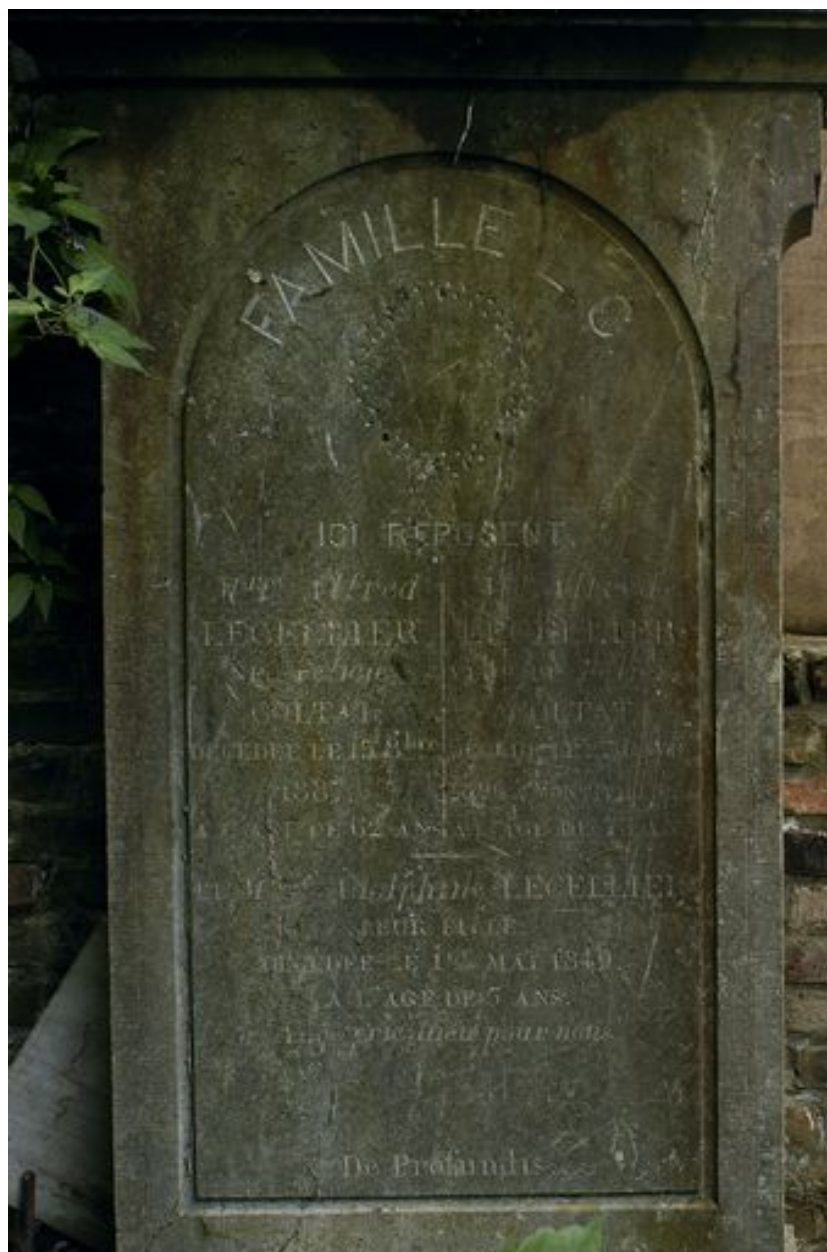
Table de la stèle.