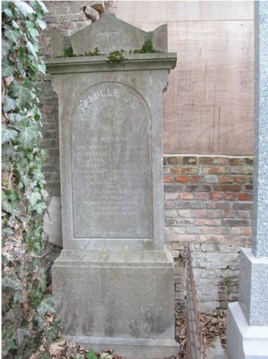
Vue de la stèle.